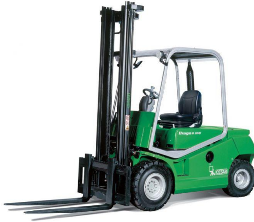
Slika 7. Viličar