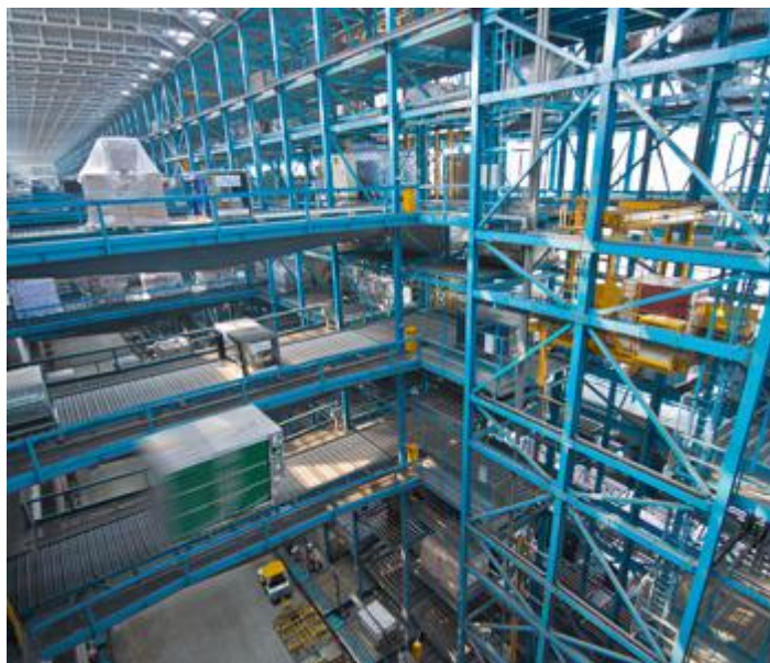
Slika 12. CSS sustav za kontejnerski teret