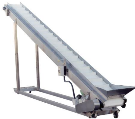
Slika 8. Primjer elevatorske trake

U manipulaciji teretom na zračnoj strani terminala, koriste se oprema za ukrcaj i iskrcaj ukrcajnih jedinica u zrakoplove, elevatorske trake za ukrcaj pojedinačnih pošiljaka te različiti modeli teretnih kolica za prijevoz ukrcajnih jedinica ili pojedinačnih pošiljaka. Razni modeli ukrcajnih platformi namijenjeni su isključivo ukrcaju ukrcajnih jedinica i koriste se na zrakoplovima opremljenim odgovarajućim sustavom. Za potrebe prihvata i otpreme zrakoplova bez tog sustava na kojima se odvija isključivo ukrcaj i iskrcaj pojedinačnih pošiljaka koriste se elevatorske trake (slika 8).