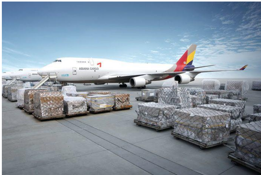
Slika 2. Primjer Air Charter zrakoplova