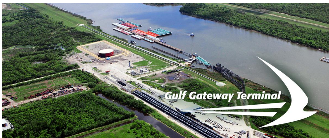
Slika 3. Primjer Gateway terminala

2. Gateway terminal (predstavlja vezu između različitih sustava, odnosno vrata određenog sustava. Može predstavljati vezu između različitih vidova transporta, a može biti i veza između različitih operatera, odnosno predstavlja glavnu točku preko koje se roba razmjenjuje između različitih nositelja realizacije lanca u usluzi „od vrata do vrata“, primjer Gateway terminala može se vidjeti na slici 3);