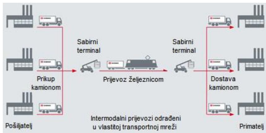
Slika 1. Primjer intermodalnog prijevoza

U cijelom svijetu zračni teretni promet pa tako i intermodalni transport u posljednjih je četrdeset godina zabilježio porast. Ukupan godišnji zračni teretni transport iznosi oko 30 milijardi tona, od toga 2/3 u međunarodnom transportu, a 50 % prometa je koncentrirano u 16 najvećih zračnih luka. O porastu zračnog cargo prometa svjedoči i to da je na uzorku od 63 zemlje svijeta utvrđeno da je u razdoblju od 1972. do 2002. godine BDP porastao za 154 %, trgovinska razmjena za 355 %, a zračni cargo promet za 1395 % (prema World Bank, „World Development Indicators,“ 2002, & Kenan Institute for Air Commerce).[2]