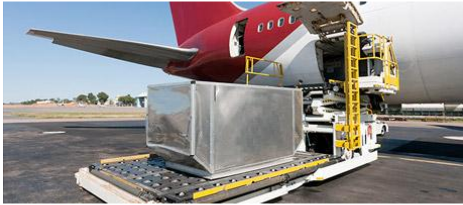
Slika 9. ULD