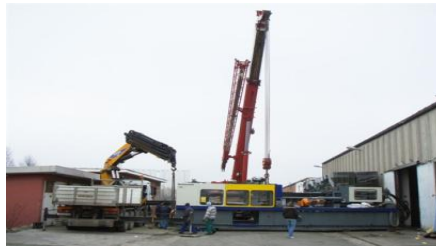
Slika 6. Manipulativna sredstva

Manipulativna sredstva (slika 6) za prihvat i otpremu o kojima će više riječi biti u sljedećem poglavlju ovise o karakteru pošiljke (kategorija tereta, vrsta pakiranja, dimenzije i težina tereta koji se prevozi) i variraju od jednostavnih sredstava manipulacije poput ručnog viličara do složenih manipulativnih sredstava. Prijevozna sredstva u procesu prihvata i otpreme razlikuju se ovisno o fazi unutar koje su angažirana. Primjerice, cestovna se prijevozna sredstva koriste na relacijama za koje predviđeni promet tereta premašuje zrakoplovne kapacitete koji su dostupni za pojedini let ili su dimenzije tereta takve da se ne mogu prevesti zrakoplovnom na određenom letu. Međutim, tada se prijevoz cestovnim sredstvima i dalje smatra prijevozom zračnim prometom.