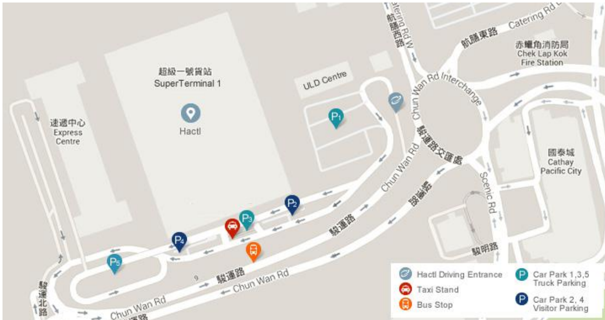
Slika 11. Plan SuperTerminala

i tako ih transportirati. U konačnici, SuperTerminal 1 čine dvije građevine: terminal podijeljen u šest smještajnih odjeljaka i ekspresni centar (slika 11), a zajedno mogu obraditi 2,6 milijuna tona tereta, gotovo dvostruko koliko je londonski Heathrow mogao obraditi 1997. godine kroz svojih 16 zrakoplovnih skladišta [16].