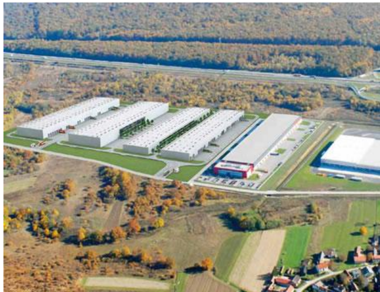
Slika 4. Primjer logističkog parka

7. logistički park (prostor koji čine različiti korisnici i davatelji usluga iz područja logistike, transporta i ostalih, dopunskih i pratećih sustava i usluga. U jednom logističkom parku može se naći više distributivnih centara i različitih terminala, skladišta, trgovačkih centara i slično, primjer logističkog parka prikazan je na slici 4);