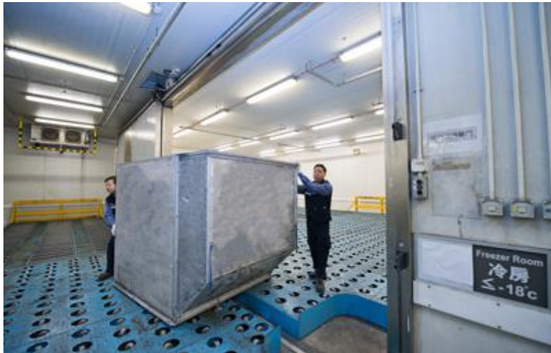
Slika 13. Rukovanje kvarljivom robom u SuperTerminalu 1