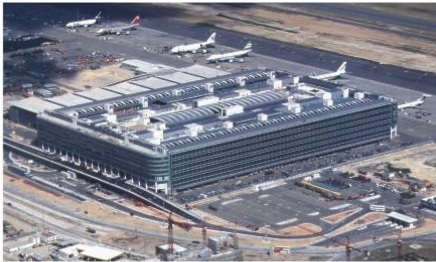
Slika 10. SuperTerminal1

Hong Kong Air Cargo Terminals Limited (HACTL) je jedan od najvećih svjetskih zračnih cargo terminala s jedinstvenim prvoklasnim postrojenjima, visoko učinkovitim operacijama i inovativnom tehnologijom. SuperTerminal 1 (slika 10), izgrađen 1976. godine, je jedini i najveći višekatni zračni cargo terminal na svijetu sa 3500 mjesta za kontejnere, 10000 mjesta za kutije i mnogobrojnim postrojenjima za razne vrste tereta, od proizvoda u kontroliranim temperaturnim uvjetima do žive stoke. Ovaj terminal može podnijeti preko 3,5 milijuna tona zračnog tereta svake godine.