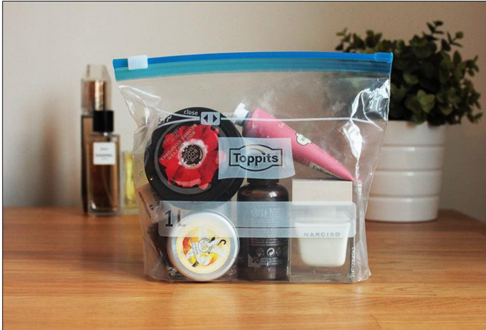
Slika 6: Kozmetika u namjenskoj zapečaćenoj vrećici (STEB) (URL 6)