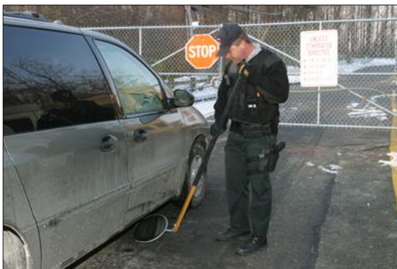
Slika 4: Pregled donjeg vanjskog dijela vozila sa sfernim ogledalom (URL 4)

Potrebno je pregledati donji vanjski dio vozila sa sfernim ogledalom, potrebno je izvršiti pregled motora sa baterijom i malim sfernim ogledalom, pregled prtljažnika vozila ručno sa baterijom, i pregled unutrašnjosti vozila također ručno sa baterijom. Kod zaštitnog pregleda vozila i osoba cilj je onemogućiti unošenje oružja, eksplozivnih i zapaljivih naprava, opasnih zabranjenih predmeta (Borković, 2015).