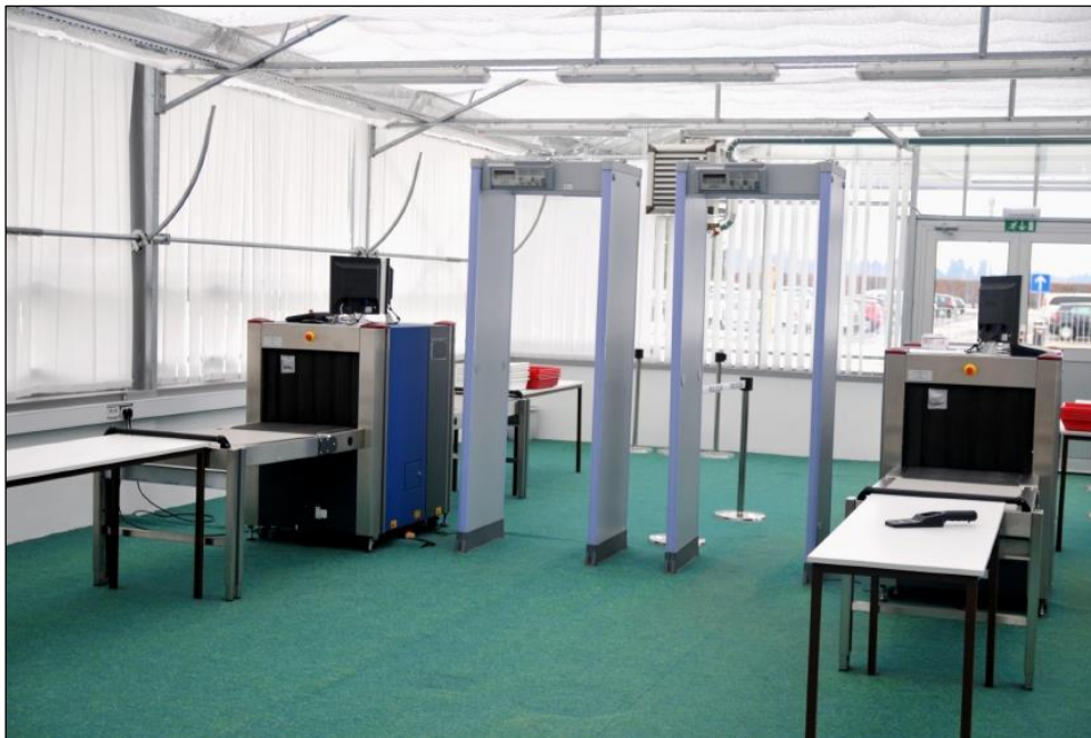
Slika 8: Metal detektorska vrata (URL 8)

Metal detektorska vrata su namjenjena detekciji i spriječavanju unošenja oružja u objekte gdje postoji potreba za takvom vrstom zaštite. Moraju imati mogućnost otkrivanja i uzbunjivanja alarmom u slučaju otkrivanja metalnih predmeta, pojedinačno i u kombinaciji. Otkrivanje metala opremom metal detektorskih vrata mora biti neovisno o položaju i smjeru metalnog predmeta. Metal detektorska vrata moraju biti čvrsto pričvršćena za tvrdi podlogu. Također moraju imati i vizualni indikator koji pokazuje da oprema radi. Sredstva za podešavanje postavki otkrivanja metal detektorskih vrata moraju biti zaštićena i dostupna samo ovlaštenim osobama. Moraju pokazivati vizualni i oglašavati zvučni alarm, te kada otkriju metalne predmete obje vrste alarma moraju biti zamjetljive s udaljenosti od 2m. Za ispravan i pouzdan rad, metal detektorska vrata bi trebala biti slobodna u prostoru i da oko njih u krugu od 0.5 m nema pokretnih metalnih dijelova.