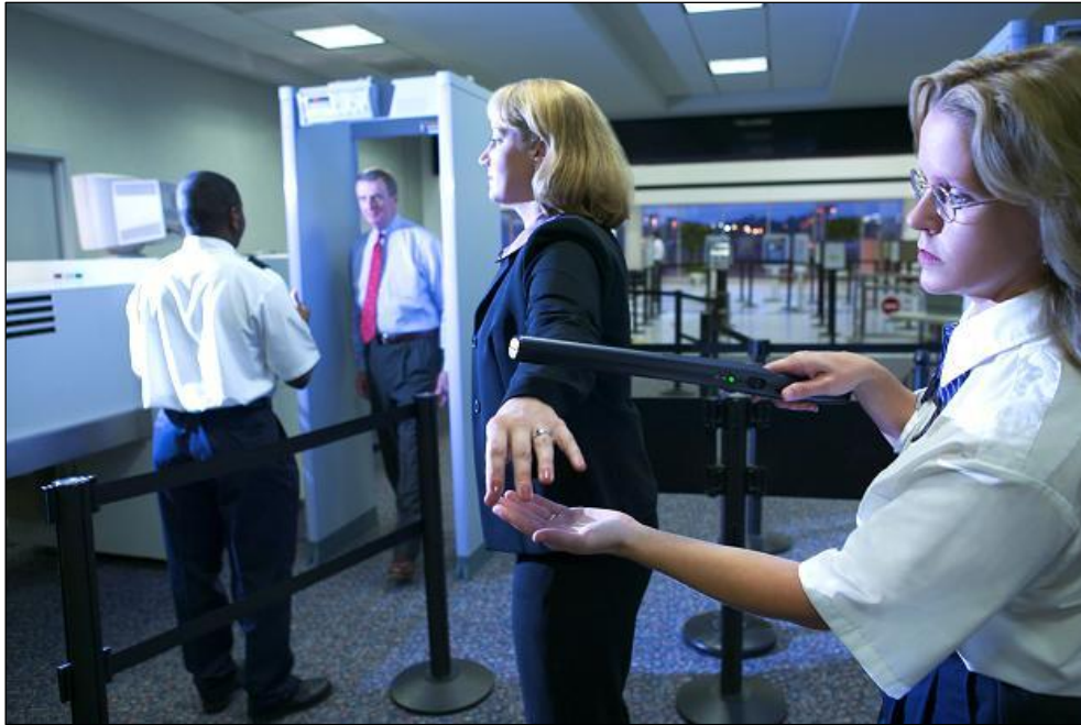
Slika 5: Zaštitni pregled putnika (URL 5)

Oprema za otkrivanje tragova eksploziva (ETD) u kombinaciji s ručnim detektorom (HHMD) može se koristiti samo u slučajevima kada osoba koja obavlja zaštitni pregled smatra da je ručna pretraga određenog dijela tijela osobe neučinkovita ili nepoželjna. Zaštitni pregled putnika je dubinsko ispitivanje usklađenosti svih aspekata implementacije Nacionalnog programa za zaštitu civilnog zrakoplovstva (Rukavina, 2015).