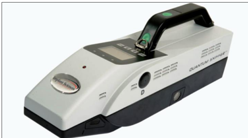
Slika 10: Ručni detektor za otkrivanje tragova eksploziva (URL 10)

Oprema za otkrivanje tekućih eksploziva mora biti u stanju otkriti i alarmom uzbuniti na navedene i veće pojedinačne količine eksplozivnog materijala sadržanog u LAG-ovima. Oprema se oglašava alarmom kada otkrije opasan materijal, kada otkrije predmet koji sprječava otkrivanje opasnog materijala, kada ne može ocijeniti dali je LAG opasan ili ne, i kada je sadržaj pregledavane prtljage previše gust da bi se mogao analizirati.