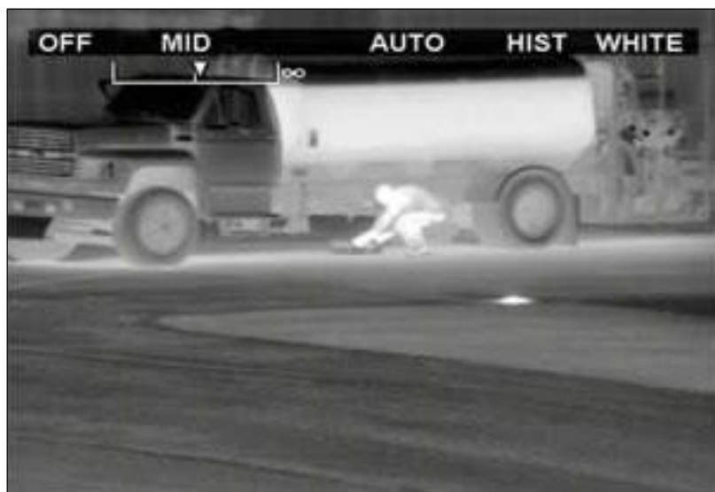
Slika 3: Prikaz slike snimljene termalnom kamerom (URL 3)

Video nadzor, primjerena i prikladna rasvjeta uvelike upotpunjuju funkciju ograde. Video nadzor se prati konstantno 24 sata. Kako bi funkcionirao u svim uvjetima, razvili su se brojni sustavi video nadzora. Tako danas imamo veoma sofisticirane video sustave koji funkcioniraju u potpunom mraku pomoću termalnih kamera kao i sustave koji reagiraju na pokret. Nadzorni sustav CCTV ( eng. Closed- circuit television ) ima visoku razlučivost te brojne mogućnosti ( zumiranje objekta, 3D pomicanje same kamere ). Sve to zajedno čini zadovoljavajući nadzorni sustav.