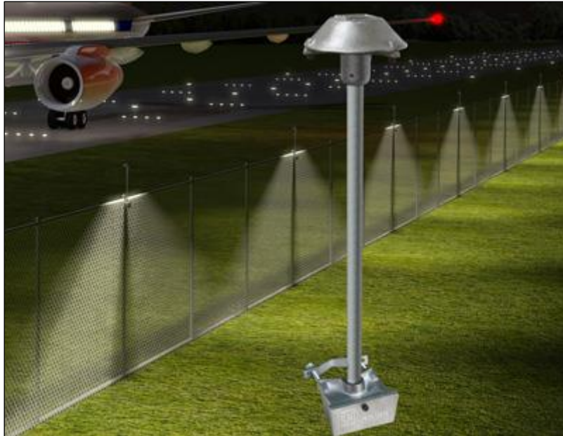
Slika 2: Primjena CAST rasvjete i LED svjetala radi jednostavnijeg nadzora i zaštite zračne luke (URL 2)

Video nadzor, primjerena i prikladna rasvjeta uvelike upotpunjuju funkciju ograde. Video nadzor se prati konstantno 24 sata. Kako bi funkcionirao u svim uvjetima, razvili su se brojni sustavi video nadzora. Tako danas imamo veoma sofisticirane video sustave koji funkcioniraju u potpunom mraku pomoću termalnih kamera kao i sustave koji reagiraju na pokret. Nadzorni sustav CCTV ( eng. Closed- circuit television ) ima visoku razlučivost te brojne mogućnosti ( zumiranje objekta, 3D pomicanje same kamere ). Sve to zajedno čini zadovoljavajući nadzorni sustav.