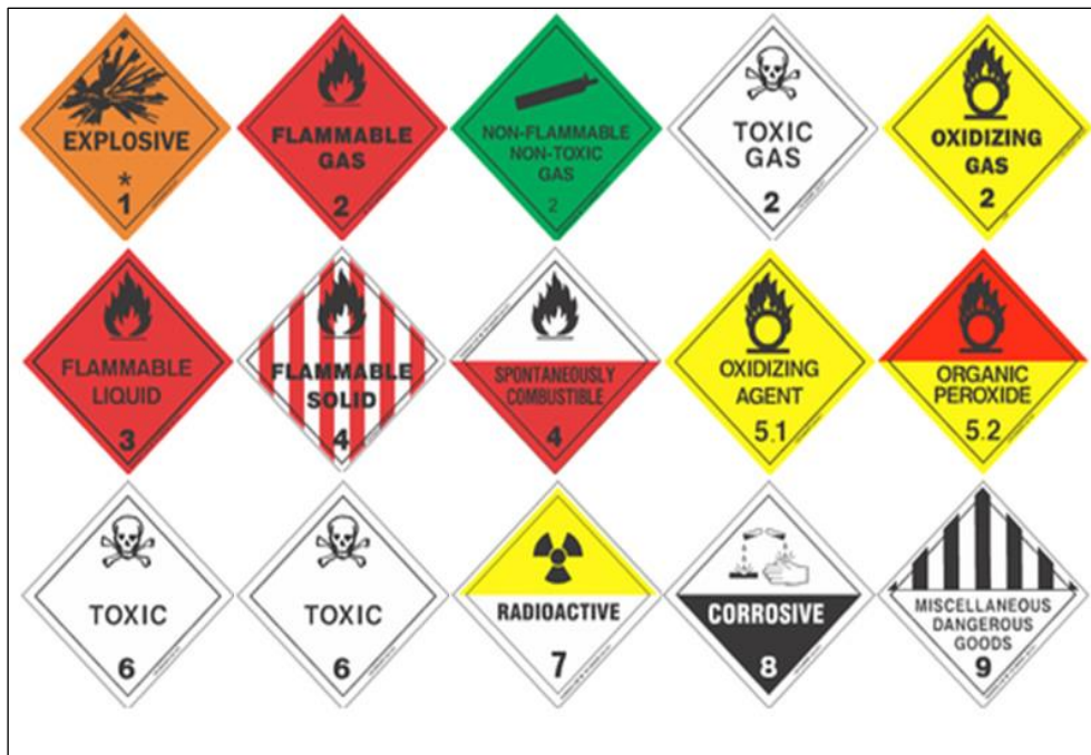
Slika 14: Oznaka klasa opasne robe (URL 14)