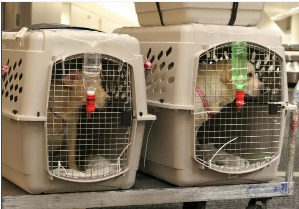
Slika 13: Spremnik za prijevoz životinja (URL 13)