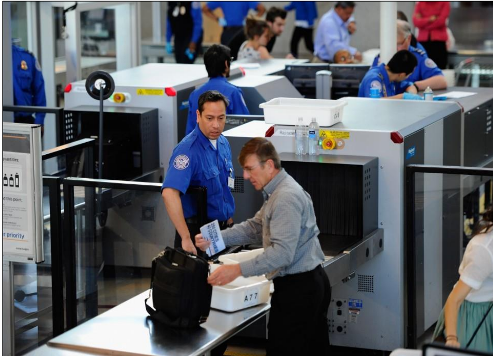
Slika 12: Zaštitni pregled predane prtljage (URL 12)