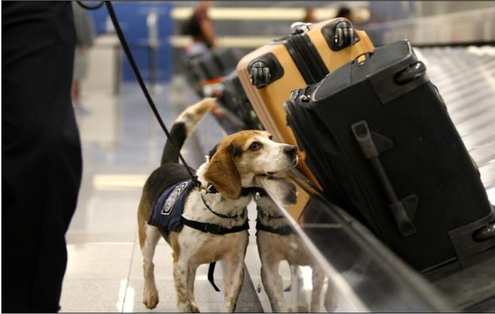
Slika 11: Pas za otkrivanje tragova eksploziva (URL 11)

usmjerenju eksplozivne tvari. Pas za otkrivanje tragova eksploziva i njegov vodič mogu se koristiti za pregled ako su obojica neovisno odobreni i odobreni zajedno kao tim.