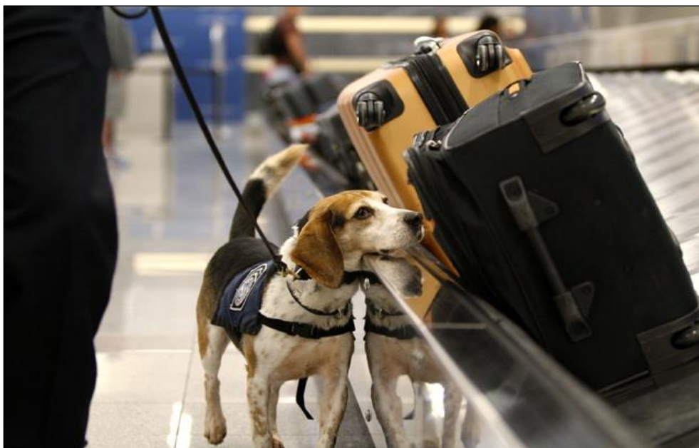
Slika 11: Pas za otkrivanje tragova eksploziva (URL 11)

usmjerenju eksplozivne tvari. Pas za otkrivanje tragova eksploziva i njegov vodič mogu se koristiti za pregled ako su obojica neovisno odobreni i odobreni zajedno kao tim.