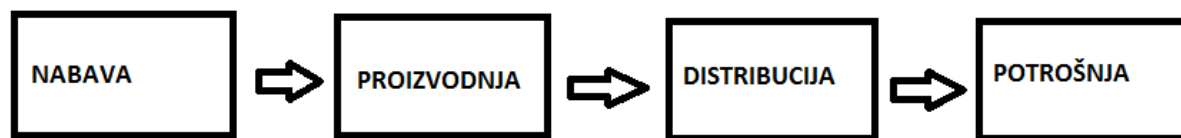
Slika 1: Faze opskrbnog lanca