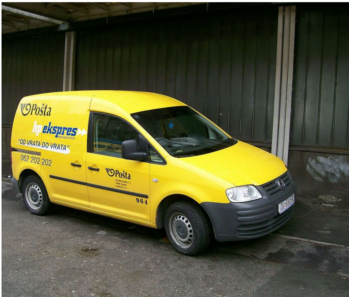
Slika 13. Volkswagen, model Caddy