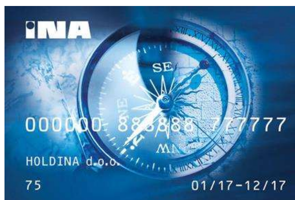
Slika 7. A-INA kartica

A-INA kartica omogućuje njezinom korisniku da nakon uplate sredstava koristi A-INA karticu(e) do visine uplaćenog iznosa na prodajnim mjestima INE i time ostvaruju pravo na R-1 račun, te može planirati svoje poslovanje bez brige o gotovini.