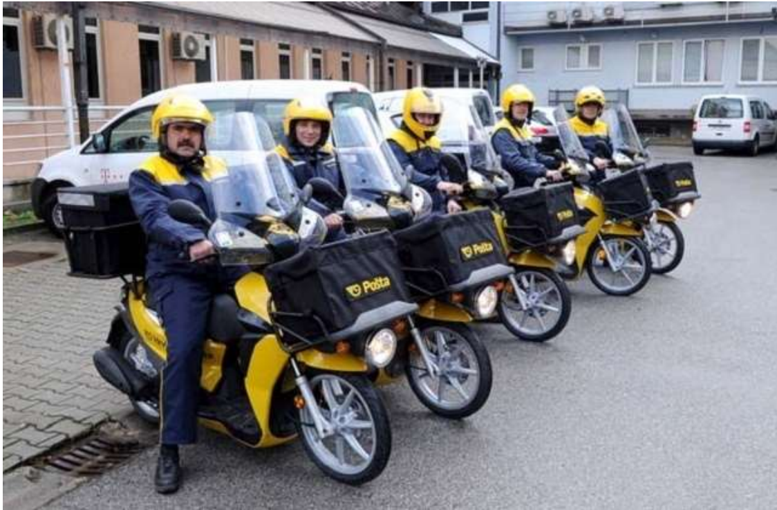
Slika 11. Mopedi GenericOnyx