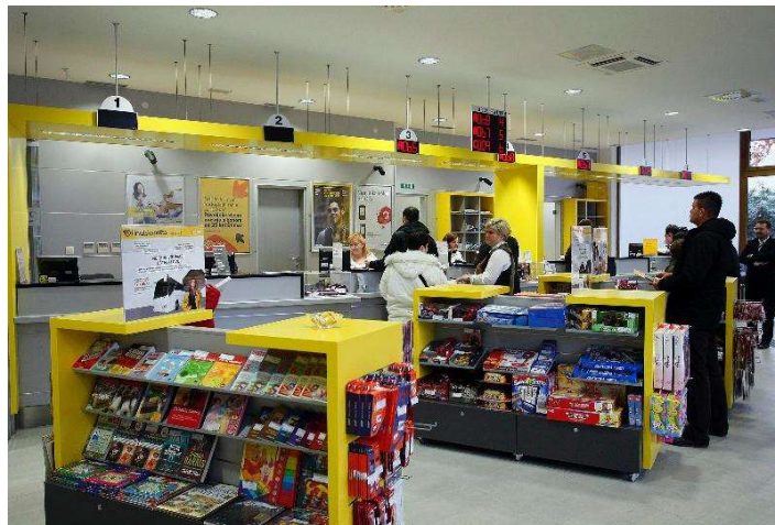
Slika 2. Ured Hrvatske pošte

Hrvatska pošta izdaje marke različitih motiva čime daje doprinos hrvatskoj kulturi i društvenom životu. U svojim poštanskim uredima (slika 2.) prodaje knjige, priručnike, igračke i ostale, mobilne uređaje i ostalo.