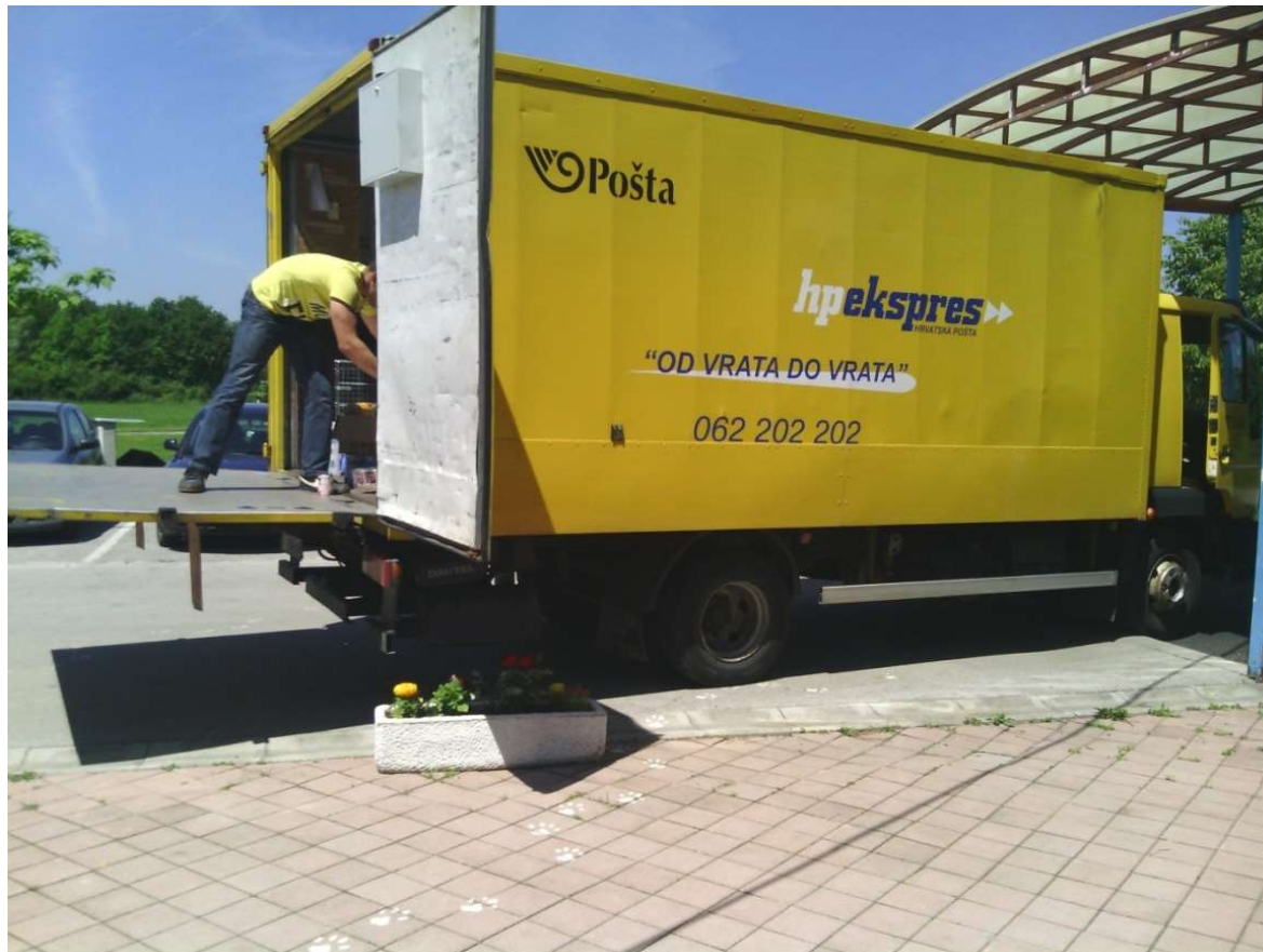
Slika 19. Kamion MAN; Utovarna rampa

Na slici 18. prikazan je kamion MAN s otvorenom utovarnom rampom preko koje se vrši ukrcaj tereta.