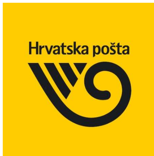
Slika 1. Simbol Hrvatske pošte

S obzirom da je od samih početaka vodila računa o svojim korisnicima, Hrvatska pošta i danas ima veliki ugled. Na slici 1. prikazan je simbol Hrvatske pošte, rog na žutoj podlozi.