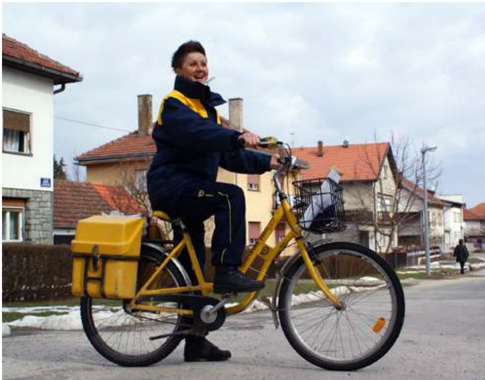
Slika 8. Bicikl na manuelni pogon

Unatoč tome bicikli na električni pogon pogodni su za izbjegavanje velikih gradskih gužvi a i ekološki su prihvatljivi. Zbog ekoloških normi 50% ukupnih troškova sufinanciran je od strane Fonda za zaštitu okoliša i energetske učinkovitost.