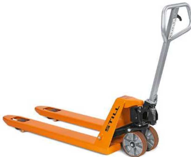
Slika 15. Ručni paletar-viličar

Plinski viličari korise se u zatvorenim prostorima Hrvatske pošte za utovar i istovar tereta posloženog na palete. Uporabom viličara ubrzava se manipulacijski proces te je smanjena potreba za ručnom radnom snagom. Plinski viličar pogodan je zbog ekoloških razloga-zaštite okoliša i zbog natkrivenog prostora u kojem se koristi. Električni samohodni viličari mogu biti niskopodizni i visokopodizni , a koriste se za podizanje paletiziranog tereta, utovar, istovar tereta u skladištima i u vozila čime je ubrzan sami proces manipulacije teretom. Ruči paletari (slika 15.) nemaju vlastiti pogon. Primjenjuju se u skladištima ali i na kamionima kako bi se olakšalo rukovanje paletiziranim teretom.