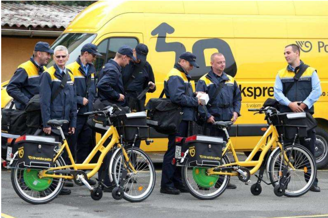
Slika 9. Bicikli na električni pogon