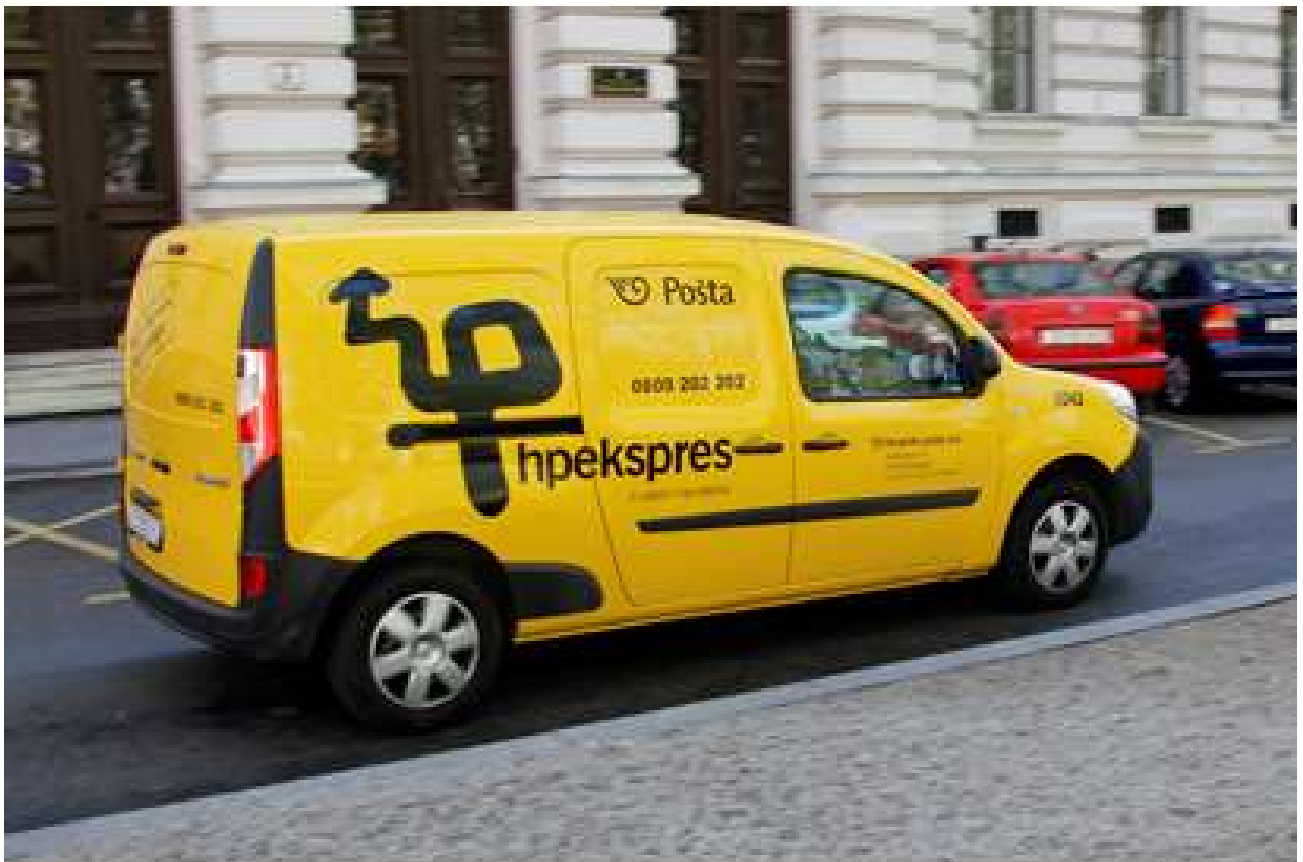
Slika 17. Renault Kangoo