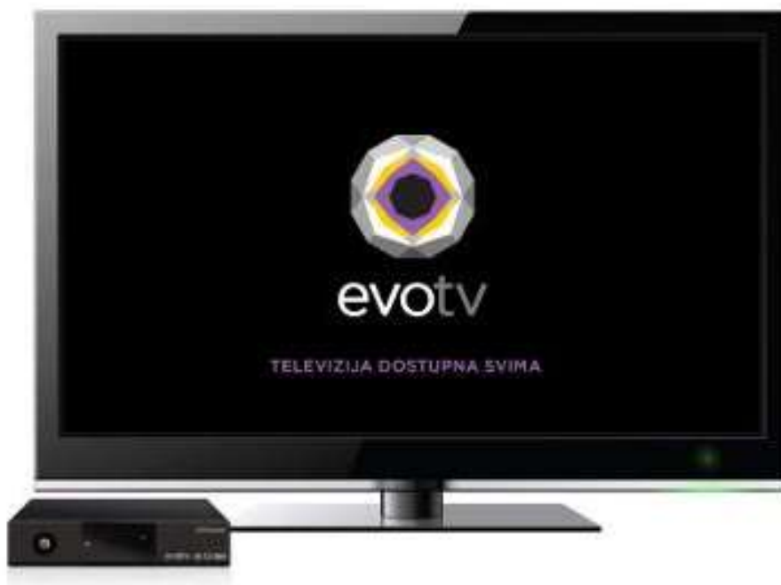
Slika 4. EVO TV

Hrvatska pošta pruža i uslugu digitalne televizije (slika 4.) za koju je potreban samo digitalni prijamnik koji je prenosiv.