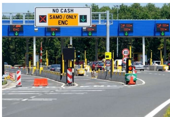
Slika 6. Elektronska naplata cestarine