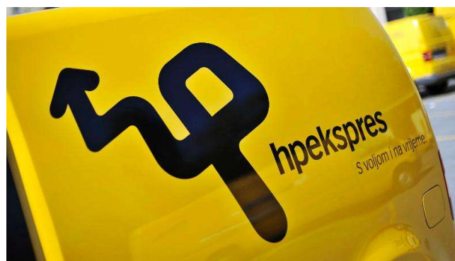
Slika 3. Logotip Hpekspres-a

Hpekspres je usluga brze dostave pošiljaka unutar Republike Hrvatske. Logotip Hp ekspresa prikazan je na slici 3.