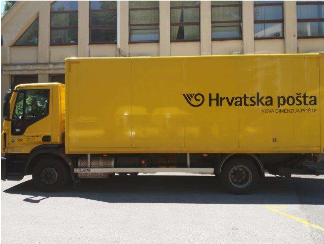
Slika 14. Teretno vozilo-IVECO, model Eurocargo

Kamioni su najopterećenija skupina vozila. Rade najveće kilometraže, prosječno 100 000 kilometara godišnje, a koriste se isključivo za međugradske vožnje.