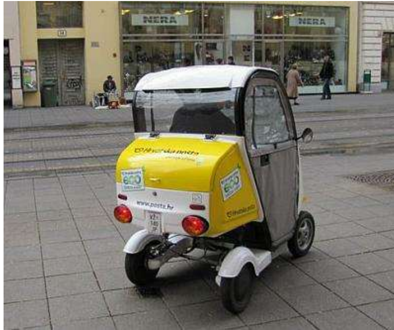
Slika 10. Vozilo s četiri kotača i elektromotorom