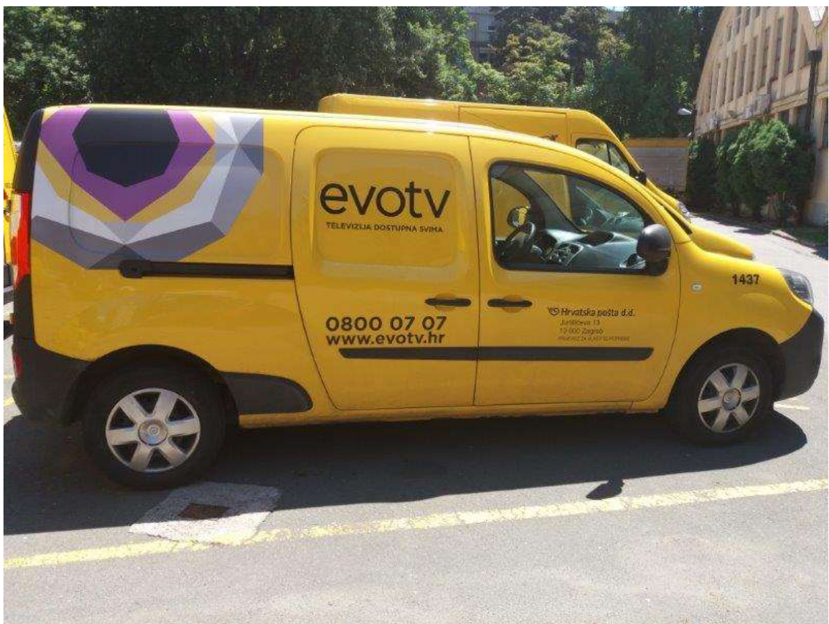
Slika 12. Renault, model Kangoo

Lako dostavna vozila su zatvorenog tipa karoserije s dva sjedala za vozača i suvozača. Ova vrsta vozila pripada kategoriji vozila čija najveća dopuštena masa nije veća od 800 kilograma.