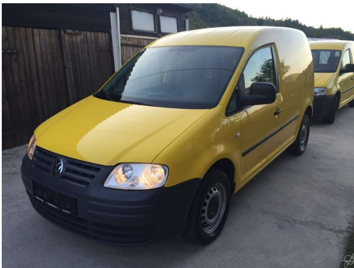
Slika 16. Volkswagen Caddy

Ukoliko su vozila u jamstvenom roku servis se obavlja kod ovlaštenih serviser. Ugovori se sklapaju sa svakom grupacijom posebno za njihovu grupu, te se na temelju njih nabavljaju dijelovi i servisiraju vozila. Servis u jamstvenom roku, kao i nakon njega vrši se nakon određenog broja prijeđenih kilometara propisanih od samog proizvođača vozila.