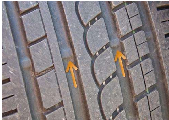
Slika 18. Indikatori istrošenosti pneumatika

Svi pneumatici za osobne automobile, srednja dostavna vozila, lagane kamione i teretna vozila imaju indikatore istrošenosti gazne površine.