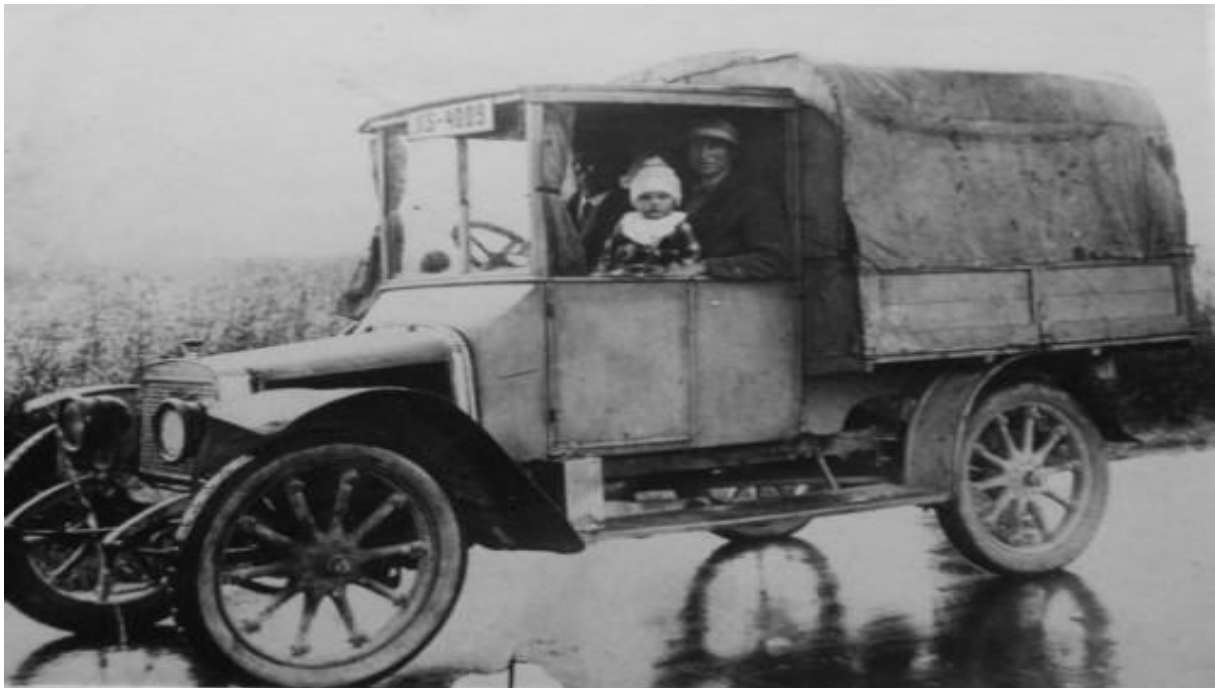
Slika 1. Prijevozno sredstvo iz 1929.godine 6

Primjer cestovnog prijevoznog sredstva na početku 20. stoljeća prikazan je slikom 1.