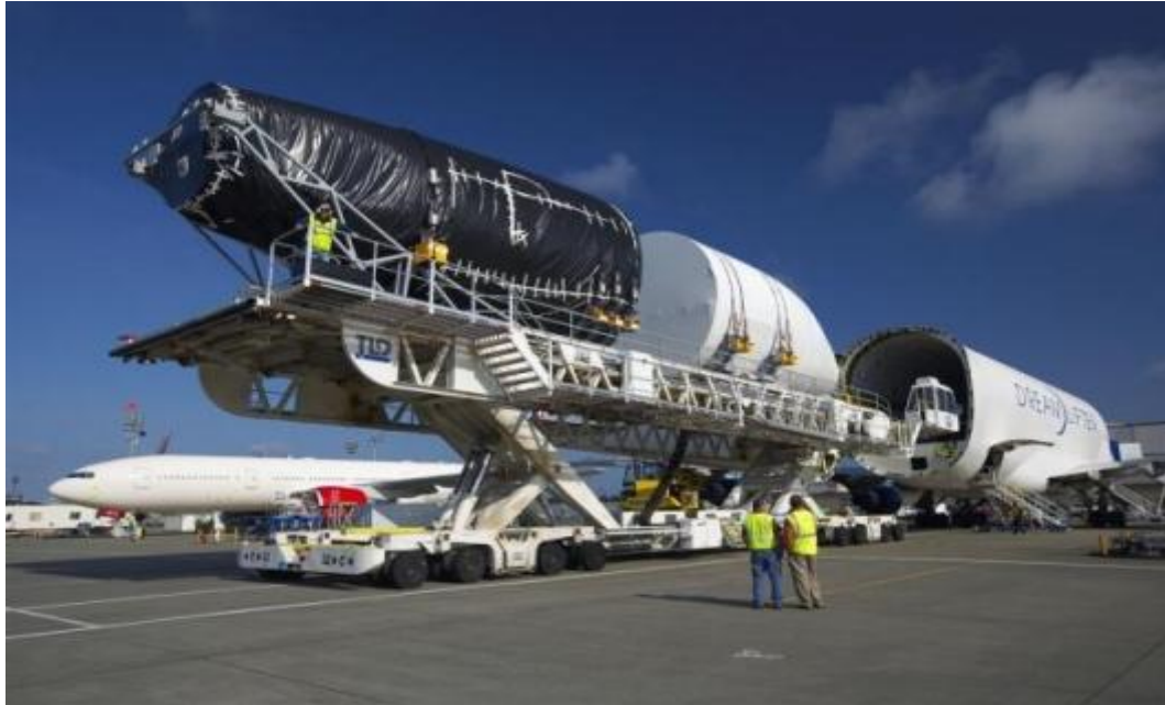
Slika 3. Teretni zrakoplov 18

Međunarodno udruženje zrakoplovnog prijevoza IATA (eng. International Air Transport Association) osnovano je 1919. godine u Montrealu. To je nevladina organizacija, a članovi organizacije su zrakoplovne kompanije tj. zračni prijevoznici. Glavna zadaća organizacije je donošenje tarifa, odnosno cijena prijevoza koje su obvezne za sve zračne prijevoznike.