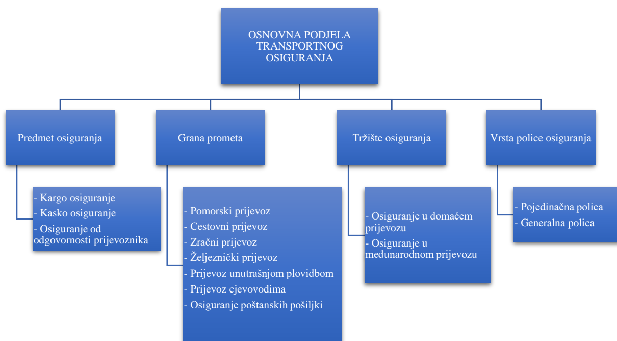
Slika 1. Podjela transportnog osiguranja

Transportno se osiguranje razvrstava s obzirom na sljedeće kriterije (Slika 1):