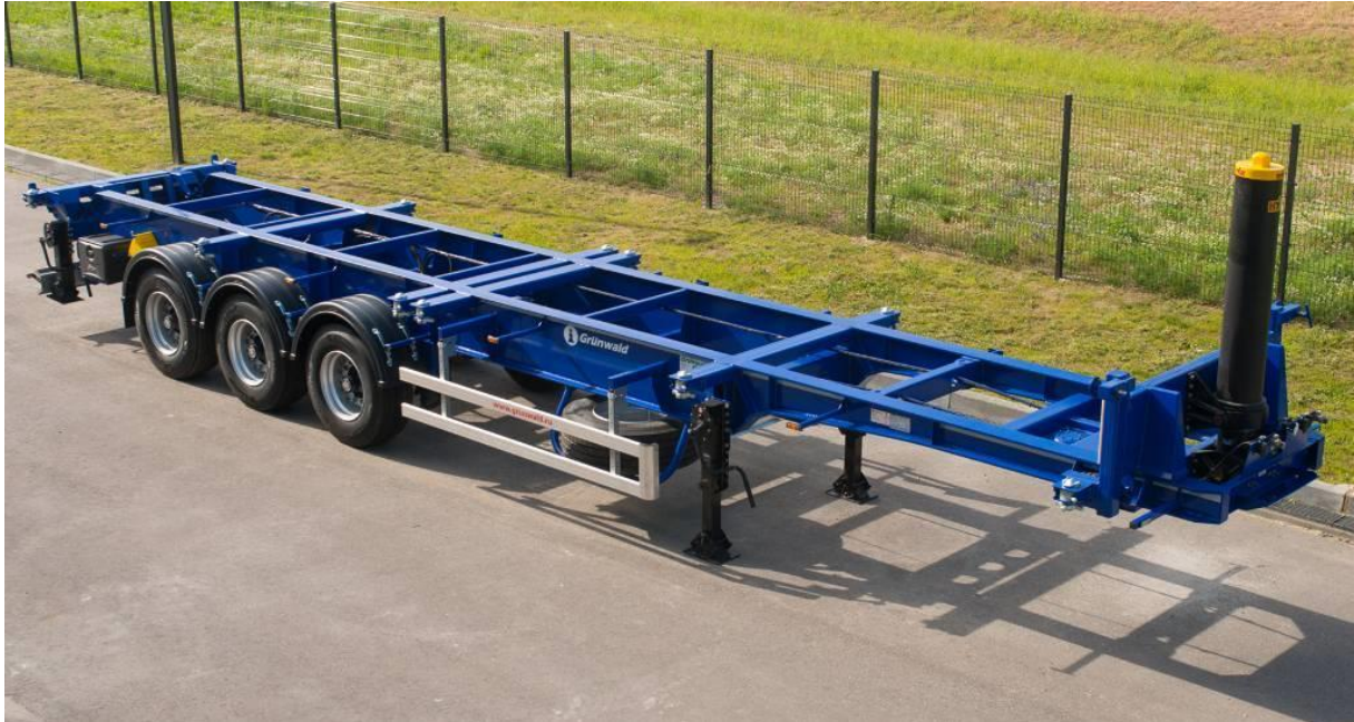
Slika 3. Primjer kontejnerske poluprikolice