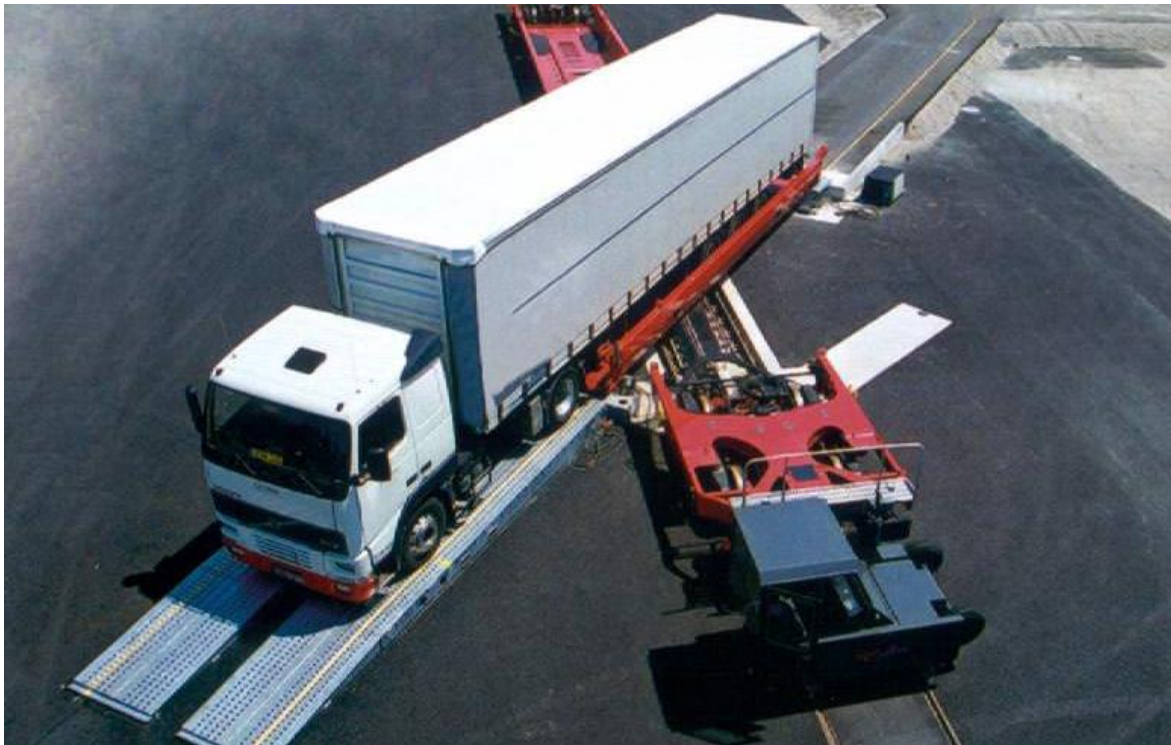
Slika 4. Primjer Modalohr sustava