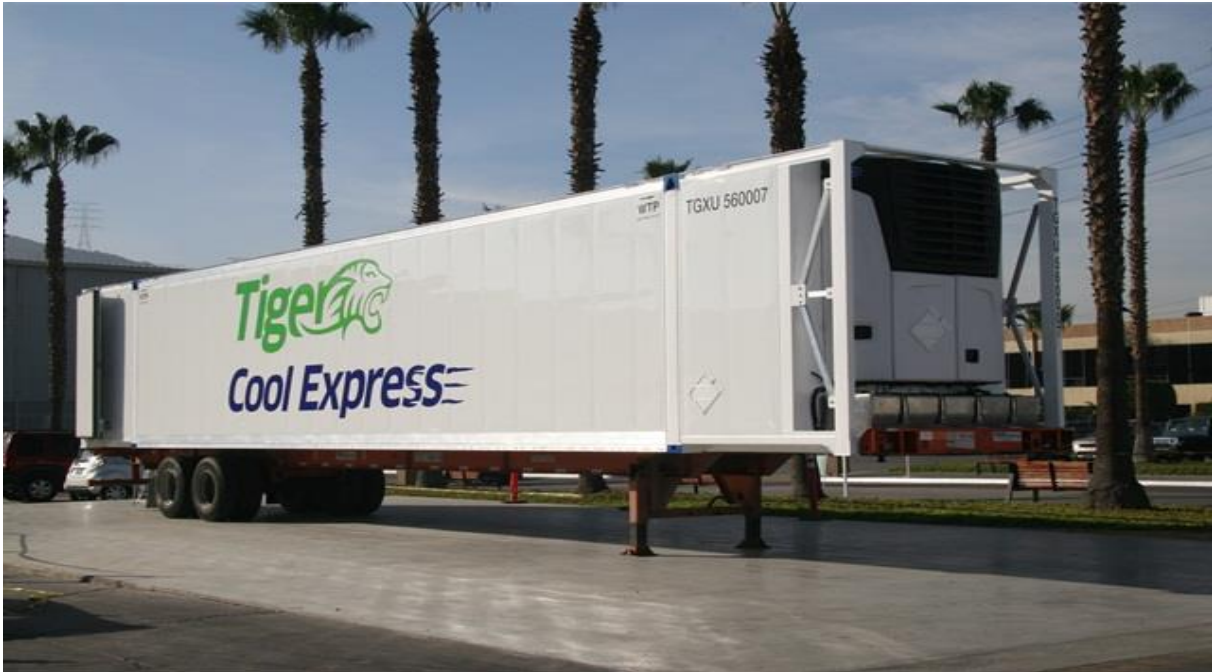
Slika 2. Primjer Tiger Rail-Trailer Train iz Velike Britanije

Druga bimodalna tehnologija je razvijena u Velikoj Britaniji kao Tiger Rail Trailer Train. U toj varijanti cestovno – željezničke poluprikolice imaju pojačanja na donjim čeličnim stranama s odgovarajućim mehanizmima za pričvršćenje na posebna dvoosovinska željeznička podvozja neovisna o poluprikolicama u vožnji cestovnim prometnicama.