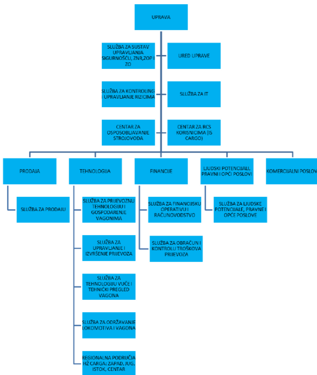
Slika 3. Organizacijska struktura HŽ Carga d.o.o.