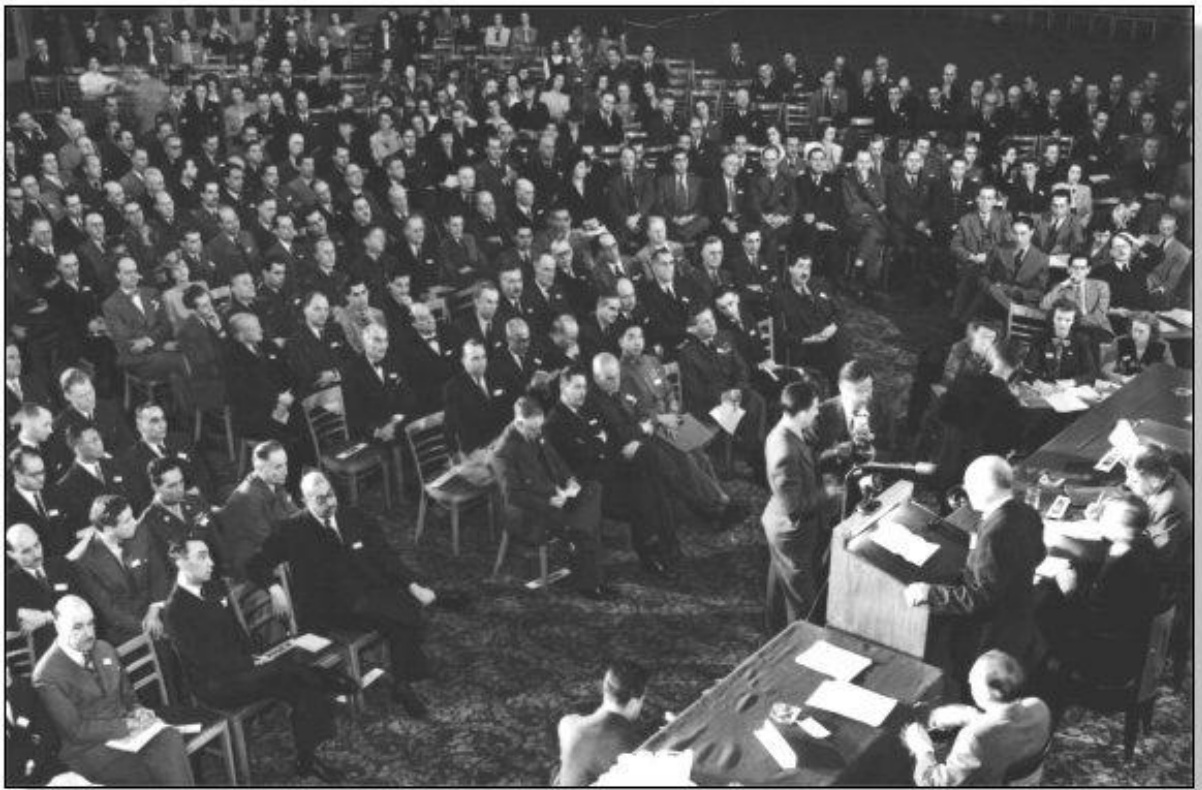
Slika 1. Čikaška konferencija trajala je od 1. studenog do 7. prosinca 1944. godine i na njoj je prisustvovalo 700 delegata iz 52 države [6]

ratifikacija i došla je na snagu u travnju 1947. godine. Konvencija i njezina dva dodatka značila su da države potpisnice uvažavaju međusobna prava preleta preko nacionalnih zračnih prostora i prava slijetanja na određena područja svojih suverenih područja. [4] Prvi članak Čikaške konvencije znači isto što i prvi članak Pariške konvencije: „Države ugovornice priznaju da svaka država ima potpuni i isključivi suverenitet nad zračnim prostorom iznad svojeg teritorija.“. Čikaška konvencija, međutim, definira i teritorij kao: „Teritorijem države u smislu ove konvencije se smatraju kopnena područja i teritorijalne vode uz ta područja pod suverenitetom, vrhovnom vlašću, zaštitom ili mandatom te države.“. [5]