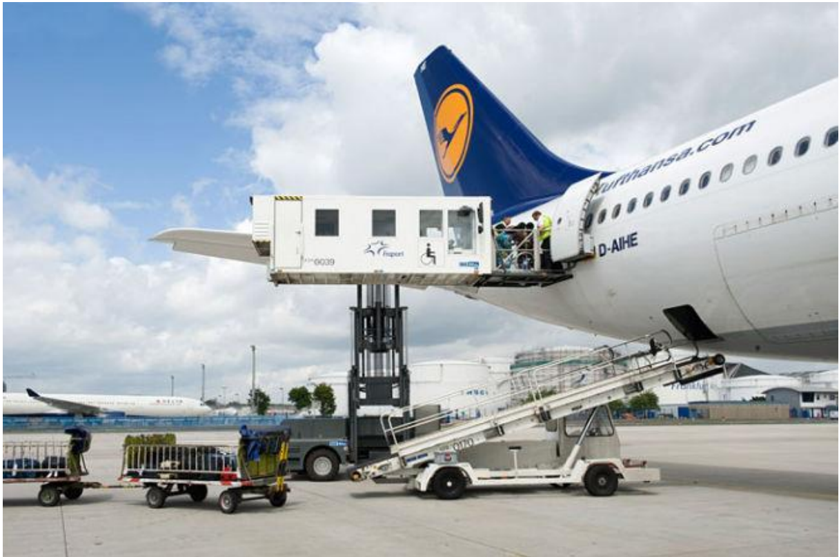
Slika 6. Postupak ukrcaja stretcher putnika ambulift vozilom