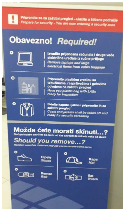
Slika 8. Plakat upozorenja prije body check uređaja