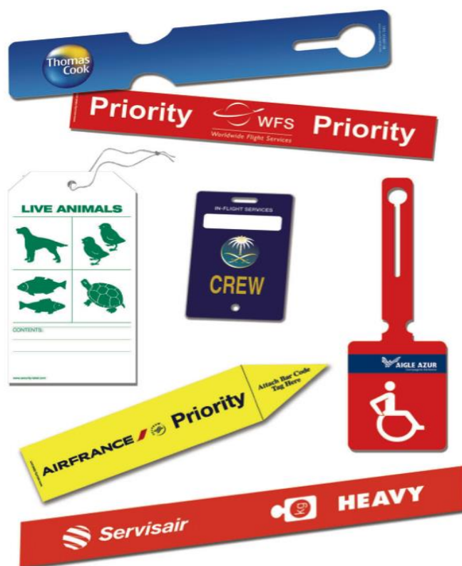
Slika 7. Prikaz različitih prtljažnih privjesaka (engl. baggage tags )

Prtljaga na sebi može imati dodatne privjeske, kao što je heavy tag za prtljagu težu od 23 kilograma, s obzirom na to da je prema pravilniku maksimalna težina prtljage 23 kilograma. Međutim, svaka kompanija posebno određuje težinu za heavy tag . Dodatni privjesak na prtljazi jest i priority tag koji se stavlja na prtljagu putnika koji putuju poslovnom klasom. Nadalje, dodatni privjesak fragile tag na prtljazi upozorava na lomljivost sadržaja u prtljazi, dok dodatni privjesak crew tag označava prtljagu koja pripada članu posade. Na slici 7. prikazani su različiti baggage tagovi .