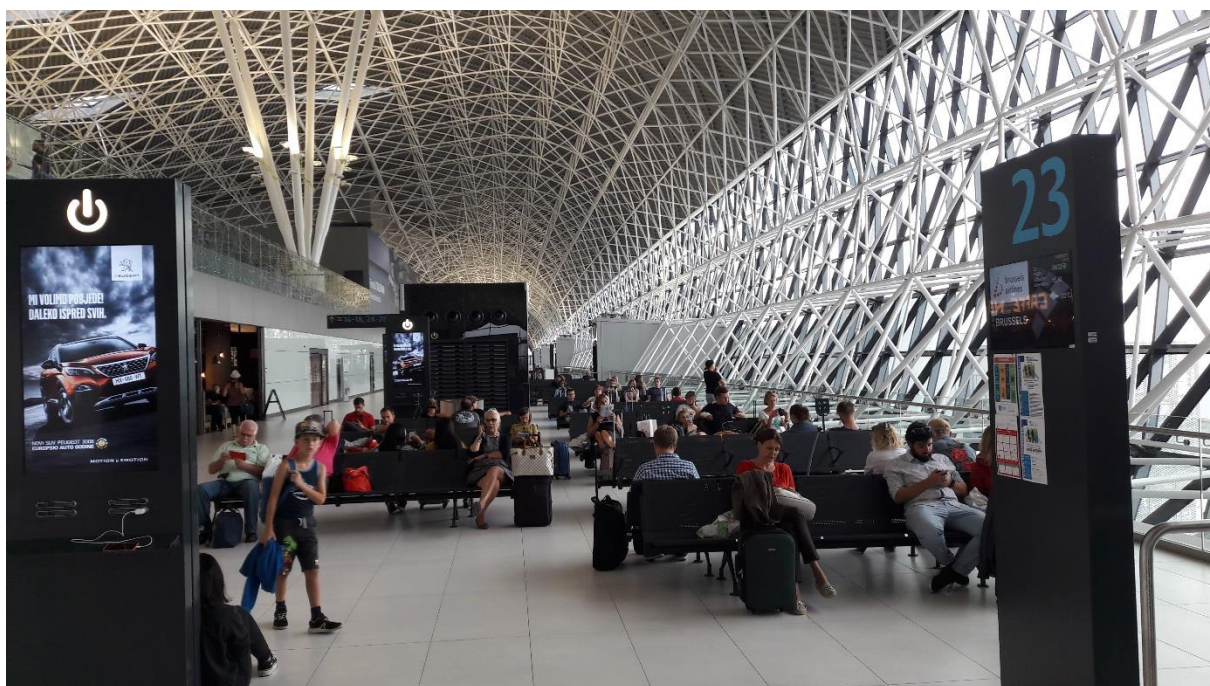
Slika 9. Izgled čekaonice međunarodnih odlazaka na MZLZ

Međunarodni putnici se nakon prolaska kontrole putovnica stubištem spuštaju na drugi kat, gdje se nalazi zona međunarodnoga odlaska (koja je prikazana na slici 9.). Za međunarodni dolazak osigurano je šest aviomostova te isto toliko gateova koji su numerički označeni s desna na lijevo brojevima od 21 do 27. Čekaonica za ulazak u zrakoplove koji su parkirani na jednoj od tri pozicije na stajanki ispred novog terminala ili stajanki ispred starog terminala nalazi se na nultoj razini terminala, a gateovi su označeni brojevima od 16 do 18.