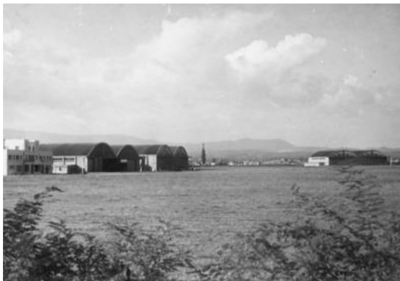
Slika 1. Upravna zgrada i hangari aerodroma Borongaj