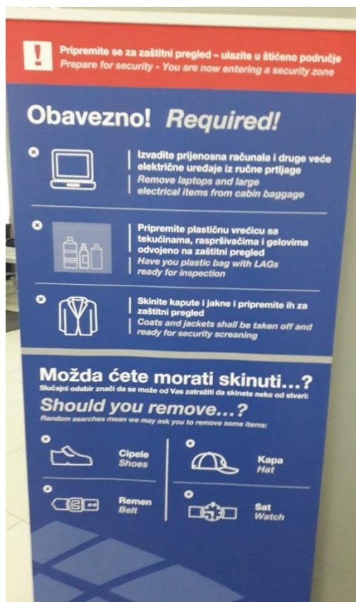
Slika 8. Plakat upozorenja prije body check uređaja