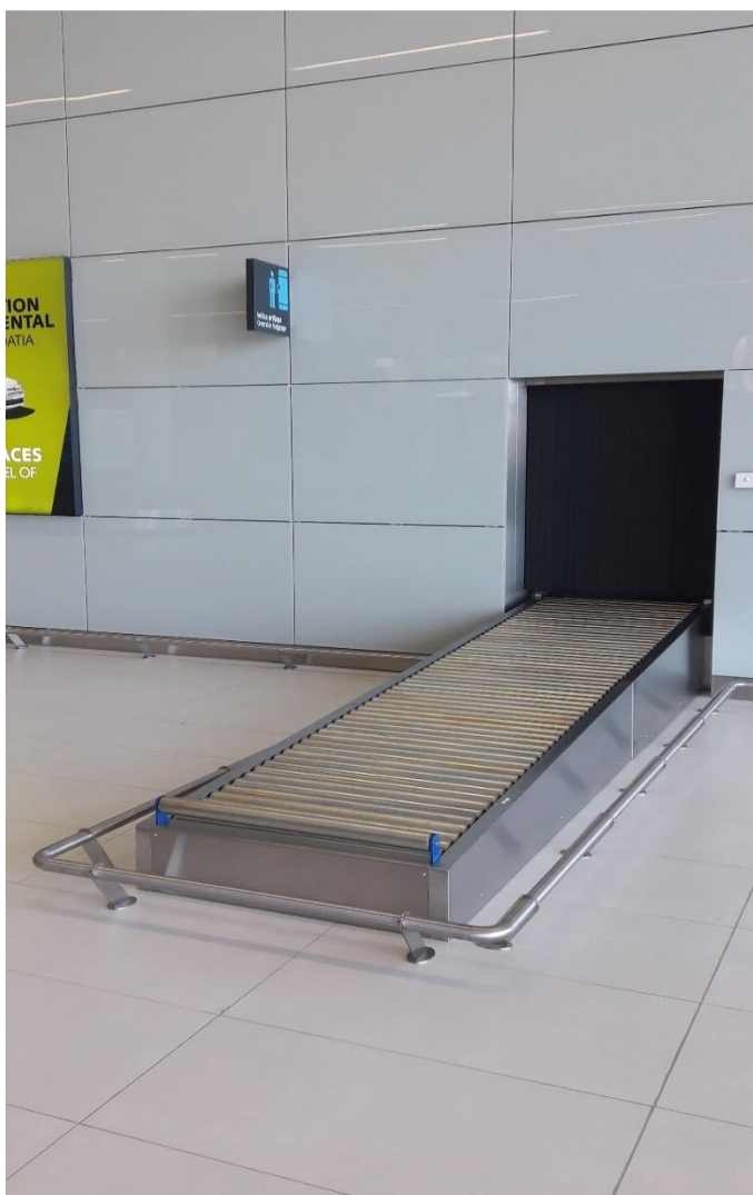
Slika 11. Mjesto izlaska oversize prtljage

Sva prtljaga se uz pomoć sustava traka šalje u zonu podizanja prtljage. U sortirnici ostaje samo transferna prtljaga ako vrijeme između dva leta duže od 45 minuta. Ta se prtljaga stavlja na transfernu traku, gdje prolazi kroz rendgen te se razvrstava po destinacijama. Transferna prtljaga na letovima gdje je razdoblje između slijetanja dolaznog leta i polijetanja odlaznog vezanog leta kraće od 45 minuta ne ulazi u sortirnicu, već se prenosi s parkirne pozicije istovarenog (dolaznog) zrakoplova do parkirne pozicije odlaznog zrakoplova kako ne bi ostala u Međunarodnoj zračnoj luci Zagreb. Oversize prtljaga šalje se posebnom trakom u zonu podizanja prtljage. Na slici 11. prikazano je mjesto izlaska oversize prtljage.