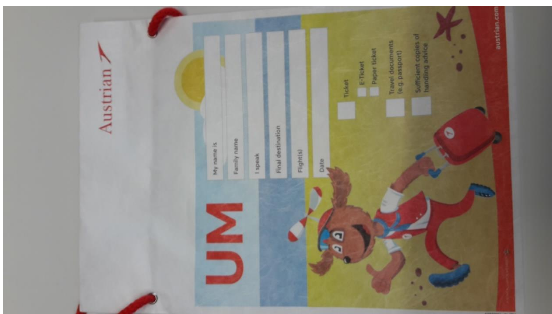
Slika 5. UM torbica aviokompanije Austrian Airlines

Roditelj UM putnika prilikom kupnje karte popunjava UM popratnicu koja se predaje pri registraciji. U njoj roditelj ili staratelj navodi podatke o osobi koja će dočekati dijete na konačnoj destinaciji te jezične sposobnosti UM putnika. Jedan primjerak UM popratnice zadržavaju roditelji, drugi primjerak UM putnik treba imati kod sebe u UM torbici, dok je treći primjerak potreban za arhivu. UM torbicu (prikazana na slici 5.) putnik treba držati oko vrata tijekom putovanja.