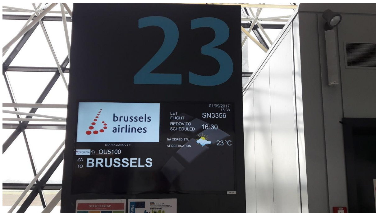
Slika 10. Izgled monitora ispred izlaza

Međunarodna zračna luka Zagreb za ukrcaj i iskrcaj putnika te prtljage koristi terminal Dr. Franjo Tuđman i stajanku starog terminala Pleso zbog nedostatka parkirnih pozicija na novom terminalu prilikom jutarnjih i popodnevnihih špica. Ispred svakog izlaza ( gatea ) nalazi se monitor koji prikazuje broj leta, vrijeme leta, odredište te vremensku prognozu za odredište. Jedan od takvih monitora prikazan je na slici 10.