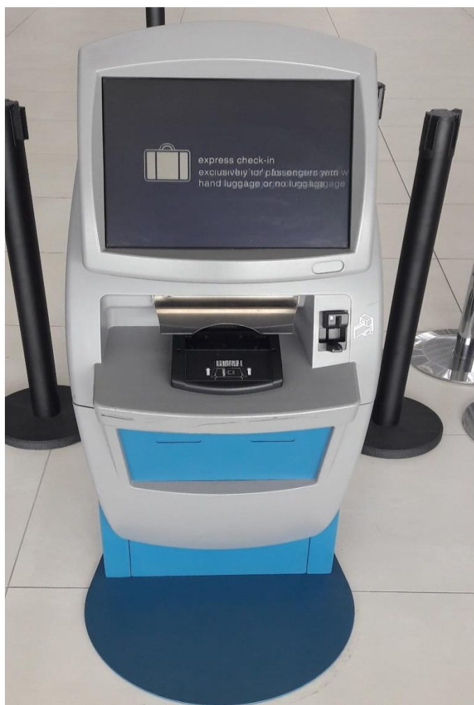
Slika 3. Self check in uređaj u MZLZ

Na self check in uređajima prikazanima na slici 3. putnik se može prijaviti za letove određenih zrakoplovnih prijevoznika, a to su Croatia Airlines, Air France i KLM. Poželjno je da putnici sa sobom imaju samo osobnu prtljagu. U suprotnome nakon prijave na self check in automatu za registraciju prtljagu za prtljažni prostor trebaju predati na jednom od drop-off šaltera.