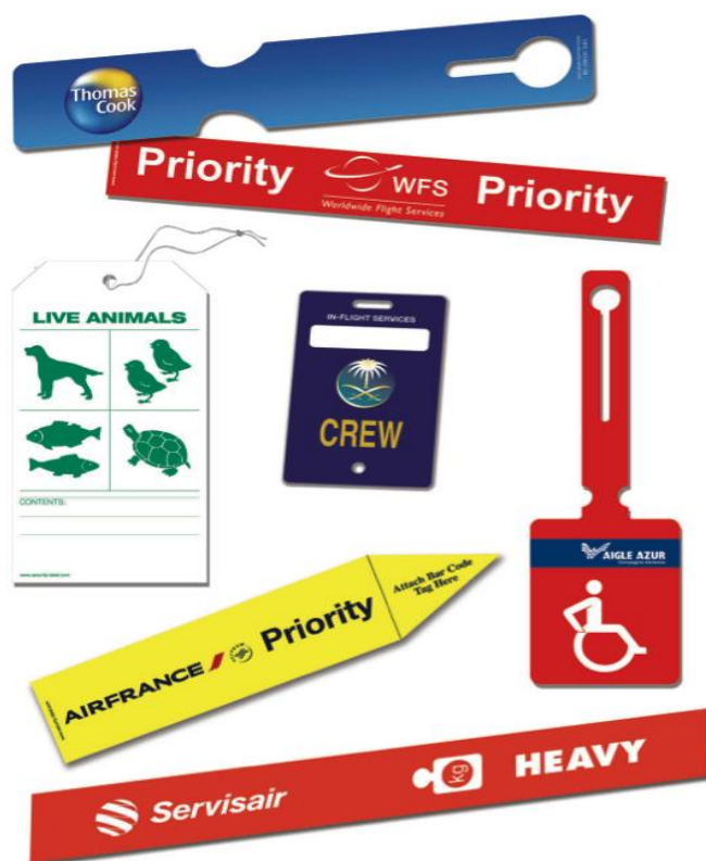
Slika 7. Prikaz različitih prtljažnih privjesaka (engl. baggage tags )

Prtljaga na sebi može imati dodatne privjeske, kao što je heavy tag za prtljagu težu od 23 kilograma, s obzirom na to da je prema pravilniku maksimalna težina prtljage 23 kilograma. Međutim, svaka kompanija posebno određuje težinu za heavy tag . Dodatni privjesak na prtljazi jest i priority tag koji se stavlja na prtljagu putnika koji putuju poslovnom klasom. Nadalje, dodatni privjesak fragile tag na prtljazi upozorava na lomljivost sadržaja u prtljazi, dok dodatni privjesak crew tag označava prtljagu koja pripada članu posade. Na slici 7. prikazani su različiti baggage tagovi .