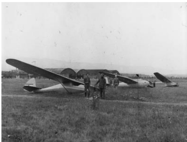
Slika 2. Uzletište aerodroma Borongaj