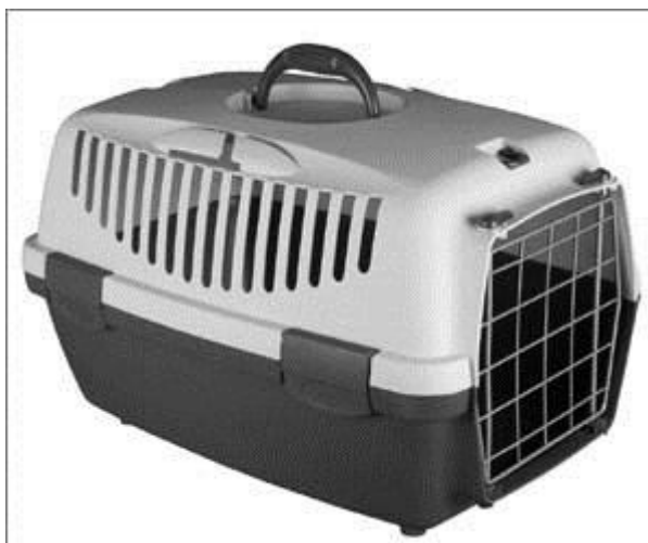
Slika 1. Kontejner za prijevoz psa i mačke