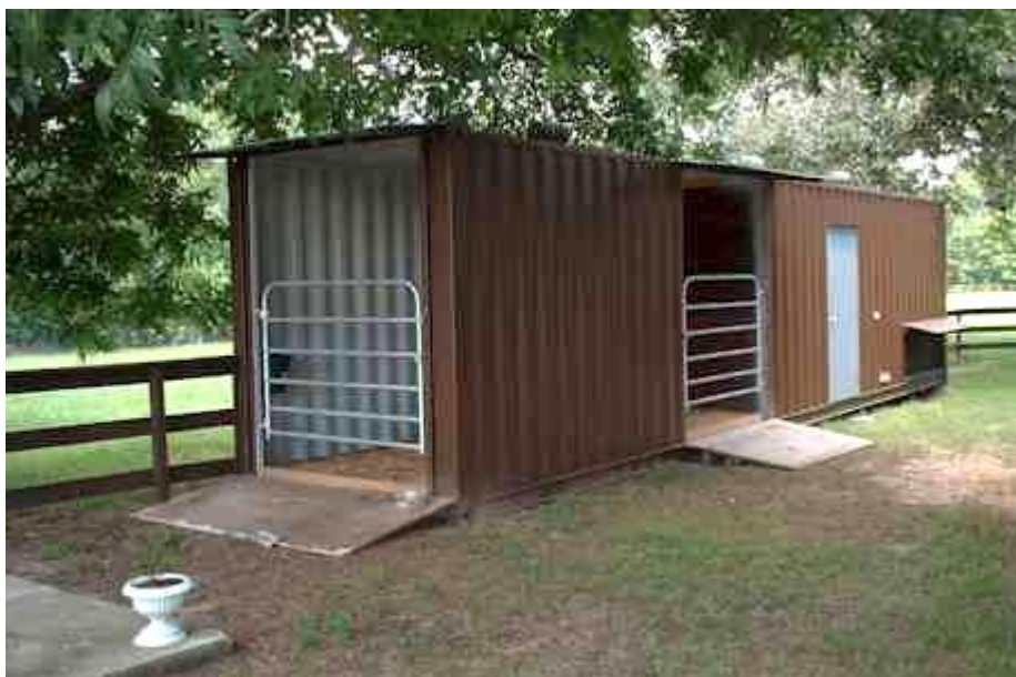
Slika 2. Kontejner za prijevoz domaćih životinja