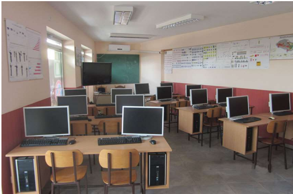
Slika 5: Učionica za nastavni predmet Prometni propisi i sigurnosna pravila

posljedica nedostatka prometne kulture u programu nastavnog predmeta „Prometni propisi i sigurnosna pravila“. U programu osposobljavanja vozača potrebno je upoznati buduće vozače sa posljedicama prometnih nesreća prikazivanjem fotografija i video snimki prometnih nezgoda kao te ponajviše isposvjesti i fotografije žrtava prometnih nezgoda kako bi mladi vozači stekli svijest o posljedicama nepoštivanja prometnih propisa što je osnovni preduvjet stjecanja prometne kulture.