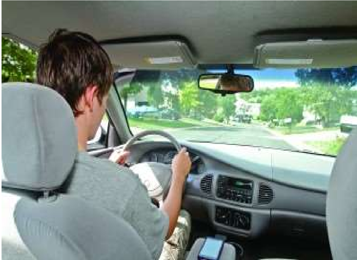
Slika 6: Upravljanje vozilom