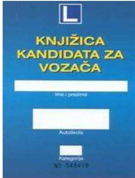
Slika 2. Knjižica kandidata za vozača