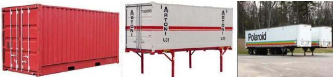
Slika 2. Osnovne intermodalne transportne jedinice