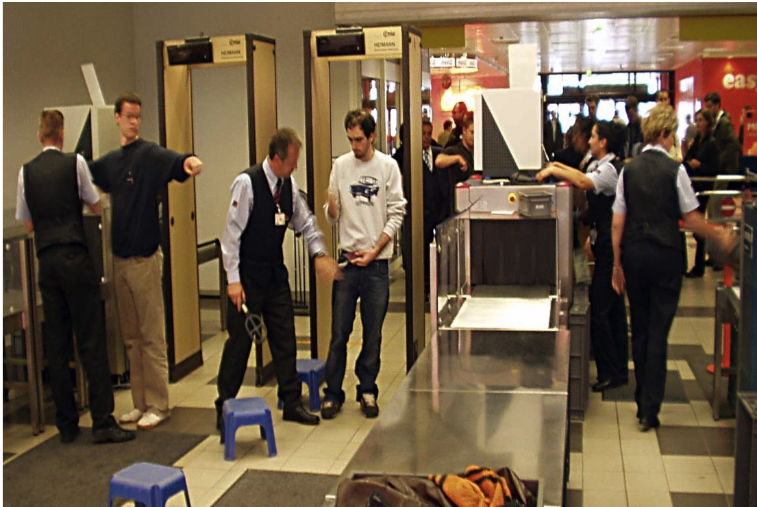
Slika 3. Sigurnosna provjera putnika