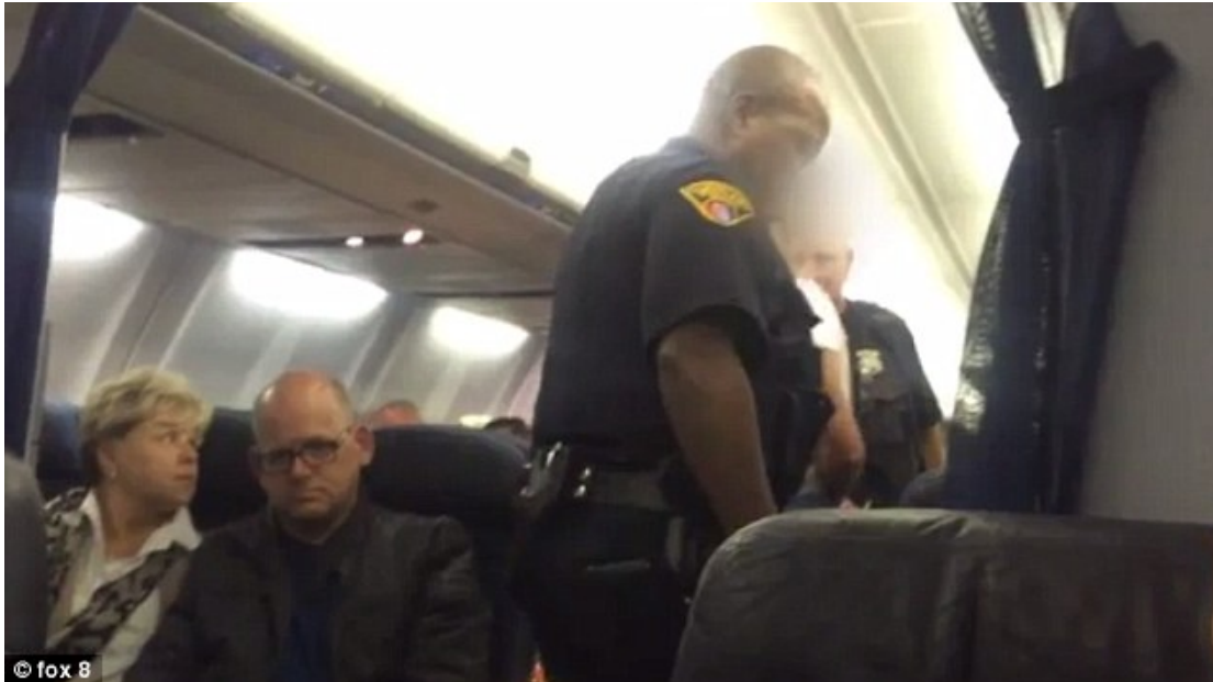
Slika 8. Preuzimanje unruly putnika unutar zrakoplova od strane lokalnih vlasti

Zapovjednik zrakoplova dužan je obavijestiti prijevoznika ili lokalne vlasti o svakoj ozbiljnoj situaciji vezanoj uz unruly putnika unutar zrakoplova. Ukoliko se to smatra potrebnim, zapovjednik zrakoplova ili operator mogu zatražiti prisutnost lokalnih vlasti i policijskih dužnosnika nakon slijetanja zrakoplova u svrhu bilo kakvog kaznenog progona odgovornih osoba. Na slici 8 prikazan je ulazak lokalnih vlasti unutar zrakoplova nakon slijetanja u svrhu preuzimanja unruly putnika pod svoju nadležnost.