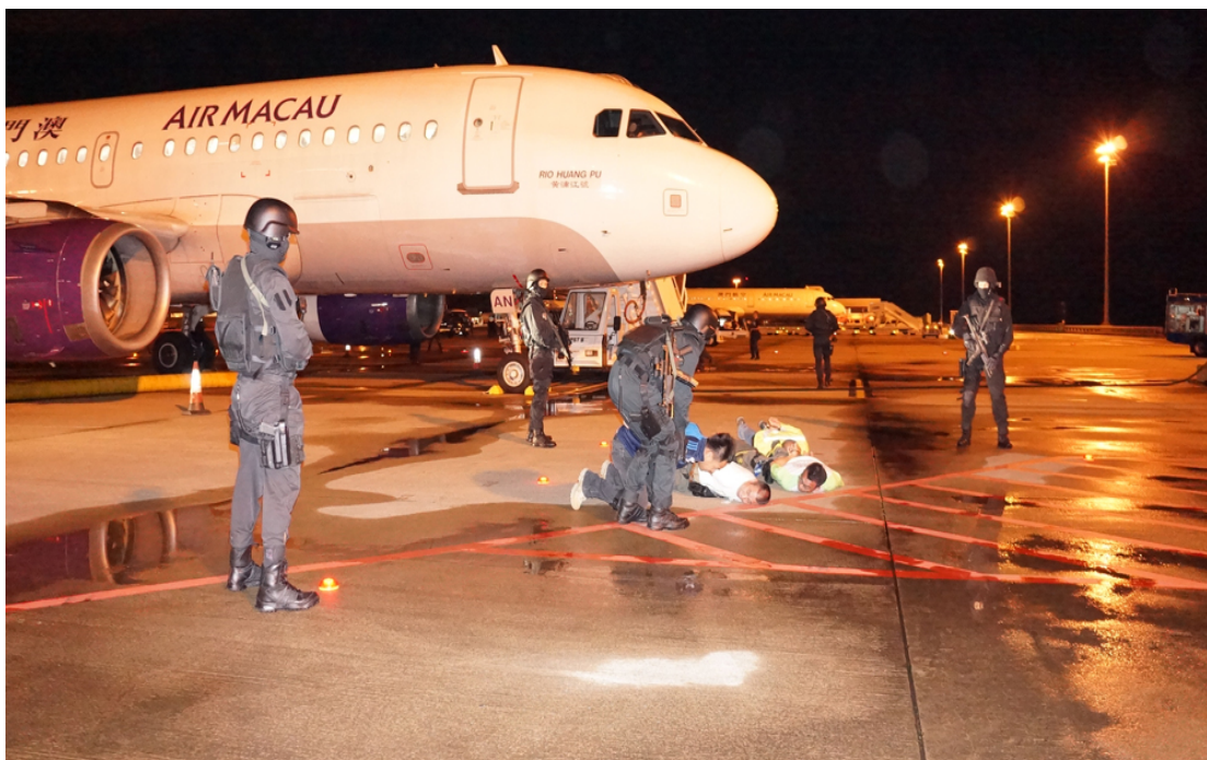
Slika 2. Neuspjelo djelo nezakonitog ometanja

Sve zračne luke i operatori koji obavljaju operacije unutar teritorija države potpisnice, dužne su uspostaviti, provoditi i održavati pisani Program zaštite zračne luke, dakle Program zaštite operatora koji moraju biti napisani u skladu s Nacionalnim programom zaštite. Svi operatori obavljaju letove prema "Code-sharing" sporazumu zajedno s nekim drugim operatorom, o tome su dužni obavijestiti odgovarajuće nadležno tijelo, uključujući identitet drugih operatora. Svaka država potpisnica mora uspostaviti mjere za sprečavanje unosa bilo kojim sredstvima, oružju, eksplozivnim ili drugim opasnim napravama, predmetima i tvarima koje mogu biti upotrijebljene za počinjenje djela nezakonitog ometanja, na prijevoz ili neovlašteno unošenje u zrakoplov uključen u civilno zrakoplovstvo.