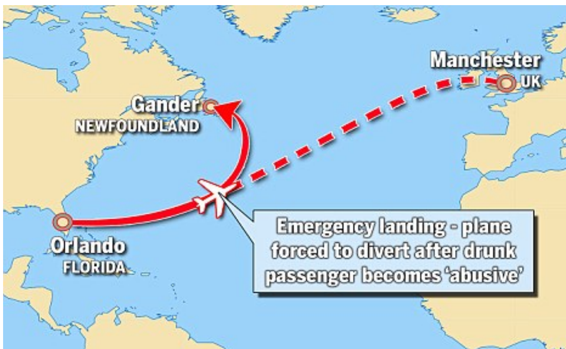
Slika 6. Preusmjeravanje zrakoplova zbog incidenta uzrokovanog unruly putnikom