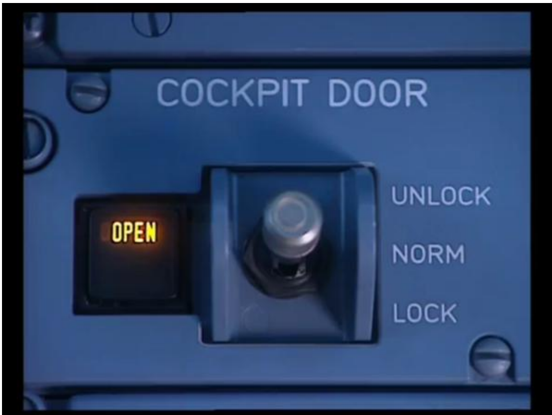
Slika 11. Sustav za automatsko zaključavanje te otključavanje vrata cockpit-a

Ako je putnik nasilan, zaključavaju se vrata cockpit-a koja moraju imati ručni ili automatski sustav zaključavanja i biti otporna na pokušaj nasilne provale u cockpit te moraju sadržavati kameru s kojom letačko osoblje može promatrati situaciju ispred vrata (ukoliko je primjenjivo na tipu zrakoplova). Izgled sustava za automatsko zaključavanje vrata cockpit-a te izgled sustava za ručno zaključavanje vrata cockpit-a dani su na slikama 11 i 12. Zapovjednik zrakoplova, ukoliko smatra da za to postoji potreba, informira kontrolu zračnog prometa o postojanju ovakvog putnika te zahtjeva pomoć nakon slijetanja zrakoplova. Zapovjednik zrakoplova mora provjeriti jesu li nakon proživljenog incidenta svi ostali članovi posade sposobni za obavljanje svojih dužnosti te mora osigurati da je kompanija izvještena o počinjenom incidentu u slučaju medijskog interesa. 10