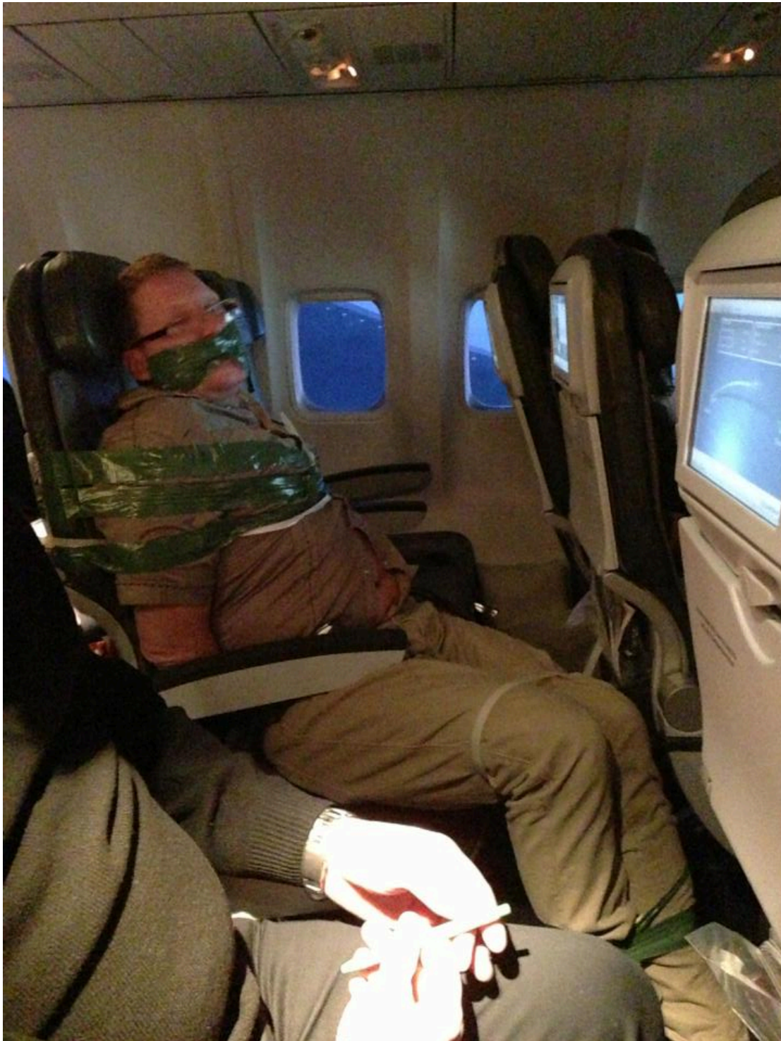
Slika 4. Primjer obuzdavanja putnika unutar zrakoplova