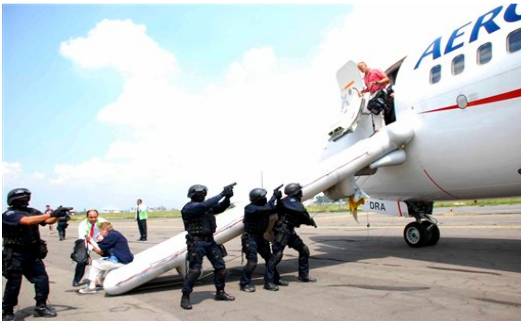
Slika 10. Policijska intervencija nad zrakoplovom

Zakoni suverene države, u kojoj policijske službe imaju nadležnost, definiraju jačinu ovlasti koje policijske službe zapravo imaju prilikom policijske intervencije. Te ovlasti se nekada ne odnose na kaznena djela počinjena unutar zrakoplova registriranog u nekoj drugoj državi. Iz ovog razloga, državama se predlaže dodatna promjena njihovog zakonodavstva u svrhu davanja ovlasti policijskim službama za mogućnost brze intervencije u slučaju sumnje na počinjenje težeg kaznenog djela unutar stranog zrakoplova registriranog izvan teritorija te države koji slijeće u njezin teritorij. Prikaz policijske intervencije prilikom počinjenja težeg kaznenog djela unutar zrakoplova prikazan je na slici 10.