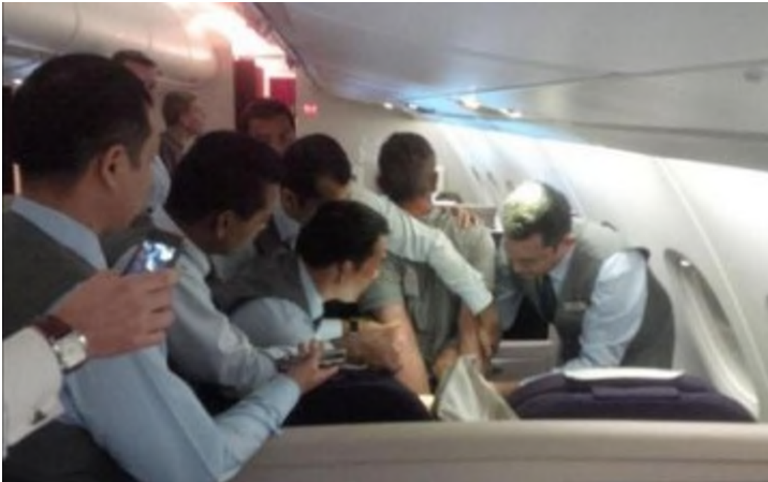
Slika 5. Pomoć od strane zrakoplovnog osoblja u obuzdavanju putnika

Zapovjednik zrakoplova, ukoliko ima dostatan broj podataka da može sumnjati u pokušaj počinjenja, ili počinjenje kaznenog djela unutar zrakoplova tijekom leta, dužan je poduzeti sve mjere zaštite zrakoplova, njegove posade, putnika i imovine protiv osobe koja izvršava takav čin. Ove mjere uključuju zadržavanje, dakle obuzdavanje osobe, i svrha im je, osim zaštite zrakoplova, osoba i imovine unutar njega, i održavanje mira i discipline unutar zrakoplova, ali i kako bi zapovjednik mogao uspješno osobu iskrcati van iz zrakoplova ili predati vlastima države u koju je zrakoplov sletio. Zapovjednik zrakoplova ovlašten je zahtijevati pomoć od strane zrakoplovnog osoblja pri zadržavanju osobe (slika 5), te je ovlašten zatražiti, ali ne i zahtijevati pomoć od strane bilo kojeg od putnika u istom. Bilo koji djelatnik zrakoplovnog osoblja ili putnik koji se nalazi u zrakoplovu može poduzeti restriktivne mjere protiv osobe za koju smatra da će počinuti, ili je počinila kazneno djelo unutar zrakoplova bez ovlaštenja zapovjednika zrakoplova, ali samo u slučaju da putnik ili osoblje smatra da je to neophodno učiniti odmah, i da bi bez poduzetih mjera postojala ozbiljna prijetnja zrakoplovu, osobama ili imovini unutar njega.