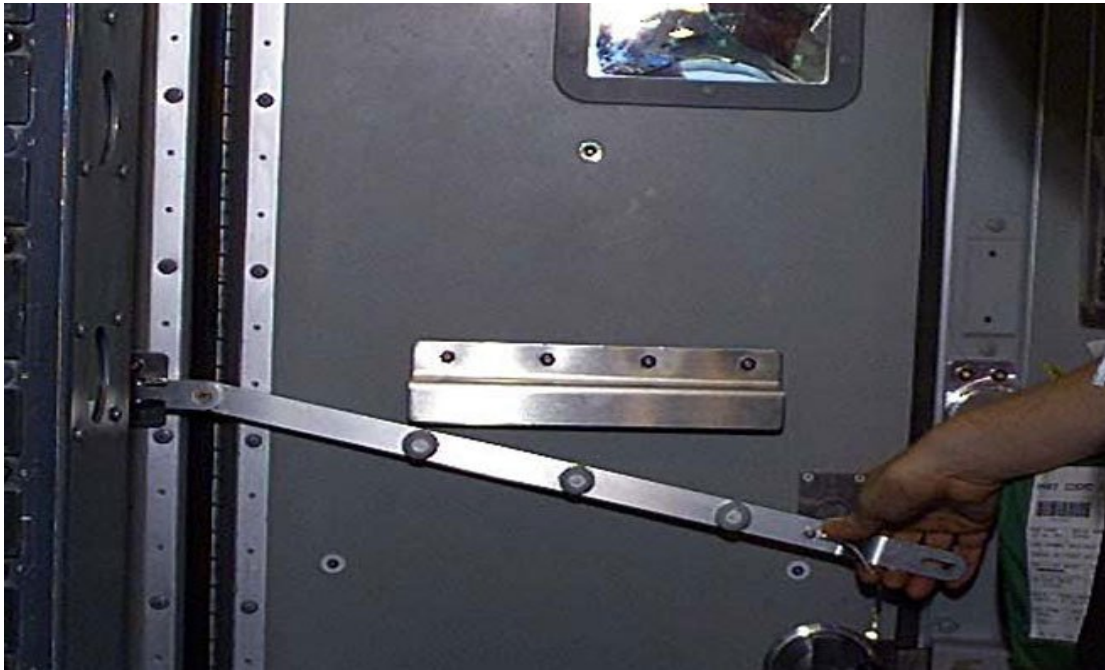
Slika 12. Prikaz vrata cockpit-a s ručnim tipom zaključavanja