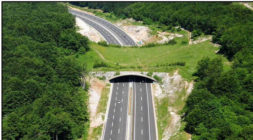
Slika 1. Prijelaz za divljač Dedin, [2]

Šesta dionica je Ravna Gora – Vrbovsko: RIR Vrbovsko – RIR Ravna Gora (od km 16+680,00 do km 31+820,00). Duljina dionice iznosi 17,47 km. Na dionici su izgrađena 3 tunela, 3 vijadukta, 2 mosta, 6 podvožnjaka i 2 raskrižja. Najdulji tunel na ovoj dionici je Javorova kosa, 1490 m. U njemu je drugi najveći visinski maksimum na cijeloj dionici autoceste Rijeka – Zagreb od 832 m nadmorske visine. Dionica se nalazi na autocesti A6. Oba kolnika imaju dodatni trak za spora vozila jer uzdužni nagib kolnika iznosi 5,5%. Na dionici se nalazi PUO Vrbovsko. Cestarina se naplaćuje na izlazima s autoceste u naplatnim postajama Ravna Gora i Vrbovsko [1].