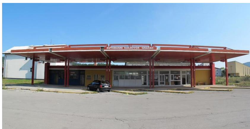
Slika 4. Autobusni kolodvor Gračac

Ima pet perona s natkrivenom čekaonicom i caffè barom.