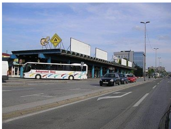
Slika 6. Autobusni kolodvor Karlovac

Autobusni kolodvor Karlovac nudi sljedeće usluge: kupovinu karata, garderobu, piće, bankomat, taxi, kiosk. AK Karlovac u vlasništvu je tvrtke Autotrans d.o.o.