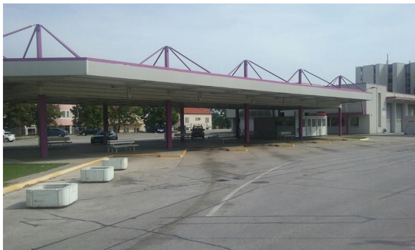
Slika 2. Autobusni kolodvor Sinj