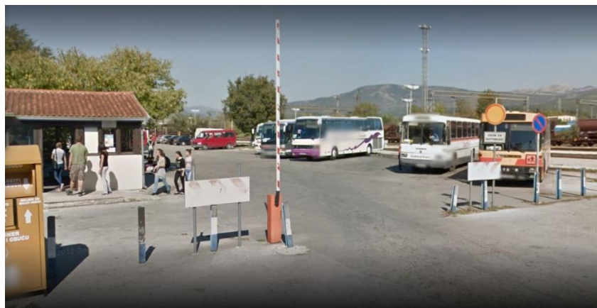
Slika 3. Autobusni kolodvor Knin

Autobusni kolodvor u Kninu nalazi se u centru grada, u blizini željezničke pruge. U sklopu kolodvora nalazi se objekt u kojem se vrši prodaja karata, dolazno-odlazni peroni, parking i ugostiteljski objekt. Peroni su otvorenog tipa.