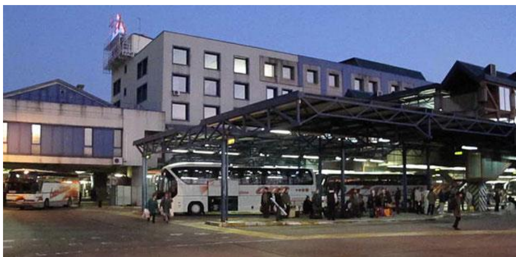
Slika 7. Autobusni kolodvor Zagreb

Kako bi se omogućio nesmetan pristup svim kategorijama korisnika, zgrada Autobusnog kolodvora u potpunosti je prilagođena osobama s poteškoćama u kretanju. [15]