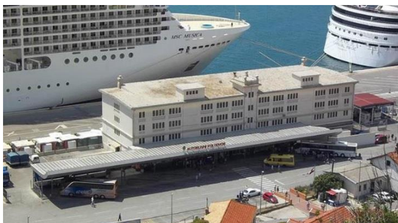
Slika 8. Autobusni kolodvor Dubrovnik

Također, s dubrovačkog autobusnog kolodvora odvijaju se polasci prema međunarodnim odredištima (Međugorje, Mostar, Sarajevo, Budva). [29]