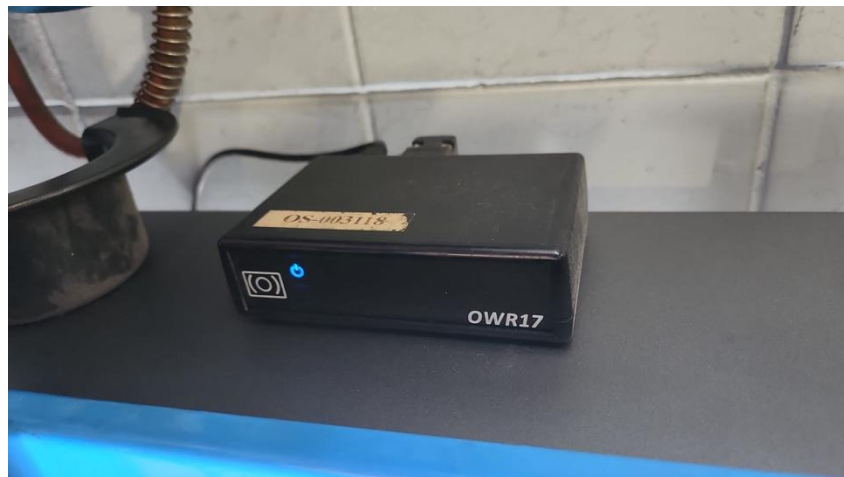
Slika 2. OBD-II skener

[39]. Ova tehnologija ima potencijal da dodatno smanji vrijeme potrebno za popravak i održavanje vozila te poveća sigurnost i učinkovitost vozila na cestama. OBD sustav tako predstavlja korak naprijed u tehnologiji vozila, pružajući neprekidan nadzor i održavanje optimalne učinkovitosti te usklađenosti vozila s ekološkim standardima [39].