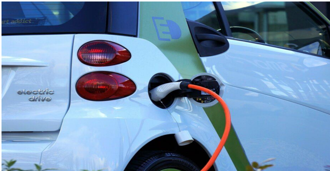
Slika 2. Plug in punjenje

Tradicionalno plug-in punjenje je najčešći i najekonomičniji način punjenja za električne autobuse. Ova metoda nudi različite opcije, od sporog do brzog punjenja. Konduktivno punjenje, kod kojeg postoji izravan fizički kontakt kojim se električna energija prenosi na krajnjim stanicama, trenutno je najraširenija tehnologija za koju je relativno lako procijeniti troškove.