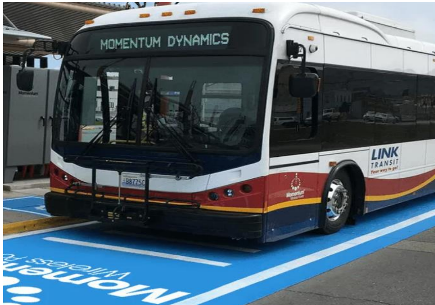
Slika 4. Induktivno punjenje