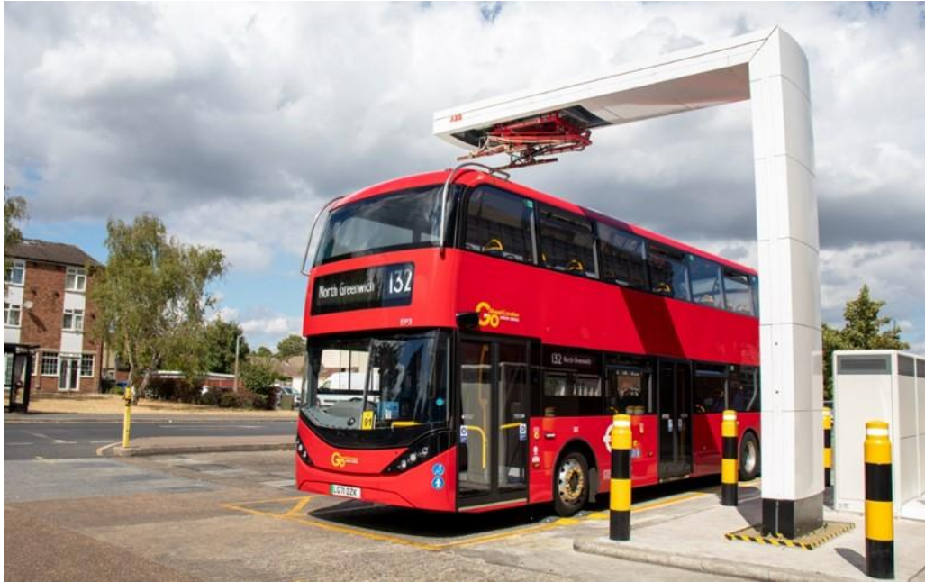
Slika 3. Pantograf punjenje