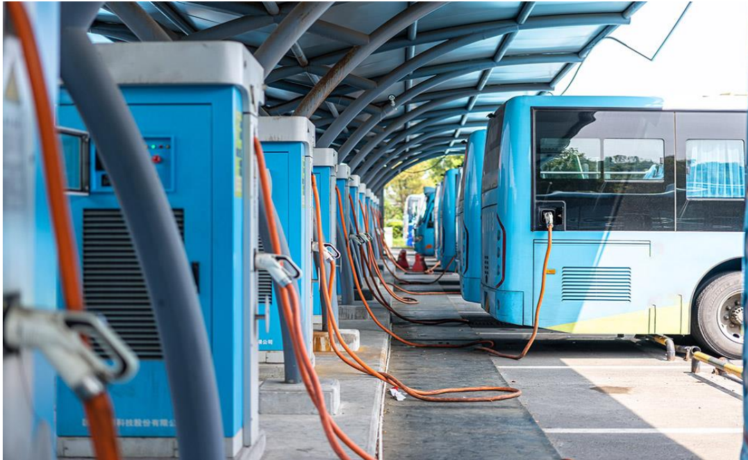
Slika 5. Punjenje električnih autobusa

Nadalje se prikazuje punionica električnih autobusa.