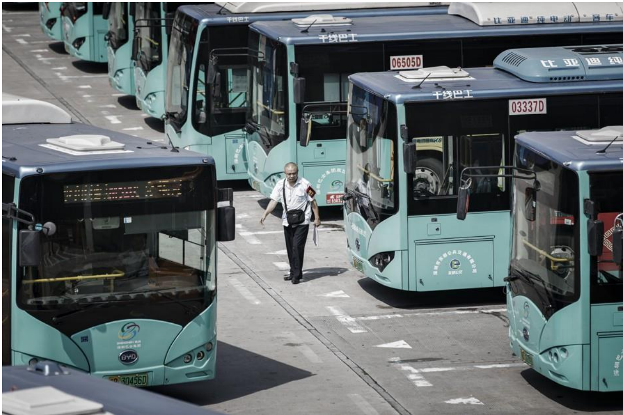
Slika 1. Dio voznog parka kineskog grada Shenzhena