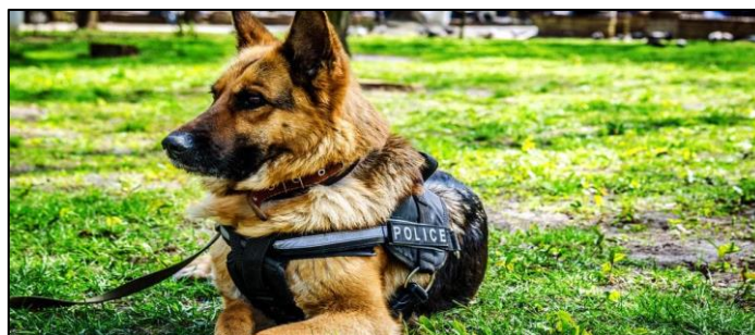
Slika 11. Njemački ovčar

Njemački ovčari (slika 11.) su energični, neustrašivi i lojalni, posebno se uzgajaju za vojne i policijske poslove. Njemački ovčar tradicionalno je bio pasmina izbora zbog svoje duge povijesti razvoja radne sposobnosti [25].