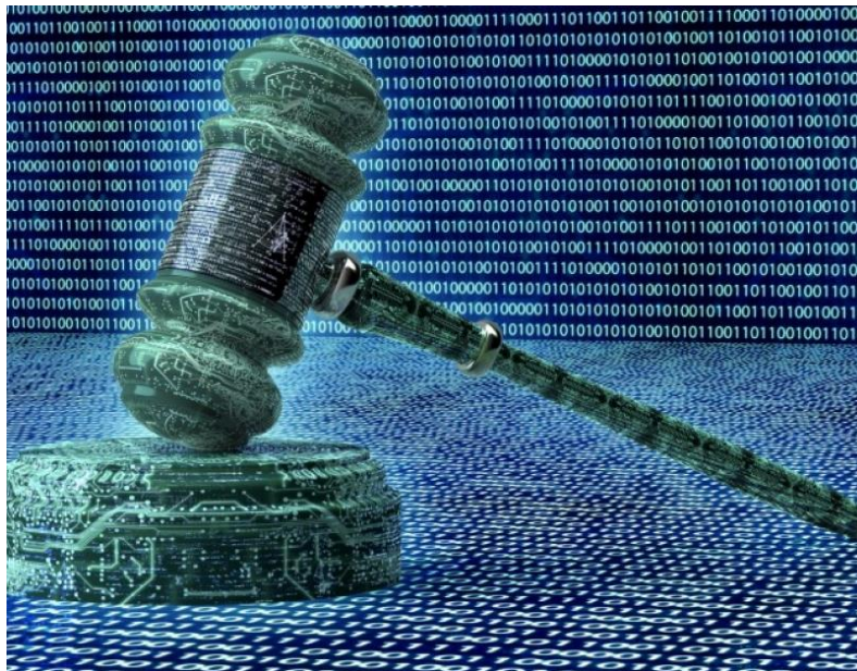
Slika 1. Kibernetičko pravo 1

Ako neka osoba prekrši kibernetički zakon, protiv te osobe će se poduzeti mjere temeljem vrste kibernetičkog zakona koji je prekršio, države u kojoj živi, odnosno u kojoj je prekršio zakon. Postoji mnogo situacija kršenja zakona kao što je zakon koji se prekrši na web stranici. Tada će račun biti zabranjen ili suspendiran i blokirana IP (eng. Internet Protocol ) adresa korisnika. Najvažnije je kazniti kriminalce ili ih dovesti iza rešetaka, jer većina kibernetičkog kriminala prelazi granicu kriminala koji se ne može smatrati uobičajenim kriminalom [2].