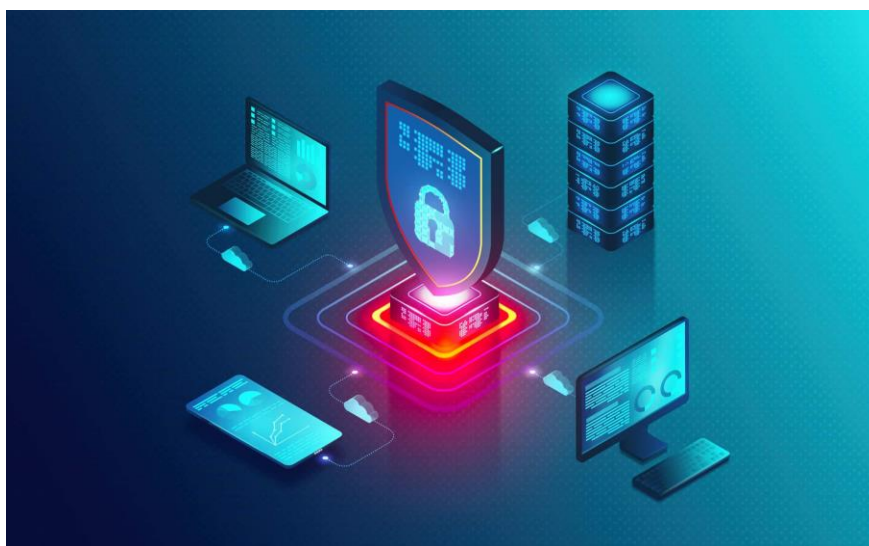
Slika 2. Kibernetička sigurnost 17

Snažna strategija kibernetičke sigurnosti može pružiti dobru sigurnosnu poziciju protiv zlonamjernih napada osmišljenih za pristup, izmjenu, brisanje, uništavanje ili iznuđivanje sustava i osjetljivih podataka organizacije ili korisnika. Također, kibernetička sigurnost je ključna u sprječavanju napada koji imaju za cilj onemogućiti ili poremetiti rad sustava ili uređaja [11].