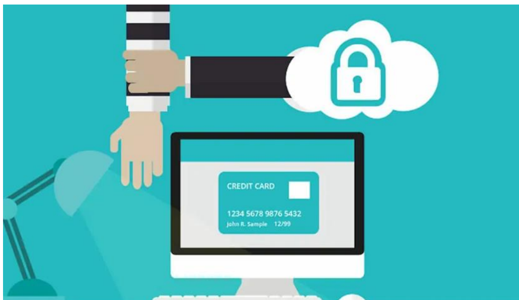
Slika 4. Sigurnost osobnih podataka 35

Sigurnost podataka ključna je za organizacije javnog i privatnog sektora iz raznih razloga. Postoji zakonska i moralna obveza tvrtki da zaštite svoje korisnike i korisničke podatke od pada u pogrešne ruke. Na primjer, financijske tvrtke mogu podlijegati standardu sigurnosti podataka industrije platnih kartica koji prisiljava tvrtke da poduzmu sve razumne mjere za zaštitu podataka o klijentima [45].