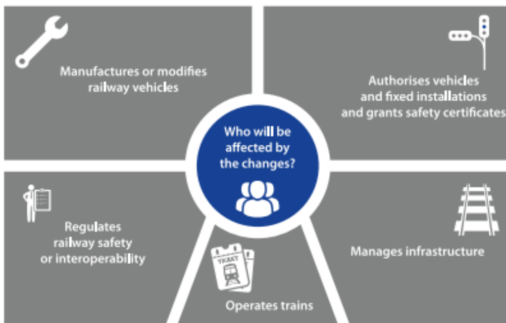
Slika 1: Utjecaj provedbe četvrtog željezničkog paketa

kreću iz istog polazišta. Kao najjednostavniji primjer možemo uzeti starost željezničkih vozila te razinu sigurnosti pojedinih signalno-sigurnosnih uređaja.