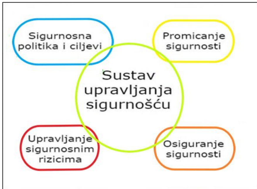
Slika 1. Komponente sustava upravljanja sigurnošću prema ICAO-u