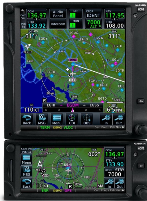
Slika 12. Garmin GTN 750 i GTN 650 navigatori, [20]

Na slici 12. su prikazani Garmin GTN 750 i GTN 650, GTN 750 je gornji uređaj, ispod njega je GTN650 u čestoj konfiguraciji kod modifikacije zrakoplova.