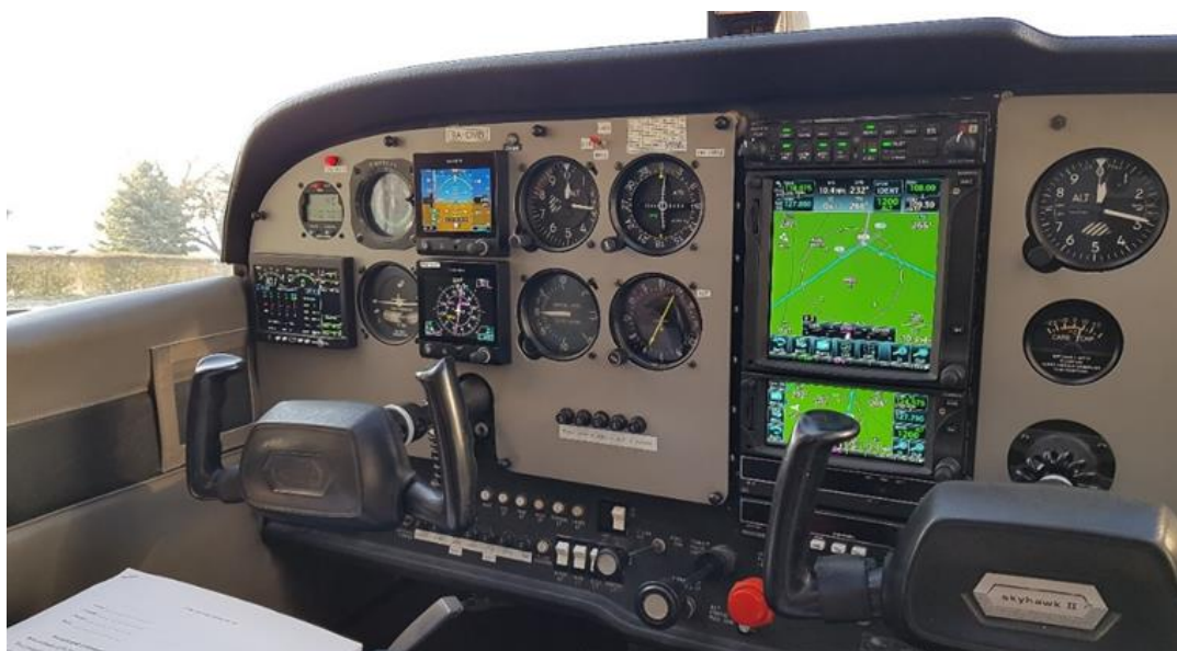
Slika 4. Modificirana instrument ploča 9A-DMB, [14]

Nakon uzimanja mjera razmaka iza ploče, radi se raspored novih instrumenata na novoj ploči. Odlučeno je zadržati klasični izgled osnovnih šest ( engl. basic six ) instrumenata koji su opisani u 4. poglavlju. Umjetni horizont i prikaznik horizontalne situacije su zamijenjeni modernim Garminovim G5 instrumentima, za navigacijski i komunikacijski sustav odlučeno je ugraditi u sredinu ploče Garminove GTN 750 i GTN 650 sustave. EDM 900 sustav nadziranja parametara motora je smješten na lijevoj strani instrument ploče. Ostali klasični instrumenti su zadržani na pozicijama kao osnovnih šest instrumenata. Modificirana instrument ploča prikazana je na slici 4.