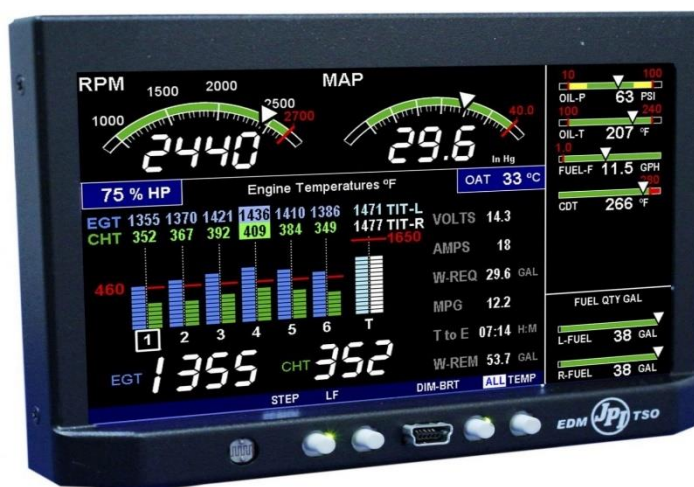
Slika 13. EDM 900 sustav za praćenje parametara motora, [21]

Gorivni sustav je spojen preko plovaka u svakom spremniku goriva te može uz protok goriva odrediti približnu istrajnost leta. Prikazuje se skraćenicom „T to E“ ( engl. Time to empty ), preostalo gorivo u spremnicima se prikazuje uz skraćenicu „REM“ ( engl. Remaining ) i iskorišteno gorivo kao „USD“ ( engl. Used ). Gorivo se prilikom svakog leta mora upisati i potvrditi koliko je ručno izmjereno u spremnicima. Ako u slučaju leta ili na zemlji dođe do neusklađenosti goriva među spremnicima, na zaslonu će se prikazati „fuel quantity mismatch“.