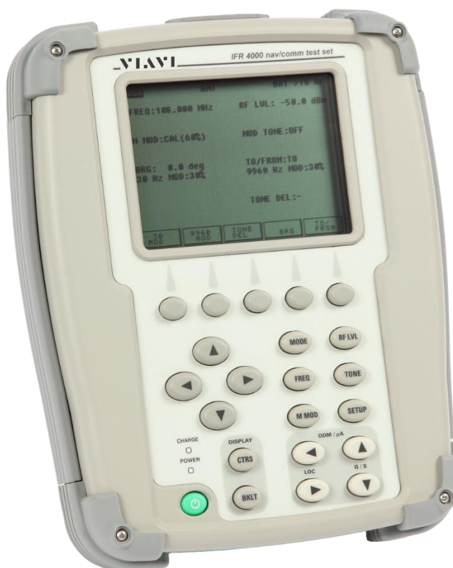
Slika 8. Viavi IFR 4000 oprema za testiranje navigacije i komunikacije, [19]

Oprema koja se koristi za testiranje ILS, VOR, VHF/UHF komunikacijskog sustava te marker beacon-a dok je zrakoplov stacioniran na tlu prikazana je na slici 8.