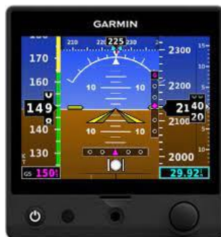
Slika 10. Garmin G5 u ulozi PFD-a, [20]

Ako neka od funkcija G5 nije operativna, 'X' crvene boje se prikaže iznad instrumenta ili podataka do kojih je došlo do kvara. Nakon uključivanja G5, određeni instrumenti ostaju neupotrebljivi jer se oprema i sustav pokreću. Svi instrumenti bi trebali biti operativan unutar jedne minute nakon uključivanja no ako neki instrument ostane prekrižen crvenim x-om onda znači da nije operativan i treba servisiranje.