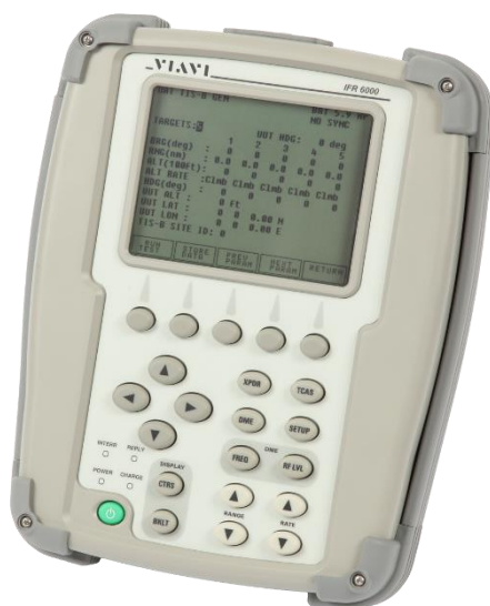
Slika 7. Viavi IFR 6000 oprema za testiranje transpondera, [18]

Za testiranje transpondera zrakoplov mora biti postavljen van hangara na čistinu. Transponder se uključuje te stavlja na mod rada ALT te se čeka dvije minute kako bi se uspostavila GPS pozicija. Kada se uspostavila GPS pozicija zrakoplova, pomoću opreme kao što je IFR 6000, prikazana na slici 7., se provjerava i uspoređuje geografska širina i geografska dužina sa stvarnom na kojoj je zrakoplov pozicioniran.