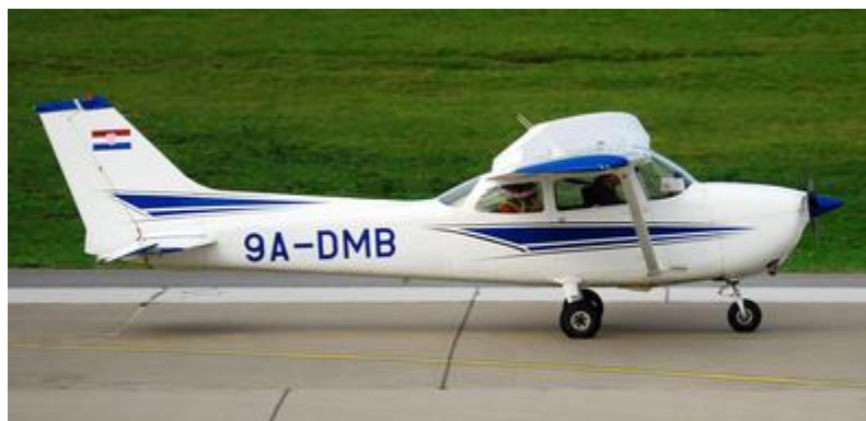
Slika 1. C172N registracijske oznake 9A-DMB, [2]

Navedene aspekte je Cessna iskoristila kada je dizajnirala, prilagođavala i stavljala na tržište ovaj model zrakoplova čime je privukla mnogo mušterije kroz svoj vijek rada [1].