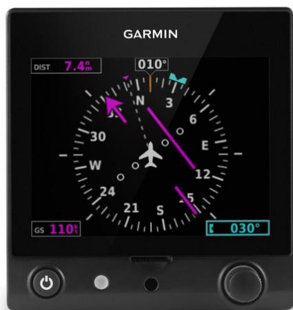
Slika 11. Garmin G6 u ulozi HSI-a, [20]

G5 u ulozi HSI-a, a prikazan na slici 11. prikazuje u sredini ekrana kompasnu ružu koja se okreće tijekom leta, a ovisno o pravcu leta. Unutar kompasne ruže postoje četiri točke koje predstavljaju odstupanje od zadanog radijala po VOR-u, kursa leta ili ILS localisera, ovisno u kojem se modu leti. U gornjem desnom kutu je prikazana udaljenost u nautičkim miljama do sljedeće GPS točke. Glavni rotacijski gumb služi za odabiranje željenog pravca leta ili radijala VOR-a. U usporedbi sa žiroskopskim instrumentima, G5 ne pati od precesije što ga čini pouzdanijim i točnijim od analognih mehaničkih instrumenata. Oba G5 instrumenta su spojeni na sabirnicu namijenjenu za avioniku sa osiguračima postavljenim na instrument ploči na lijevoj pilotskoj strani sa desne strane volana.