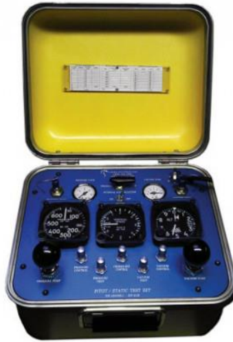
Slika 6. Oprema za testiranje pitot-statičkog sustava, AD450E-1, [16]

Testiranje pitot - statičkog sustava se provodi nakon bilo koje izmjene na spojevima sustava ili instrumenata. Testiranja su nužna kako bi se utvrdilo da ne postoje curenja na spojevima, a izvodi se uz pomoć posebne opreme koja je prikazana na slici 6.