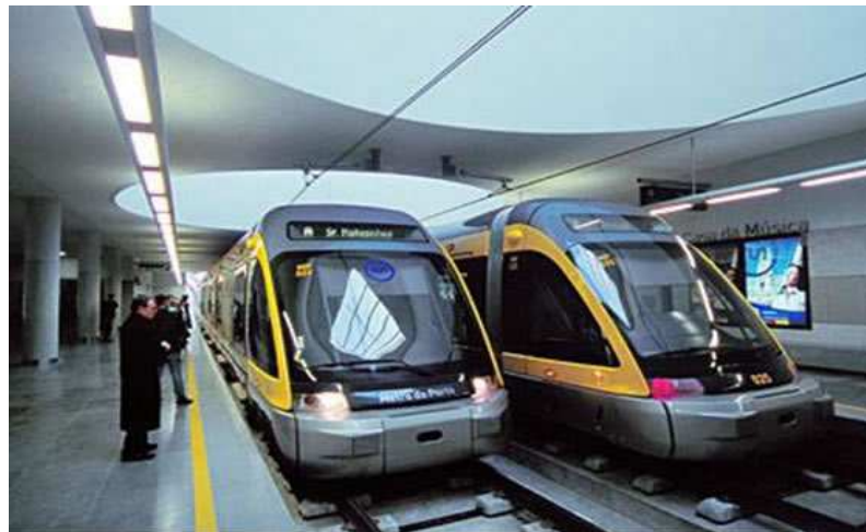
Laka gradska željeznica u Portu u Portugalu