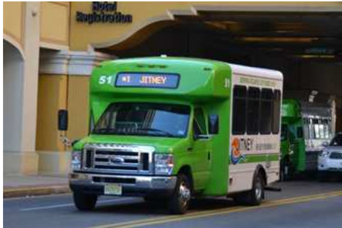
Slika 11. Jitney vozila u Atlantic Cityju

Jitney je vrsta usluge koja se prema obilježjima može svrstati između taksi usluge i redovitog autobusnog pravca. Prijevoz se može obavljati automobilima, kombijima i minibusima. Jitney prometuje uzduž stalnog pravca te može imati stalna stajališta. Nema redovitog voznog reda, putnici se voze u istom vozilu, a cijena usluge je stalna i niska. U nekim mjestima jitney skreće s pravca nekoliko blokova da bi iskrcao putnike pred njihovim vratima, ali se za to plaća posebna vozarina. Jitneyi su skuplji od autobusa, no njihova prosječna brzina je dvostruko veća. Jitney se prvi put pojavio u Los Angelesu 1914. godine tijekom perioda velike nezaposlenosti, pa su ljudi koji su posjedovali automobile pokušali zarađivati tako da su kupili putnike na tramvajskim linijama. San Diego je ukinuo taksi usluge 1979. godine, a istodobno je legalizirao rad jitneya. Prema Reinkeu, 1986. postojalo je 21 jitney poduzeća koje je prometovalo s 58 vozila, uglavnom kombija od 12 do 20 sjedala. Jitneyi su važno prijevozno sredstvo u mnogim gradovima u svijetu. Neki gradovima u kojima se koriste jitney usluge su Caracasa, Manili, Beirut, Buenos Aires, Hong Kong, Carigrad, San Juan, Teheran, Mexico City, itd. U Hrvatskoj ne postoje usluge prijevoza kao što je jitney.[2]