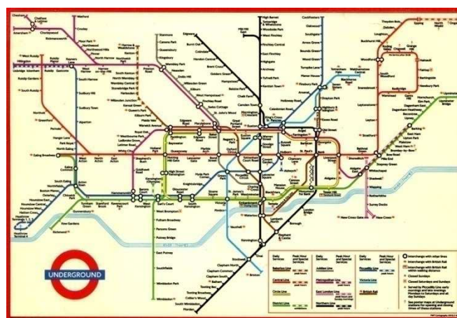
Slika 5. Mreže linije metro sustava u Londonu

Londonska podzemna željeznica otvorena je 9. siječnja 1863. godine i tako je postala prva svjetska podzemna željeznica te je tog dana njom putovalo 40 tisuća putnika. Londonski metro je poznat pod nazivom „Tube“. Podzemna željeznica odlično pokriva središte grada i obično je najbrže prijevozno sredstvo ako se vaše odredište nalazi u blizini postaje Tubea te metro uvelike smanjuje gužvu na površinskom prometu. Do danas se londonska podzemna željeznica uvelike razvila, dugačka je 408 kilometara, ima 247 stanica i čak 11 linija. Postoje linije izvan i ispod površine, ali većina stanica je ispod zemlje tako da stanice ukupno imaju 412 pokretnih stepenica. Kartice za vožnju metroom kupuju se na šalterima dok lokalno stanovništvo najčešće koristi elektronsku karticu sa ugrađenim čipom, a za turiste je najbolja opcija kupovanje cjelodnevne karte. Zanimljiv podatak je da su prvi automatski uređaji za izdavanje karata bili u upotrebi od 1908. godine.[10] Uz činjenicu da je 'Tube' najstariji metro na svijetu, mnogi ga pamte po samoubilačkom terorističkom napadu 7. srpnja 2005. godine. To je ujedno najveća tragedija u povijesti londonskog metroa, jer su u razmaku od 50 sekundi eksplodirale tri bombe koje su odnijele 26 života te teško ozlijedile 60.[9]