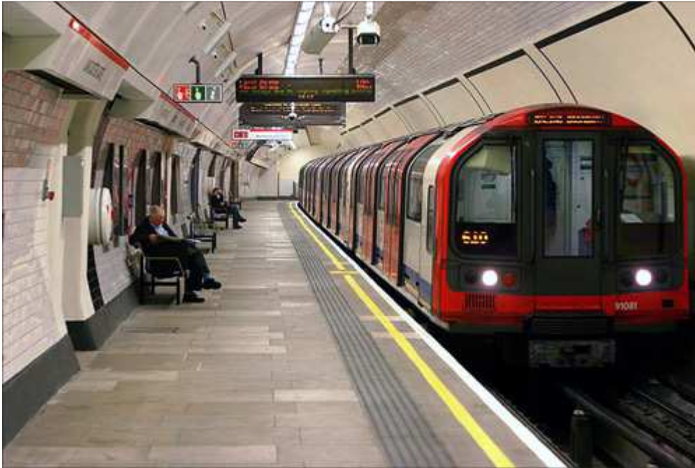
Slika 6. Londonski metro