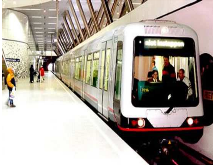
Laka gradska željeznica u Rotterdamu, Nizozemska