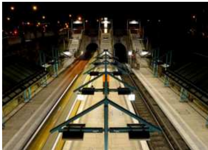
Slika 4. Stajalište Pragsatted u Stuttgartu

Starije izvedbe vozila lake željeznice zahtijevaju visoku izvedbu perona zbog visine poda u vozilima 850 – 1000 mm iznad gornjeg ruba tračnice (GRT), dok se suvremena vozila niskopodne konstrukcije s visinama poda oko 300 mm iznad GRT što omogućuje pristup s niskih perona na stajalištima.[1]