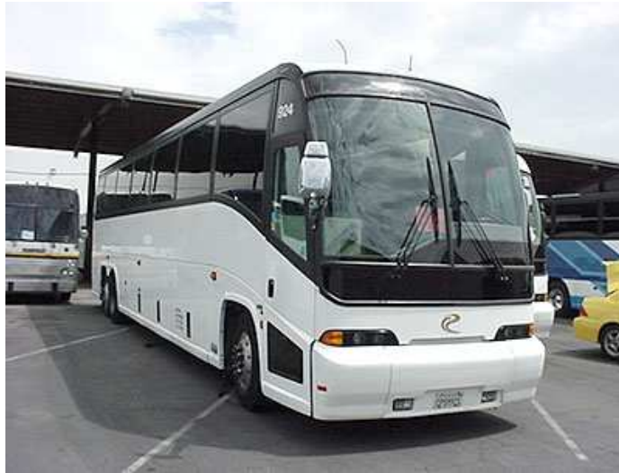
Slika 9. Standardni autobus

Standardni autobus je vrsta cestovnog vozila koje se za prijevoz gradskih i prigradskih putnika u svijetu najčešće koristi zbog svojih zadovoljavajućih tehničko-eksploatacijskih i ekonomsko-organizacijskih karakteristika.[3]