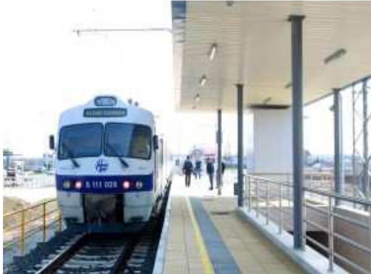
Slika 1. Stajalište prigradske željeznice u Buzinu