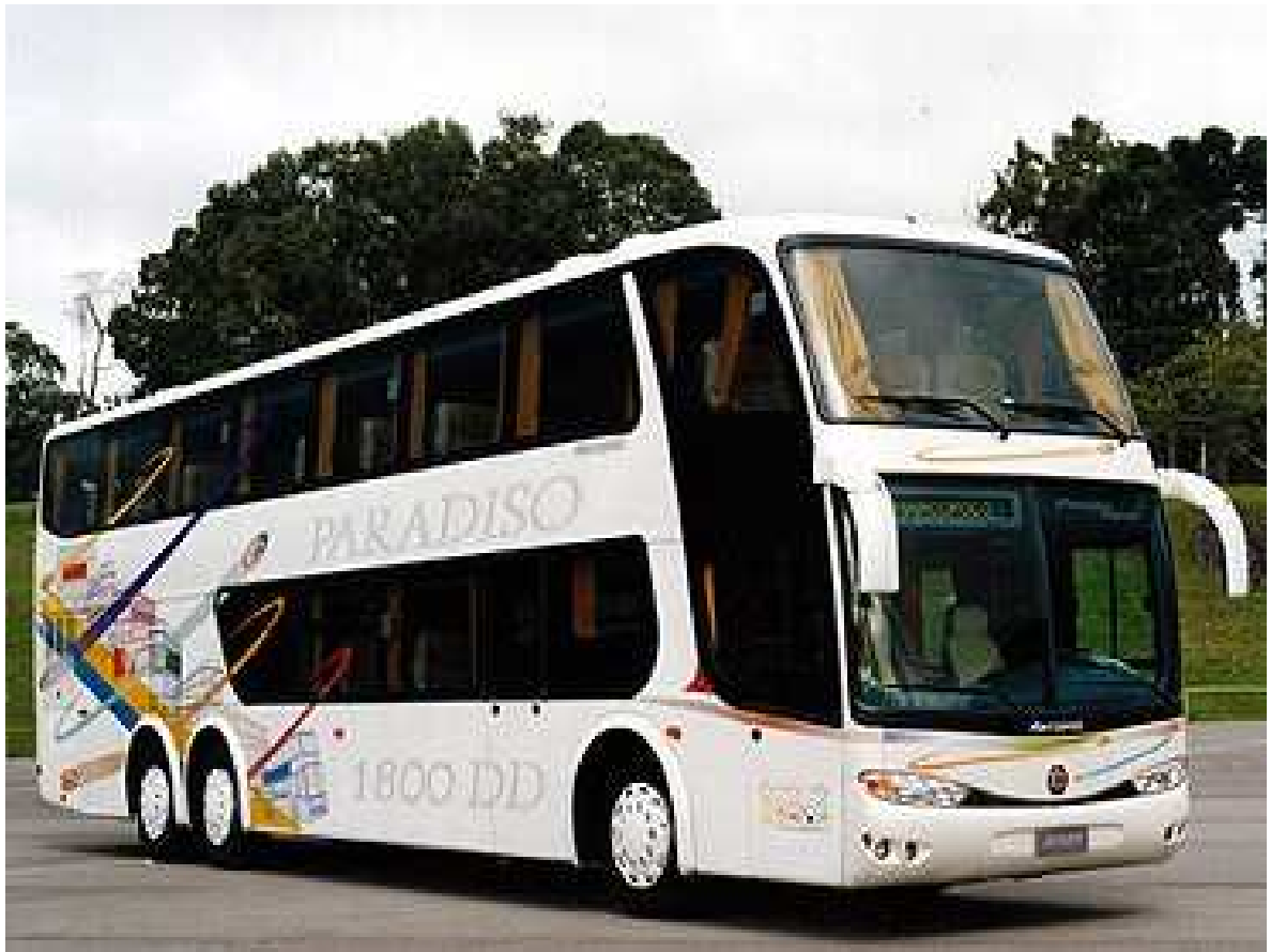
Slika 10. Autobus na kat