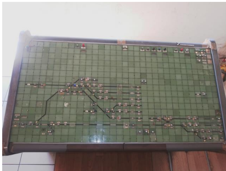
Slika 10. Postavni stol elektro-relejnog uređaja „Iskra-Lorenz“ u prometnom uredu kolodvora Ploče

Signalno sigurnosni uređaj kolodvora Ploče je potpuni elektrotelejni uređaj sistema ISKRA-LORENZ. Uređaj osigurava puteve vožnje za ulaz u teretni kolodvor kao i izlaz iz teretnog kolodvora prema Rogotinu, te ulaz u putnički kolodvor kao i izlaz iz putničkog kolodvora prema Rogotinu. Uređaj osigurava i pojedine manevarske vozne puteve. SS-uređajem rukuje se centralno putem komandnog stola iz zgrade postavnice. Na ploči komandnog stola nalazi se kolosiječna slika komandnog stola, tipke odnosno tasteri i pokazivači stanja. Postavljanje voznih puteva obavlja se pritiskanjem i otpuštanjem odgovarajućih tipki, a radnje izvršava SS-uređaj automatski. Skretnice, signali i putevi vožnje postavljaju se i pritvrđuju električnim putem. Elemente SS uređaja čine vanjski i unutarnji dijelovi