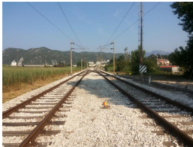
Slika 17. Ulazne skretnica u putnički kolodvor Ploče 16

Po zadanoj komandi za postavljanje voznog puta ulaza, pritiskom na startnu i ciljnu tipku i po prihvaćenoj komandi SS uređaj sam uključuje postavljanje skretnica u voznom putu (u bočnoj zaštiti i putu proklizavanja) te kontrolira njihov pravilan i ispravan položaj, slobodnost puta vožnje i puta proklizavanja, električki blokira ulazne skretnice i skretnice u