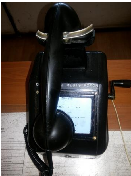
Slika 8. Induktorski telefon u kolodvoru Ploče

U induktorski telefonski vod 20-810 uključena su radna mjesta u kolodvoru Ploče: Prometnici vlakova Ploče (prometnik vlakova u glavnoj kolodvorskoj postavnici, prometnik vlakova u teretnom dijelu kolodvora i prometnik vlakova u putničkom dijelu kolodvora) – skretničari na bloku – čuvar cestovnog prijelaza Ploče. Ovaj vod se koristi pri komunikaciji sudionika u osiguranju voznih puteva (ulaz-izlaz) u kolodvoru za sve vlakovne i manevarske vožnje, kao i objavljivanje promjena u prometu unutar samog kolodvora za radnike kojih se to tiče, kao i ostalih propisanih zapovijedi i izvješća bitnih za sigurnost prometa.