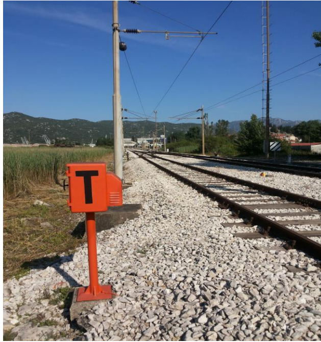
Slika 7. Telefonski ormarić u kolodvoru Ploče

Prenosnim radio-uređajem Motorola GP 340 sa rezervnom baterijom zaduženi su: šef kolodvora, prometnik vlakova kolodvorske postavnice, prometnik vlakova teretni kolodvor, skretničar na Bloku i skretničar-čuvar ŽCP-a. Razgovori obavljani preko radio-uređaja registrofonski se ne snimaju.