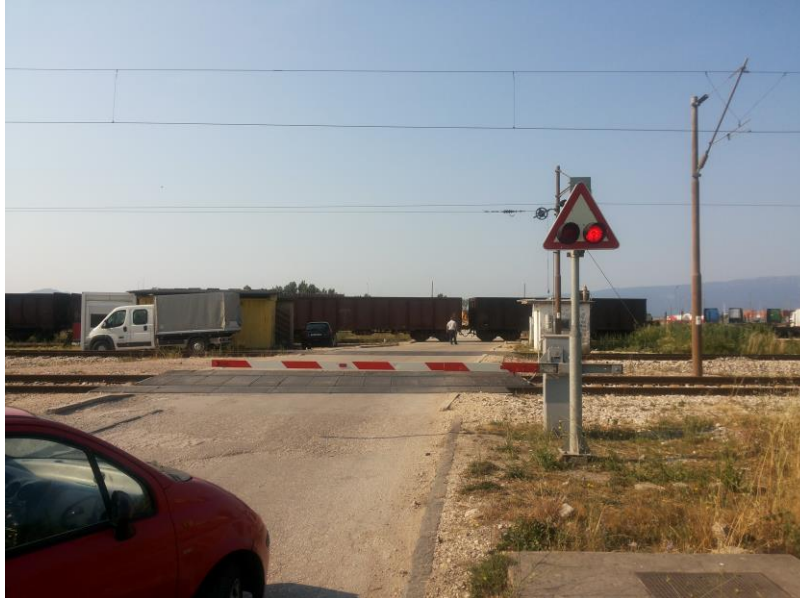
Slika 15. ŽCP Ploče sa spuštenim polubranicima

sukladno odredbama Pravilnika o načinu i uvjetima za obavljanje sigurnog tijeka željezničkog prometa. U čuvarnici ŽCP-a čuvaju se dvije pomoćne ručice sa lokotima koje se koriste za propisane situacije u slučaju kvara uređaja.