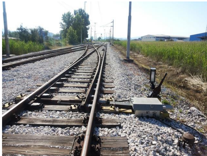
Slika 11. Skretnička postavna sprava

i utvrđuje poseban mehanizam u postavnoj spravi, a električni kontakti daju u relejni uređaj i komandni stol informaciju o tome položaju.