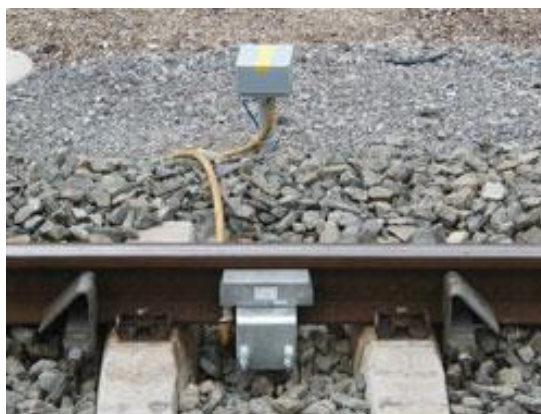
Slika 13. Vanjski dio uređaja BO1.