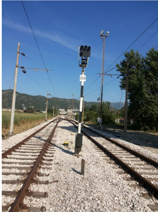
Slika 20. Granični manevarski signal iz teretnog kolodvora u putnički kolodvor