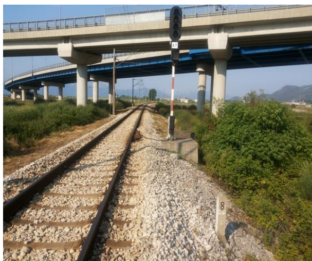
Slika 5. Ulazni signali „AT“ u teretni kolodvor