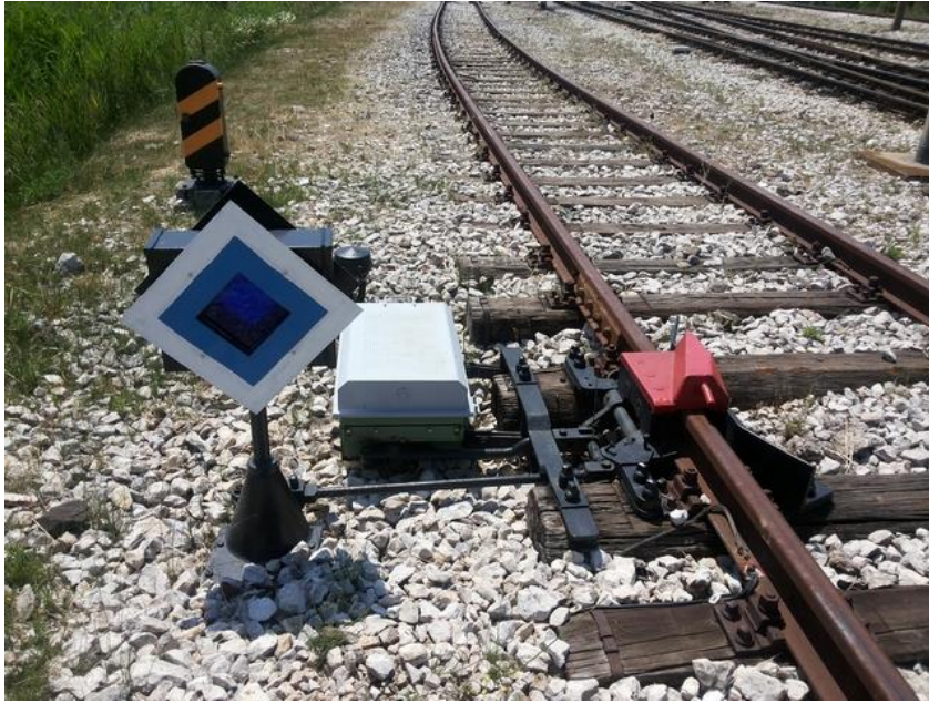
Slika 14. Iskliznica I2 u kolodvoru Ploče