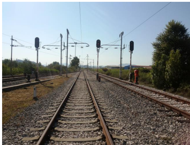
Slika 19. Izlazni signali „D4, D5 I D6“ iz putničkog kolodvora

Nakon date komande i otpuštanja tipke, SS uređaj sam postavlja, blokira i kontrolira slobodnost izlaznog puta vožnje, kao i prvog prostornog odsjeka APB-a te nakon toga postavlja izlazni signal u položaj za dozvoljenu vožnju. Pokazivač izlaznog signala na komandnom stolu pokazuje zeleno svjetlo bez obzira da li je izlaz u pravac ili skretanje.