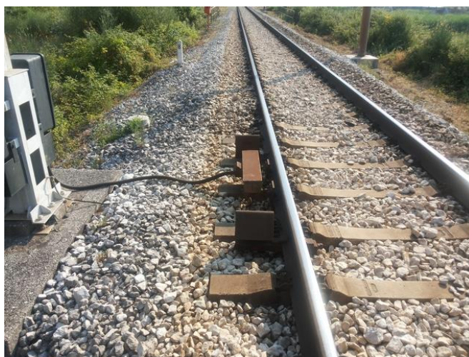
Slika 12. Pružna baliza kod ulaznog signala AT

Kolodvor Ploče opremljen je pružnim pružnim balizama AS uređaja. Kombinirane pružne balize 1000/2000 HZ ugrađene su pored prostornih signala APB-a prema Rogotinu, kao i kod ulaznih signala AT , AP, izlaznog signala C i zaštitnog signala B. Na udaljenosti 150 metara od ulaznih signala AT i AP i zaštitnog signala B ugrađene su balize 500 Hz za kontrolu brzine. 15