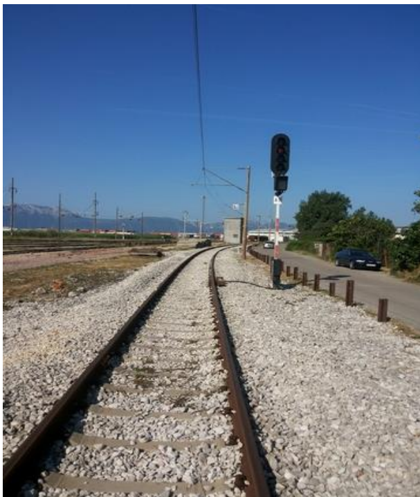
Slika 6. Ulazni signali „AP“ u putnički kolodvor