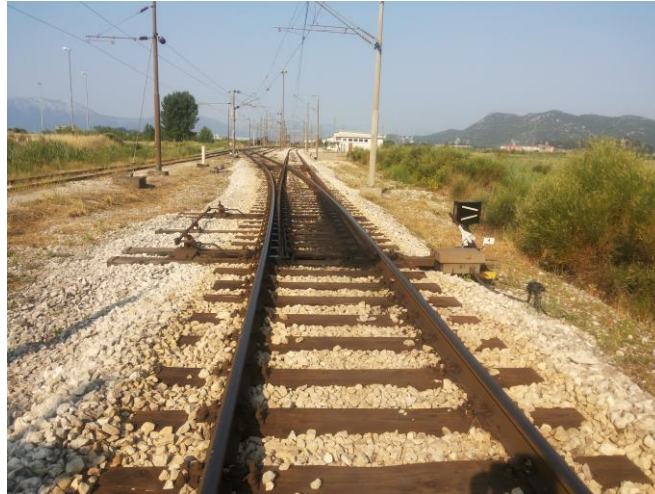
Slika 16: Ulazna skretnica br.1 u kolodvor Ploče