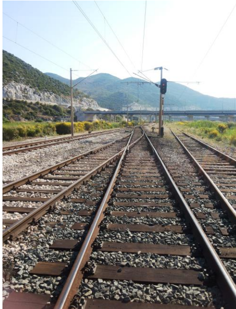
Slika 18. Izlazni signal „C“ iz teretnog kolodvora