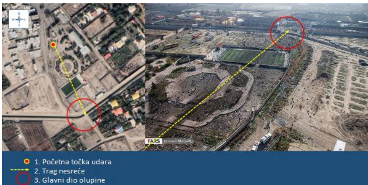
Slika 8. Prikaz početne točke pada na zemlju i klizanje, [29]

Prema snimljenim podacima prikazuje se da je zrakoplov dosegao visinu oko 2.469 metara nakon čega je oznaka pozivnog znaka i nadmorske visine zrakoplova nestala s radara, ali od pilota nije dobivena ni jedna informacija da nešto prikazuje neobične uvjete. Zrakoplov je vodio let prema pravilima leta s instrumentima (IFR 7 ), a nesreća se dogodila oko pola sata prije izlaska sunca. Zrakoplov je bio kompletno uništen pri padu. Osim štete na zrakoplovu, nesreća je prouzročila štetu na javnim dobrima, poput parka i igrališta te privatnih vrtova i imanja. Zrakoplov je pao u blizini naselja zvanog Khalajabad, a početna točka pada zrakoplova bila je u rekreacijskom parku. Trup zrakoplova, nakon što je udario u zemlju, potpuno se raspao nakon prolaska kroz nogometno igralište, što je oštetilo okolna poljoprivredna gospodarstva i vrtove. Nakon početnog udara, drugi su udarci primijećeni duž traga na mjestu nesreće, uništavajući trup i šireći se po cijelom tragu. Na slici 8. prikazan je put traga nakon pada zrakoplova. Vidljivo je kako je pao i klizio uništavajući oko sebe okolinu i posljednju lokaciju olupine nakon pada zrakoplova.