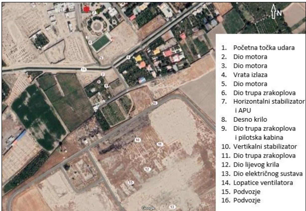
Slika 9. Pregled dijelova zrakoplova na mjestu nesreće, [29]

Dokazi vidljivi na slici 9. i dijelovi prikupljeni od zrakoplova na glavnom mjestu nesreće pokazali su da je zrakoplov još uvijek održavao svoju kompaktnost prije nego što je udario u tlo.