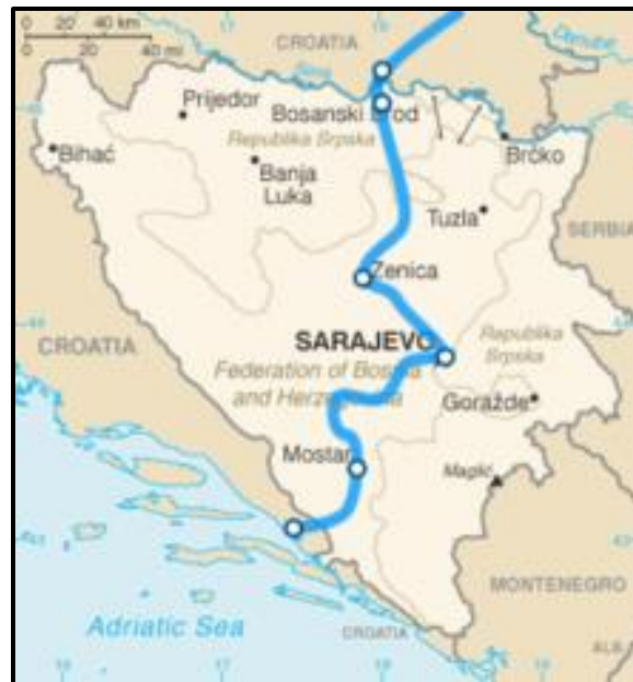
Slika 9. Prikaz koridora Vc