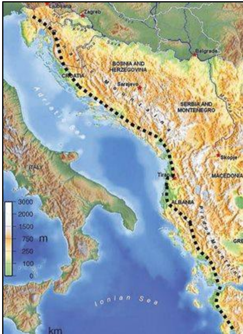
Slika 3. Jadransko – jonski autoput