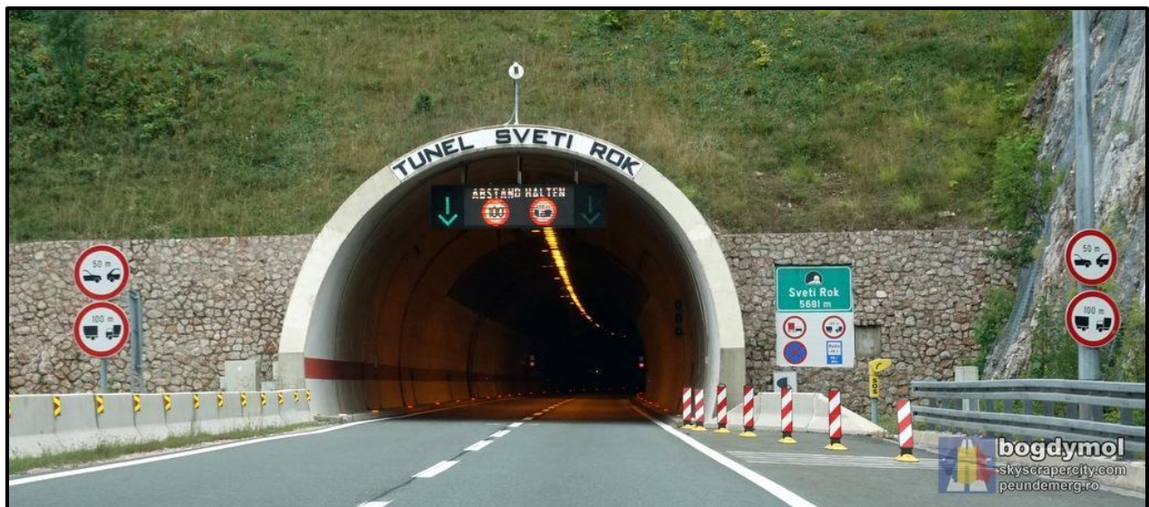
Slika 6. Tunel Sveti Rok dužine 5.681 m

Tunel Sveti Rok nalazi se na dionici tunel Sveti Rok-Maslenica. Za promet je otvoren 30. lipnja 2003.godine. Maksimalna dopuštena brzina iznosi 80km/h, a najniža 50 km/h. Tunel Sveti Rok prolazi kroz Velebit u koridoru velebitskog prijevoja. Tunel je građen „novom austrijskom metodom“ koja se pokazala vrlo prilagodljivom za različite ekološke uvjete.