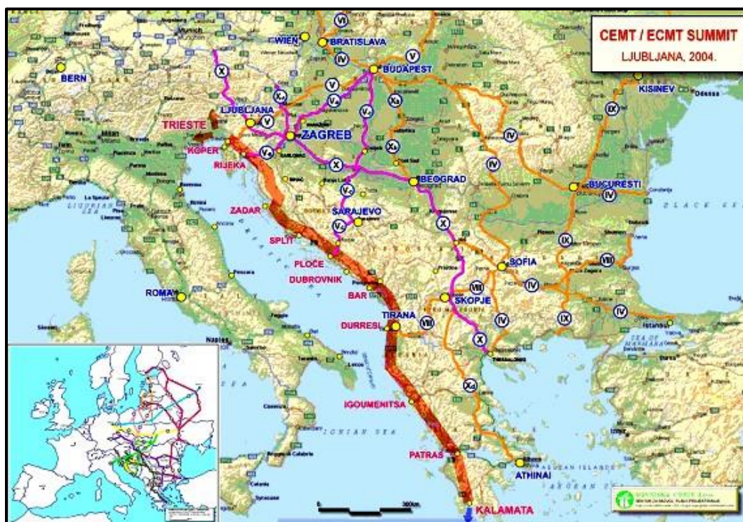
Slika 1. Jadransko – jonski transportni koridor

Jadransko-jonski pravac u mrežu zasad 10 paneuropskih prometnih koridora je podržao CEMT. CEMT (Conference Europeenne des Ministres des Transports/ Europska konferencija ministara za promet) omogućava poduzećima otpremanje roba u međunarodnom prijevozu tereta čiju dozvolu izdaje nadležno ministarstvo prometa.