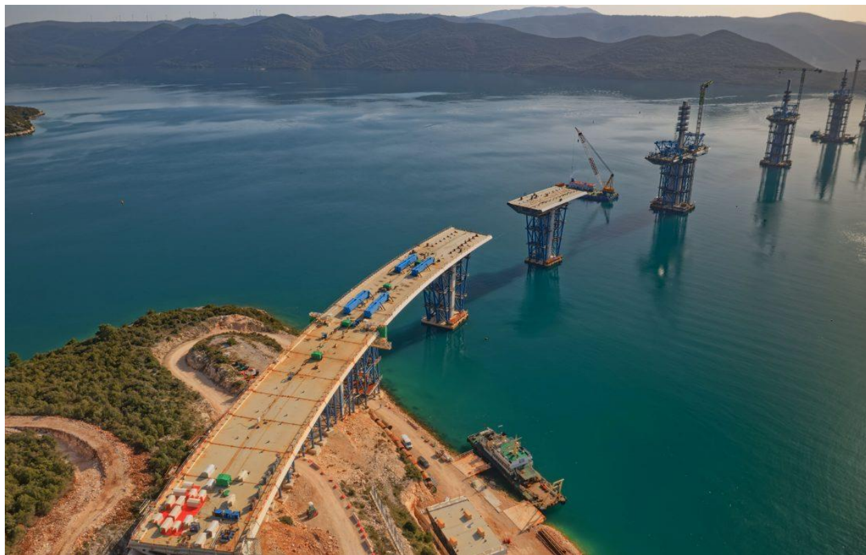
Slika 8: Povezivanje prvog stupa Pelješkog mosta s kopnom

Cilj ovog projekta je ojačati povezanost državnog teritorija na samom jugu Republike Hrvatske izgradnjom mosta Pelješac s pristupnim cestama i cestama na Pelješcu (tzv. stonska obilaznica). 6