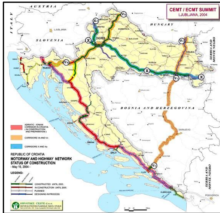
Slika 2. Jadransko – jonska autocesta kroz Hrvatsku