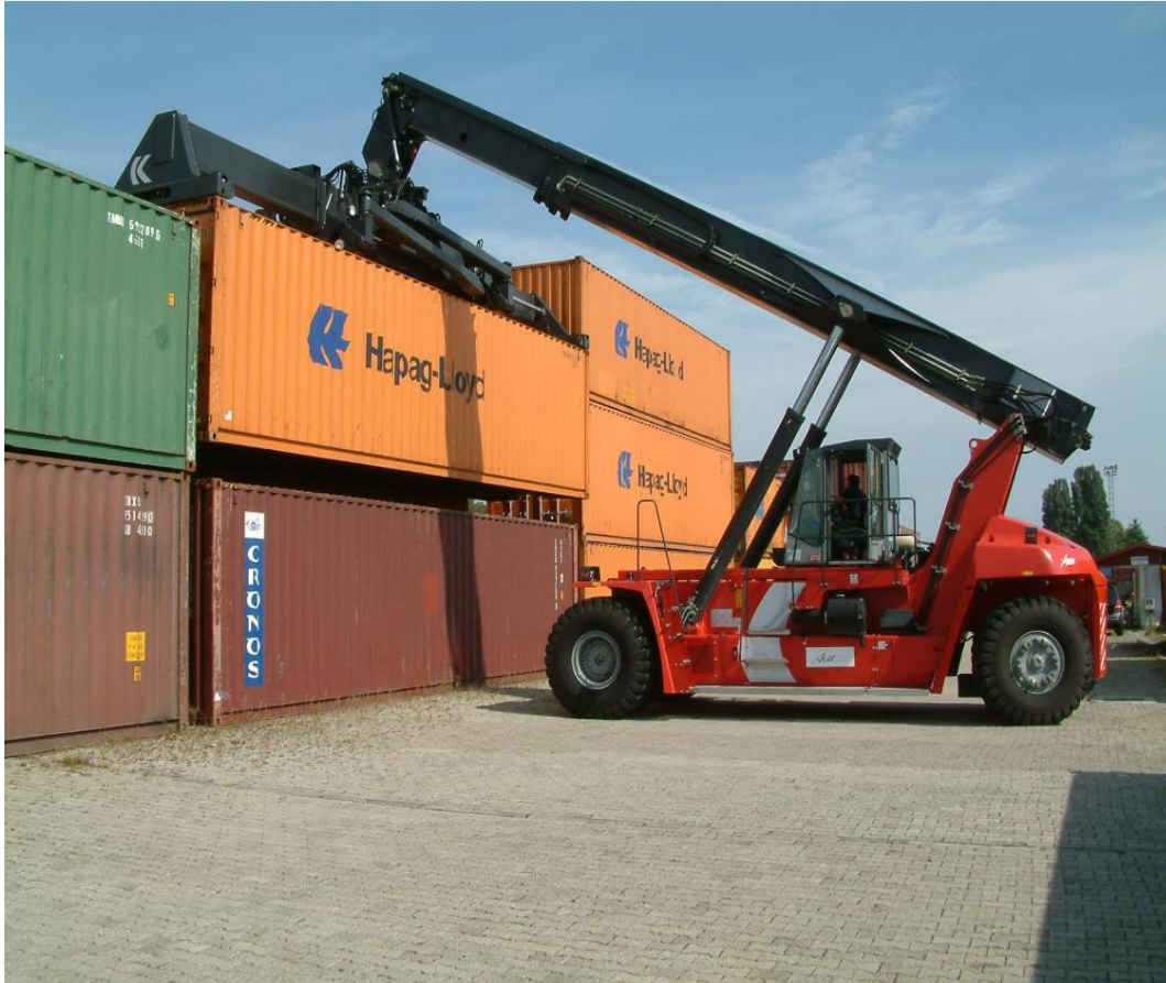
Slika 10. Prijenosni manipulator Kalmar tip Contchamp DRF 400 – C5

40 tona, prijenosnik tip “Beloti B 75” nosivosti također 40 tona i viličar tip “Kalmar DC 13,6” nosivosti 12 tona, viličar Linde nosivosti 8 tona, viličar Linde nosivosti 5 tona te dva viličara Linde nosivosti 3 tone.