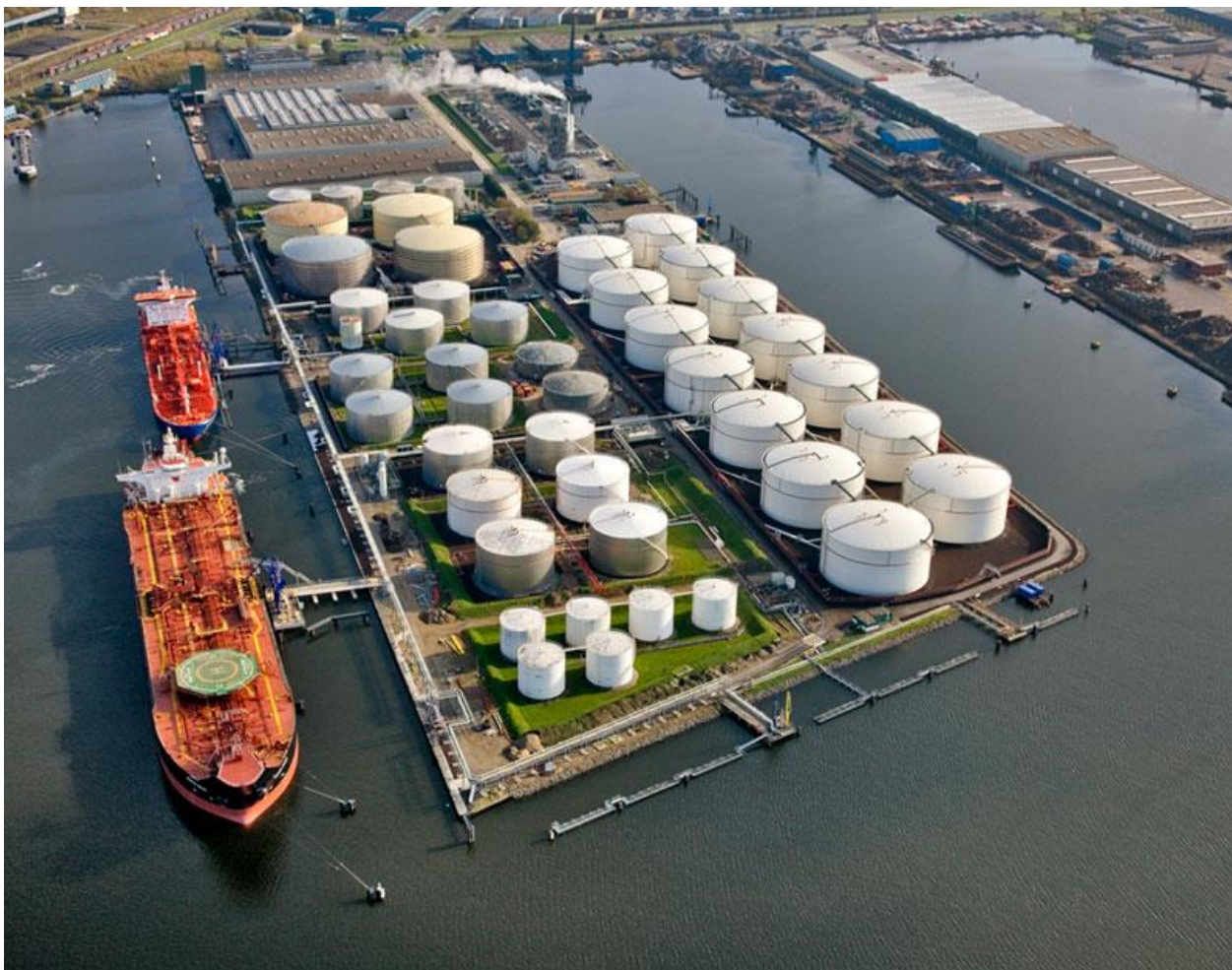
Slika 7. Primjer terminala za tekuće terete