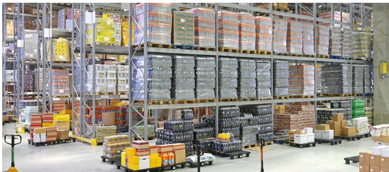
Slika 6. Primjer distribucijskog centra pića

Primjer jednog distribucijskog centra pića, odnosno jednog segmenta s regalima i robom prikazan je na slici 6.