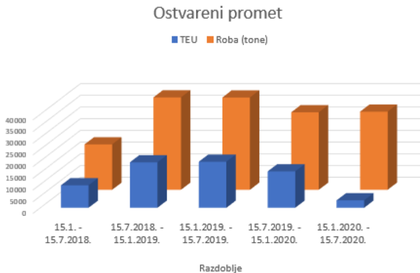
Slika 11. Grafički prikaz ostvarenog prometa KT Vrapče