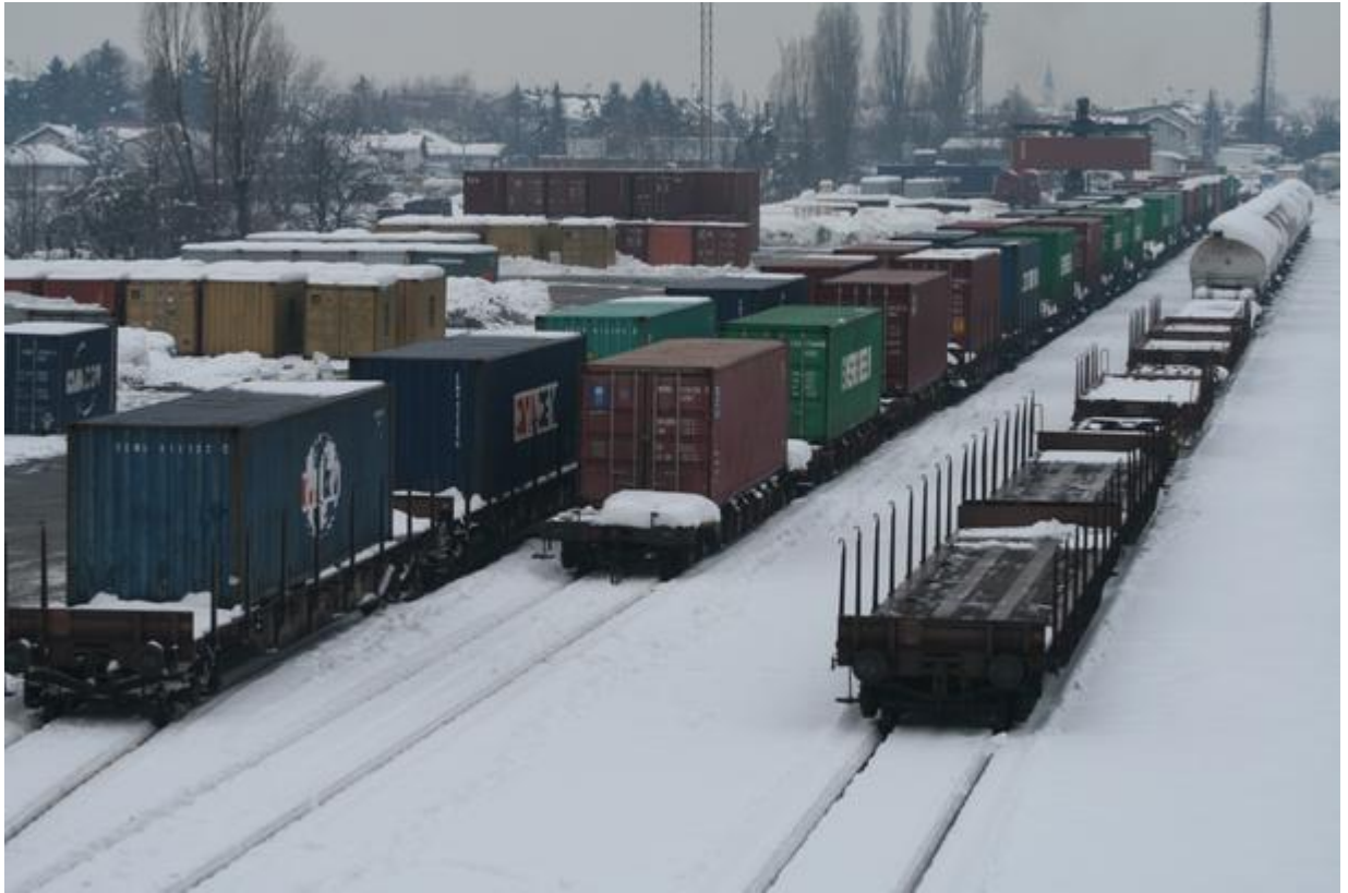
Slika 9. Kontejnerski terminal Vrapče