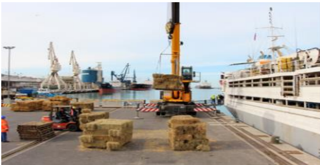
Slika 4. Manipulacije balama sijena u luci Koper