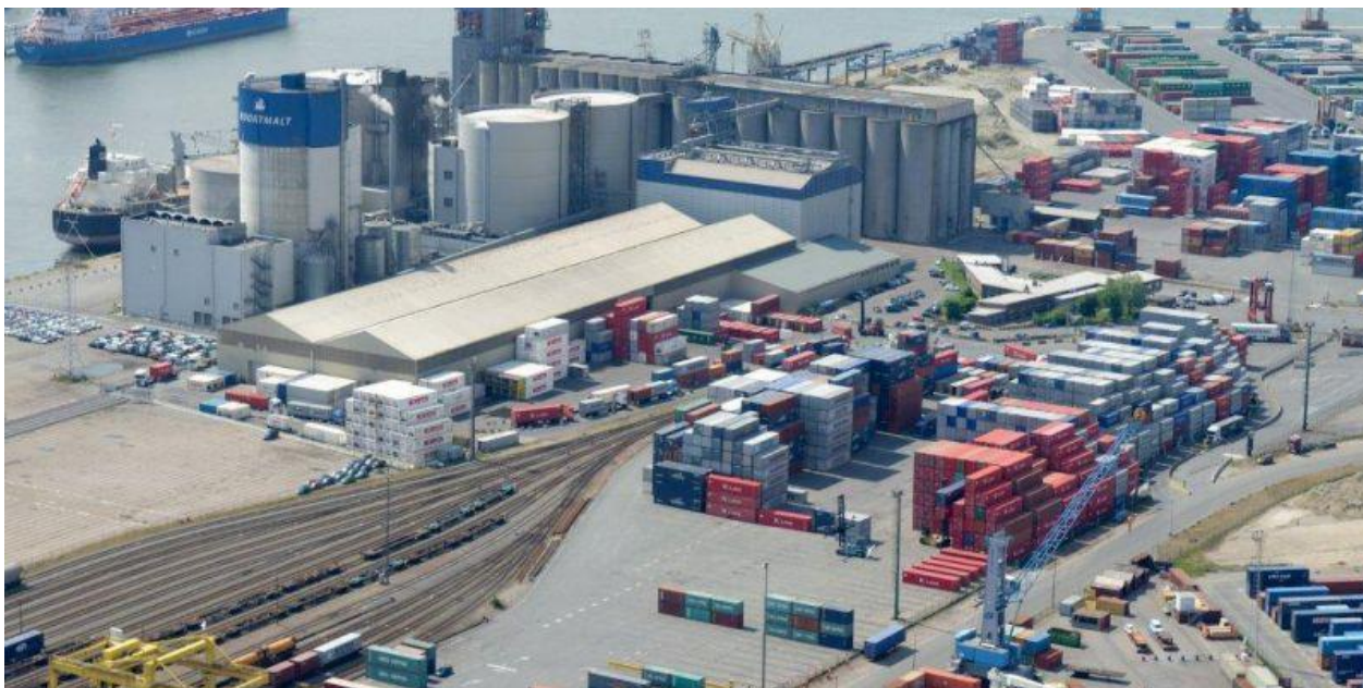
Slika 8. Intermodalni terminal u Antwerpenu, Belgija