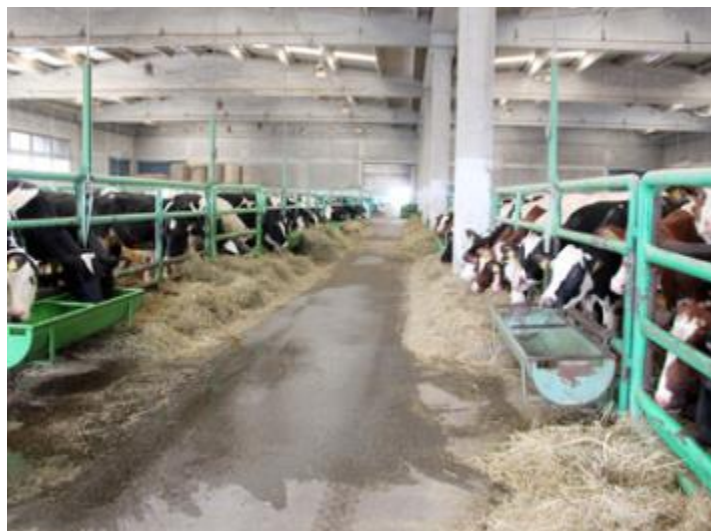
Slika 5. Terminal za žive životinje u luci Koper