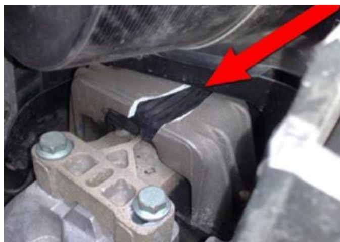
Slika 11. Oštećenje na metalnom nosaču motora (Izvor: [8])

Nosači motora moraju biti neoštećeni i dobro pričvršćeni jer pri djelovanju vibracija može doći do odvajanja motora od oslonca (slika 11). Ne smije biti prevelika zauljenost motora oko brtvi ulja i korita motora jer pri velikom curenju ulja može doći do zapaljenja. Ispušni sustav mora biti neoštećen i dobro spojen i pričvršćen za podnožje vozila. Plinovi iz ispuha ne bi smjeli ulaziti u prozor za putnike. Ako na ispušnom sustavu postoji korozija, vozilo je tehnički neispravno. Kod rashladnog sustava se gleda curenje tekućine koje ne smije biti preveliko. Svaka preinaka na motoru zahtjeva testiranje, ako postoji preinaka na motoru, a ne postoji potvrda o testiranju, takvo vozilo ne može proći tehnički pregled. Također je zabranjeno povećavati snagu motora uz pomoć čipiranja. [8]