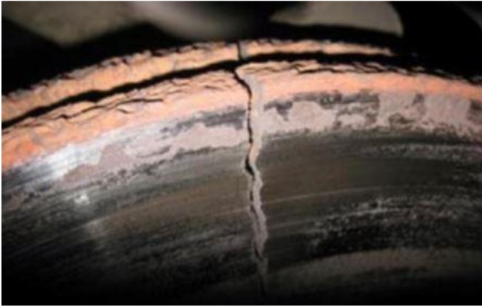
Slika 7. Ispucali kočni disk (Izvor: [8])

Kočne obloge (pakne) ne smiju biti prekomjerno istrošene jer to smanjuje efikasnost kočenja. Kočne poluge ne mogu biti korodirane i deformirane. Velika opasnost kod bubanj kočnica je pojava maziva i ulja jer na taj način se smanjuje trenje između tarnih površina. Kod disk kočnica gleda se izbrazdanost diskova, njihova ispucanost i potrošenost (slika 7). [8]