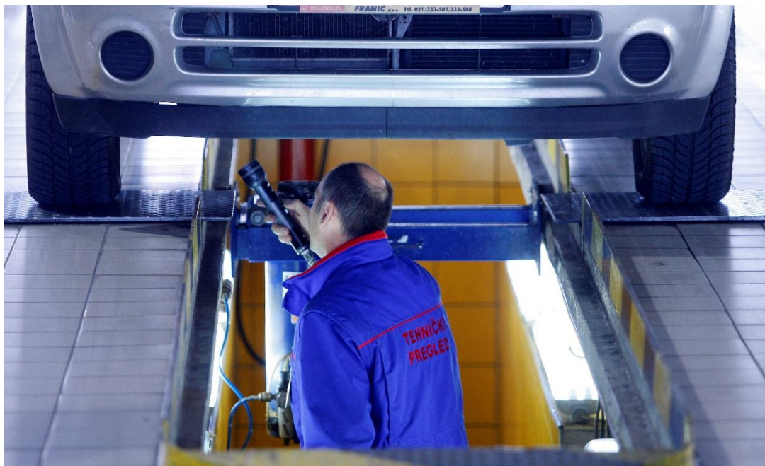
Slika 2. Nadzornik vrši pregled vozila na kanalu

Nakon utvrđivanja stanja ispušnih plinova, kreće se s pregledom zadnje osovine na način da nadzornik upotrebom snage ruku provjerava da li postoji zračnost u elementima koji čine stražnju osovinu.