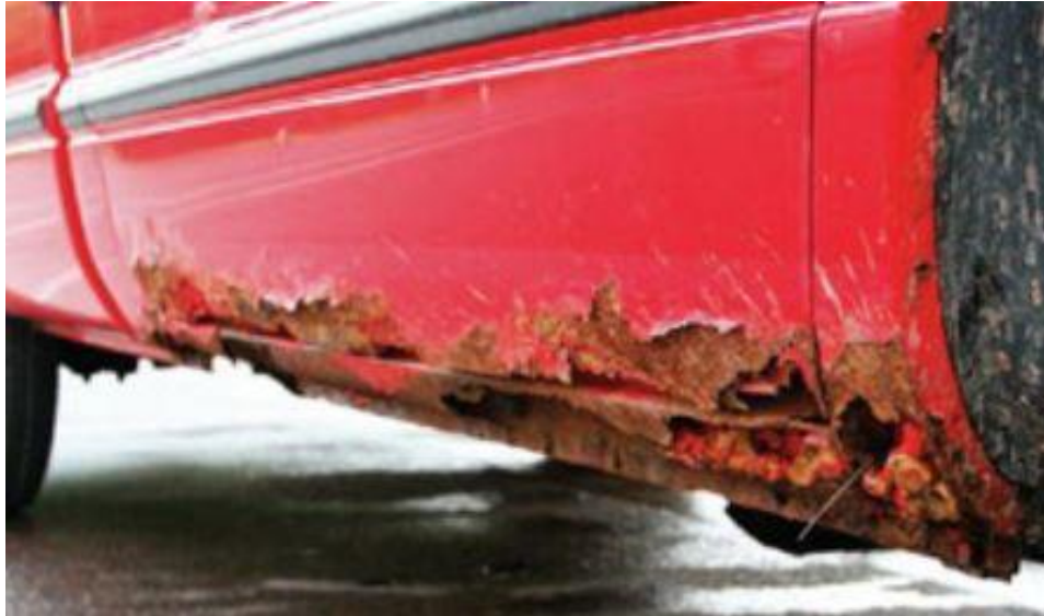
Slika 9. Korozija na pragovima vozila