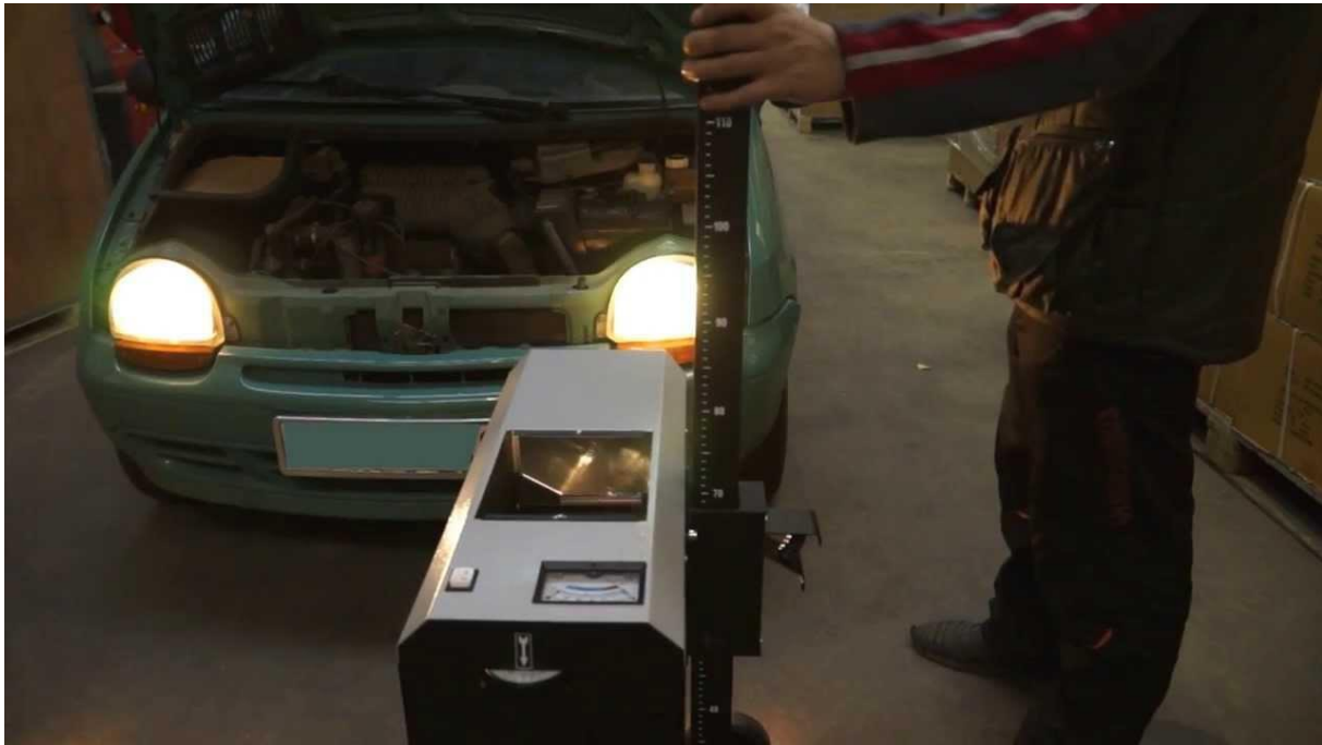
Slika 4. Kontrola jačine svjetlosnog snopa uz pomoć regloskopa

kratka, duga i svjetla za maglu, pod uvjetom da je vozilo neopterećeno i uređaj za podešavanje visine svjetala u vozilu podešen na nulu.[6]