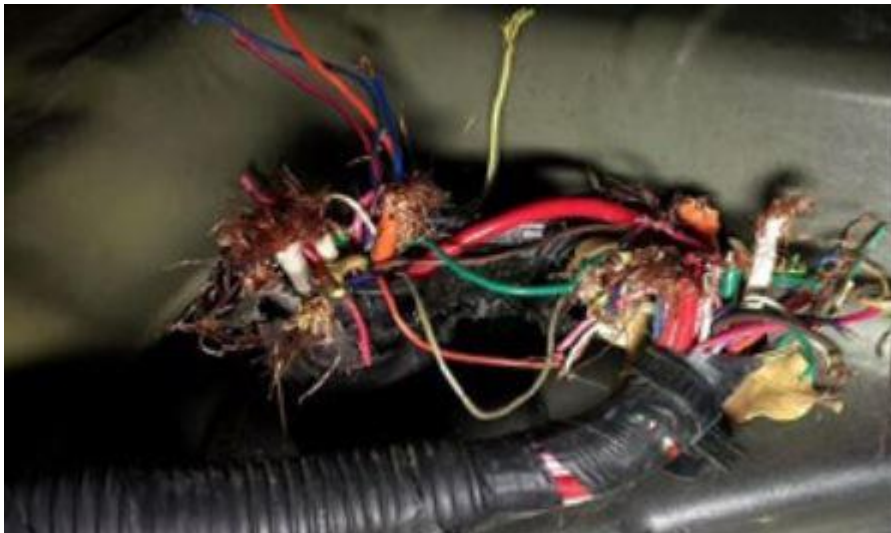
Slika 12. Oštećeni i neizolirani električni vodovi (Izvor: [8])

Provjerava se da li je akumulator dovoljno dobro pričvršćen, tolerira se malo pomicanje, ako je previše labav i postoji mogućnost da se odvoji od motornog prostora je veliki nedostatak. Električni vodovi mogu biti loše izolirani, ali sve dok ne postoji opasnost od kratkog spoja, stoga ne smije biti vodova koji nisu izolirani jer u protivnom može doći do požara (slika 12). Kablovi od sustava kočenja ili upravljanja (ABS ili ESP) ne smiju biti oštećeni ili prekinuti. [8]