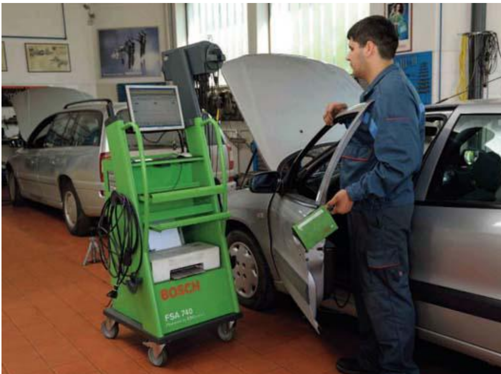
Slika 15. Dijagnostički uređaj

Računalna dijagnostika u automobilskoj industriji je čin povezivanja posebnog dijagnostičkog računala (također poznatog kao dijagnostički tester) na računalo u vozilu. Ova usluga omogućuje da se sazna u kakvom se stanju trenutno nalazi automobil, da li parametri odstupaju od željenih, da li ima i gdje su pogreške točno, kao i njihovi uzroci. Dijagnostika se radi tako da se uređaj za dijagnostiku (poznat kao dijagnostički tester) spaja na računalo od vozila (slika 15). Ova usluga omogućuje provjeru ukupnog tehničkog stanja vozila, uključujući usporedbu parametara vozila s idealnim parametrima. S tim usporedbama vrlo se lako otkriju kvarovi na auu, te se mogu brzo ukloniti. Neupitna prednost računalne dijagnostike je da se na automobilima brzo prepoznaju tehnička stanja pojedinačnih sustava i sklopova, bez potrebe za rastavljanjem i ometanjem bilo koje komponente. Sve što treba je tehnički i mjerni aparat u obliku dijagnostičkog računala. Potrebna je samo ispravna veza, tako da se podaci mogu razmjenjivati kako bi se usporedile vrijednosti trenutnih parametara statusa automobila s vrijednostima parametara koje je odredio njegov proizvođač. [15]