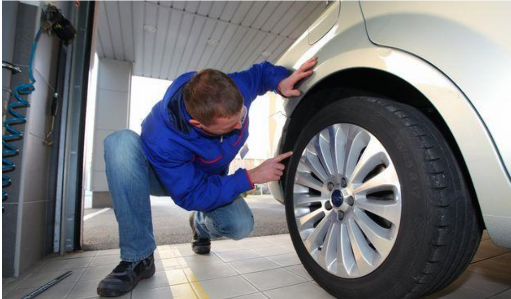
Slika 10. Pregled kotača i pneumatika