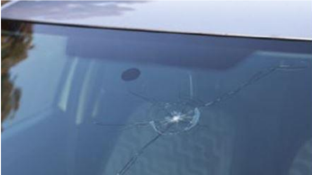
Slika 8. Napuknuto vjetrobransko staklo unutar prostora zahvata brisača

slabo otklanjanju sadržaj sa vjetrobranskog stakla te je dovoljan razlog za ne prolazak tehničkog pregleda. Perači stakla moraju raditi. Retrovizori koji su oštećeni i kod kojih postoji mogućnost otpadanja zbog loše pričvršćenosti zrcala ili držača zrcala, postoji mogućnost otpadanja ili dolazi do vibracija zrcala da je slika nejasna, predstavljaju sigurnosnu ugrozu jer vozač nema uvid u promet iza sebe. [8]