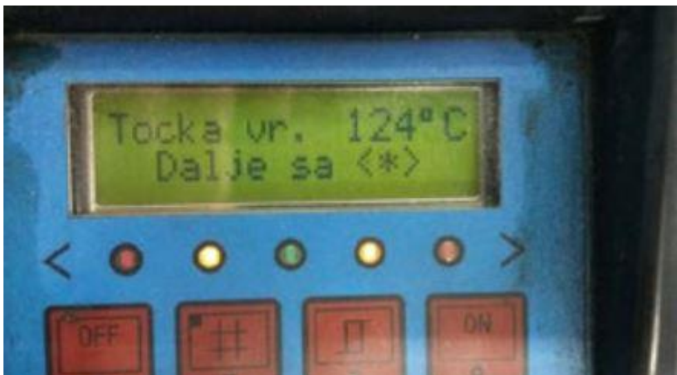
Slika 3. Uređaj za kontrolu temperature kočne tekućine

Iznimno mala količina tekućine u sustavu, izazvana istjecanjem ili puknućem kočionih crijeva, smanjuje ili sasvim eliminira mogućnost zaustavljanja automobila (mekana pedala kočnice). Zato je vrlo važna provjera njezine razine (spremnik se nalazi ispod maske, razina tekućine mora se kretati između „min.“ i „max.“), kao i provjera, da ne bi došlo do istjecanja iz elastičnih kočionih crijeva. Kočiona tekućina ima svoje mane – stari i upija vodu. Tekućina gubi antikorozivna svojstva, što izaziva hrđu klipova u kočionim čeljustima, kao i u drugim važnim dijelovima sustava. Kočiona tekućina upija vodu kroz gumene (elastične) krajeve kočionih crijeva (kod kotača). Tekućina koja sadrži do 1 % vode ima još vrlo dobra svojstva, a temperatura njenog vrenja prelazi 185 °C (suvremene tekućine danas izdrže čak i do 230 °C). Sadržaj vode do 2 % smanjuje temperaturu vrenja za oko 20%, što značajno smanjuje sposobnost kočenja. Sadržaj vode iznad 3 % volumena vode je znak za trenutačnu promjenu.[7]