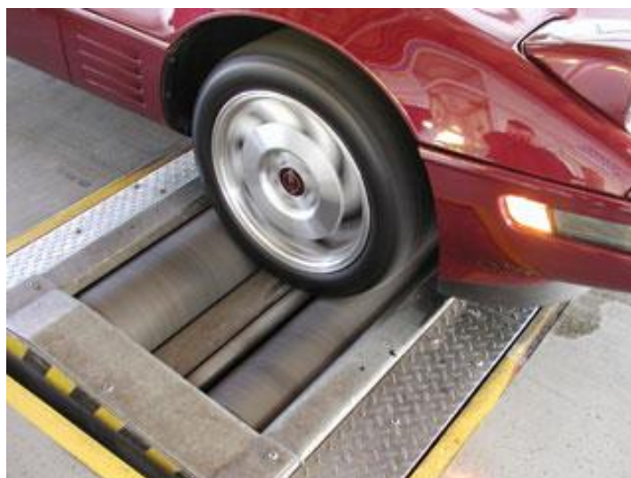
Slika 1. Valjci za ispitivanje kočne sile (Izvor: [6])

Prilikom kontrole kočnica nadzornik se vozilom navozi na uređaj za ispitivanje kočnica vozila te ispituje kočionu silu na prednjoj i zadnjoj osovini, te kočionu silu pomoćne (mehaničke) kočnice (slika 1). Ukupni koeficijent sile kočenja radne kočnice za osobna vozila prvi puta registrirana prije 1. siječnja 2012. ne smije biti manji od 50 %, odnosno 58 % za osobna vozila prvi puta registrirana nakon 1. siječnja 2012. godine. Ukupni koeficijent sile pomoćne kočnice za osobna vozila ne smije biti manji od 16 %. Razlika sile kočenja za radnu kočnicu na kotačima iste osovine ne smije biti veća od 25 %, a za pomoćnu kočnicu 30 %. Nejednolikost sile kočenja na jednom kotaču ne smije biti veća od 20 %. Postotak nejednolikosti sile kočenja izračunava se približno na polovici sile kočenja koja izaziva blokadu, a za osnovicu izračunavanja se uzima veća sila kočenja. Sva odstupanja od ovih zakonskih normi značilo bi ne samo pad na tehničkom pregledu nego i opasnost na cesti iz razloga što bi se vrlo vjerojatno prilikom naglog kočenja vozilo zanjelo, pa čak i prevrnulo.[6]