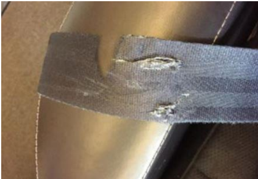
Slika 13. Oštećen sigurnosni pojas

Što se tiče dodatne opreme, rezervni kotač ne smije biti oštećen ili nedostajati. Ako ne postoji rezervni kotač, onda vozilo mora sadržavati opremu koja zamjenjuje rezervni kotač za vozila sa run-flat pneumaticima. Sigurnosni trokut mora biti neoštećen i mora se u slučaju nezgode moći postaviti u uspravni položaj. [8]