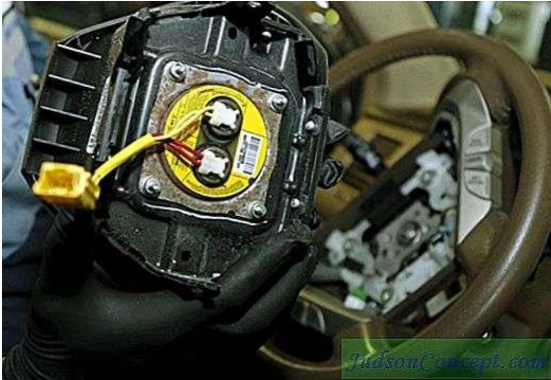
Slika 14. Mehanička provjera zračnog jastuka

napuhuje i na njemu ne bi trebale biti nikakve pukotine. Treba pogledati plinski generator, na njemu ne bi trebalo biti oštećenja, a u spremniku bi trebalo biti gorivo za aktivaciju. Ako su konektori sustava pokidani i u lošem stanju, sustav koji aktivira sigurnosne zračne jastuke možda neće raditi. [10]