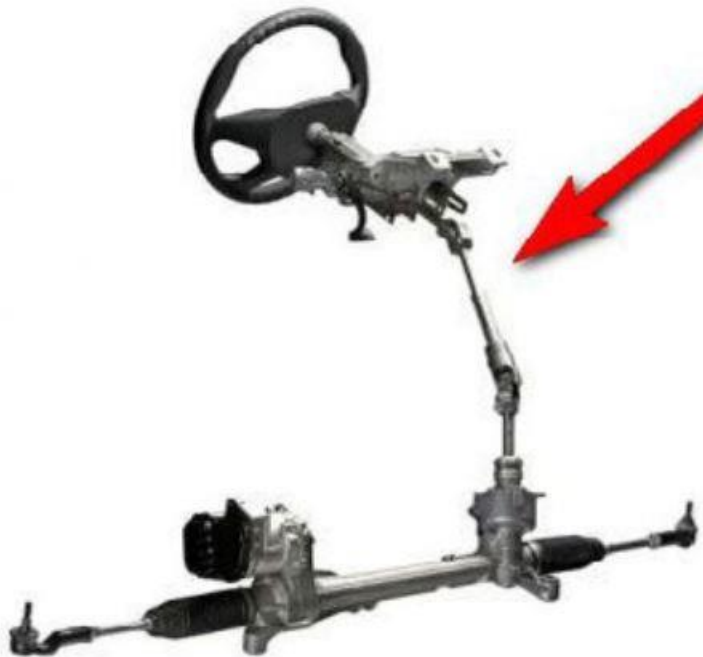
Slika 6. Preinaka na upravljačkom mehanizmu