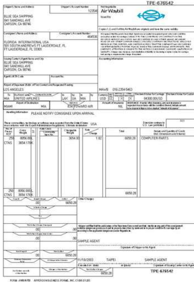
Slika 13 Airway bill