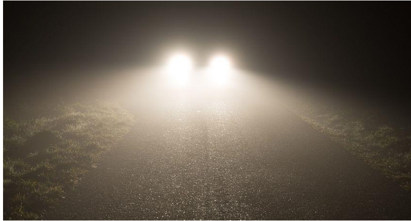
Slika 5. Bljesak automobila iz suprotnog smjera