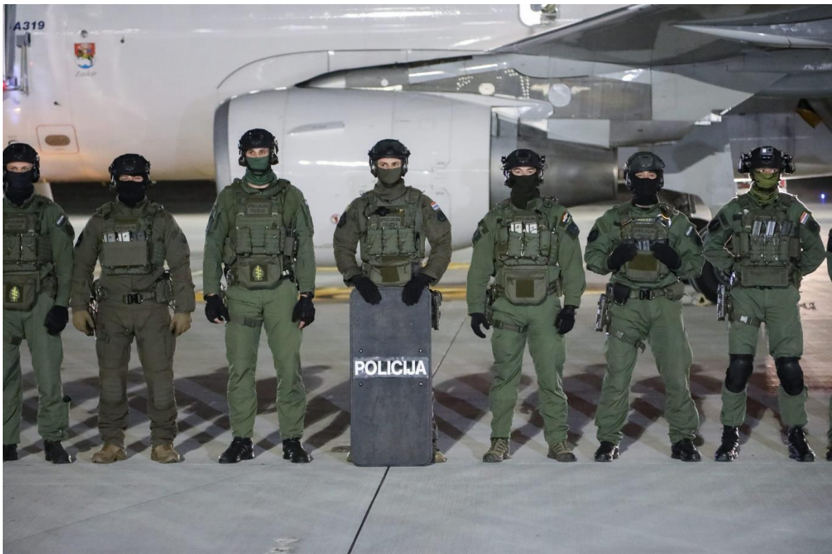
Slika 6. Vježba ATJ Lučko na zračnoj luci u Dubrovniku

Antiteroristička jedinica Lučko, čiji su pripadnici prikazani na slici 6, se prema Zakonu o specijalnoj policiji definira kako slijedi: „ Antiteroristička jedinica Lučko djeluje na cijelom području Republike Hrvatske, a nadležna je za: suzbijanje terorizma, rješavanje najsloženijih otmica i talačkih situacija, otmice zrakoplova i drugih prijevoznih sredstava, posebna osiguranja visokih državnih dužnosnika, suzbijanje najtežih oblika kriminaliteta, uhićenje počinitelja najtežih kaznenih djela, zaštitu određenih osoba, helikopterske operacije, zadaće potraga i spašavanja, snajperske operacije, pronalaženje, deaktiviranje i uništavanje formacijskih i improviziranih eksplozivnih naprava na zemlji i pod vodom, ronilačke intervencije te obavlja i druge poslove sukladno Zakonu o policiji. “ 71