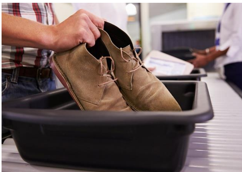
Slika 5. Skeniranje obuće u zračnoj luci

U budućnosti se od putnika neće zahtijevati skidanje obuće radi pregleda, proces je prikazan na slici 5, već će u zaštitni sustav zračnih luka implementirati skenere za obuću. Primjerice, kompanija Stage Gate 11 B.V. koja se isključivo bavi proizvodnjom strojeva za zaštitno skeniranje za potrebe zračnih luka osmislila je stroj Delta R Shoe Scanner koji otkriva tragove zabranjenih materijala na obući i posebno je dizajniran za zaštitne operacije u zračnim lukama i nereguliranim sigurnosno osjetljivim prostorima. 66