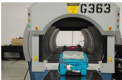
Slika 4. Uređaj za otkrivanje eksplozivnih naprava u prtljazi