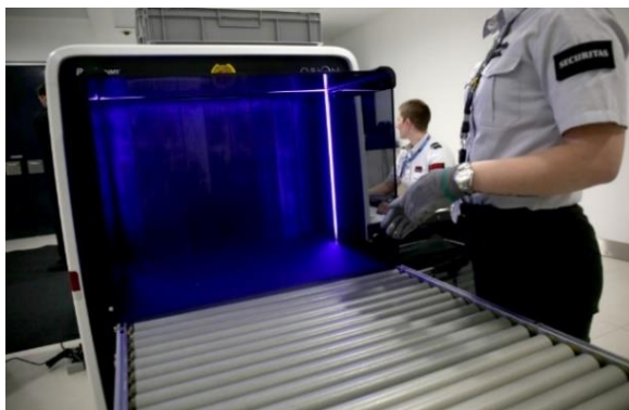
Slika 7. Zaštitarska služba skenira prtljagu na zračnoj luci

Zaštitarske službe na zračnim lukama u Republici Hrvatskoj zadužene su za skeniranje putnika i prtljage, prilikom čega koriste moderne detektore metala (ručne i postavljene), rendgenske uređaje te uređaje za otkrivanje tragova eksploziva. Jedan od uređaja za skeniranje prikazan je na slici broj 7.