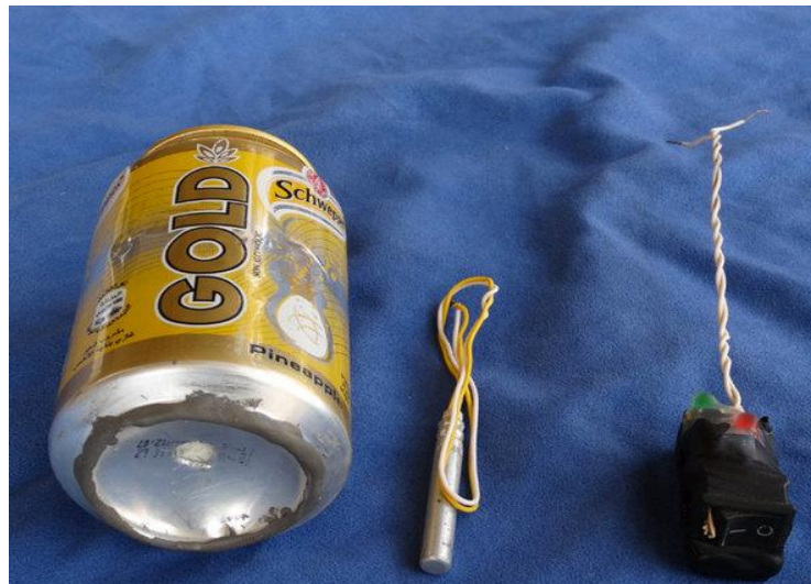
Slika 2. Improvizirana eksplozivna naprava koja je srušila let 9268

31. listopada 2015. godine u 06:13 po lokalnom vremenu EST (04:13 UTC), zrakoplov Airbus A321-231 uništen je eksplozivnom napravom, koja je prikazana na slici 2, iznad sjevernog Sinaja nakon njegovog polaska s međunarodne zračne luke Sharm El Sheikh u Egiptu na putu do zračne luke Pulkovo, Sankt Peterburg u Rusiji. 24