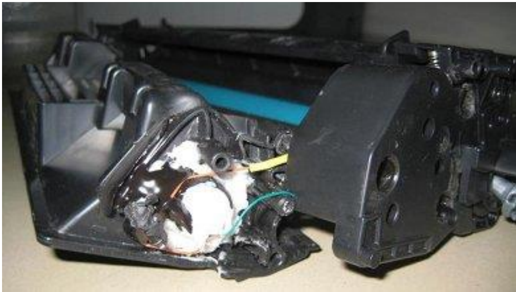
Slika 3. Eksplozivna naprava u printeru pronađenom na jednom od zrakoplova

Svaki paket sadržavao je Hewlett-Packard HP LaserJet P2055 stolni laserski pisač. 40 Unutar svakog tonera bila je sofisticirana bomba, prikazana na slici 3. Spremnici su bili napunjeni pentaeritritol tetranitratom (PETN), plastičnim eksplozivom bijelog praha bez mirisa. Bomba pronađena u Velikoj Britaniji sadržavala je 400 grama PETN-a, što je pet puta više od količine potrebne za uništavanje kuće. Eksplozivna naprava koja je pronađena u Dubaiju sadržavala je 300 grama PETN-a. Hans Michels, profesor sigurnosnog inženjerstva na University College London, rekao je da bi samo 6 grama PETN-a, oko 2% gramaže koja je pronađena u pisaču, bilo dovoljno da se probuši rupa u trupu zrakoplova. 41 Paket u Dubaiju isporučen je u kartonskoj kutiji koja je sadržavala suvenire, odjeću, kompaktne diskove i nekoliko knjiga napisanih na engleskom jeziku. 42 Obje eksplozivne naprave pokrenuo bi alarm mobitela, koji bi aktivirao telefonsku bateriju da pošalje struju kroz tanku žičanu žarulju unutar šprice koja sadrži 5 grama olovnog azida, snažnog kemijskog inicijatora. Kada bi se zagrijao, olovni azid bi se zapalio, uzrokujući detonaciju PETN-a. 43 Struktura unutar uređaja postavljena je tako da se čini da su sve komponente pisača ispravne ukoliko paket bude prolazio kroz rendgen. Značajke koje nisu relevantne za funkciju vremenskog odaziva alarma, kao što je zaslon, uklonjene su kako bi produljile vijek trajanja baterije. 44