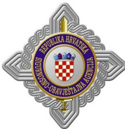
Slika 8. Logo Sigurnosno-obavještajne agencije