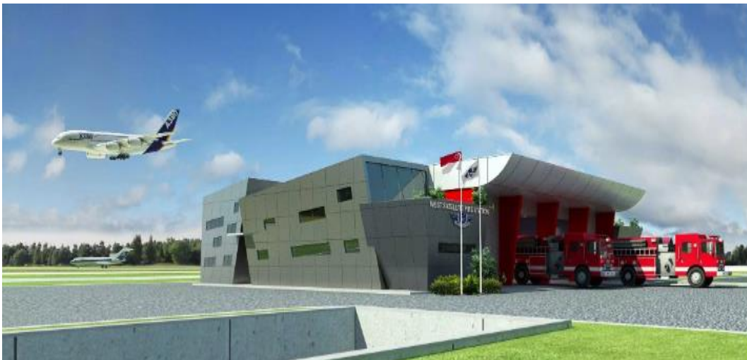
Slika 2. Satelitska vatrogasna postaje na zračnoj luci, [11]

Kako bi se postigla brza intervencija potrebna je usklađena komunikacija i koordinacija između odgovornih organizacija, te uvježbano, obučeno i zaštićeno osoblje koje mora biti pripremljeno za sve vrste izvanrednih događaja na zračnoj luci. Izvanredni događaj zahtijeva brzu intervenciju od svega par minuta, no ne mogu sve zračne luke osigurati intervenciju od vatrogasne postrojbe do mjesta nesreće u tako kratkom roku. Na takvim zračnim lukama potrebno napraviti satelitsku postaju od kuda bi se vatrogasna vozila upućivala na mjesto nesreće [5]. Na slici 2 se nalazi primjer satelitske vatrogasne postaje na zračnoj luci.