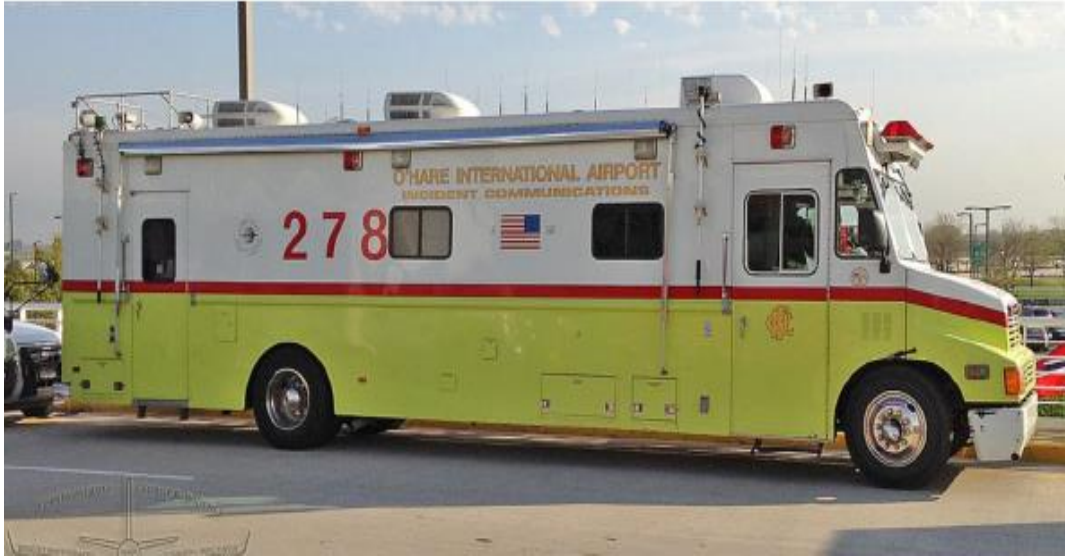
Slika 5. Mobilno zapovjedno mjesto, [5]

S obzirom da zapovjedno mjesto ima ključnu ulogu u slučaju bilo kakvog izvanrednog događaja, u svakome trenutku mora biti prepoznatljivo i lako vidljivo uz pomoć raznih oznaka (npr. zastavice, rotacijsko svjetlo i sl.), te bi ga trebalo uspostaviti u isto vrijeme kada započinje gašenje požara i spašavanje, na sigurnoj udaljenosti izvan kritične zone [12].