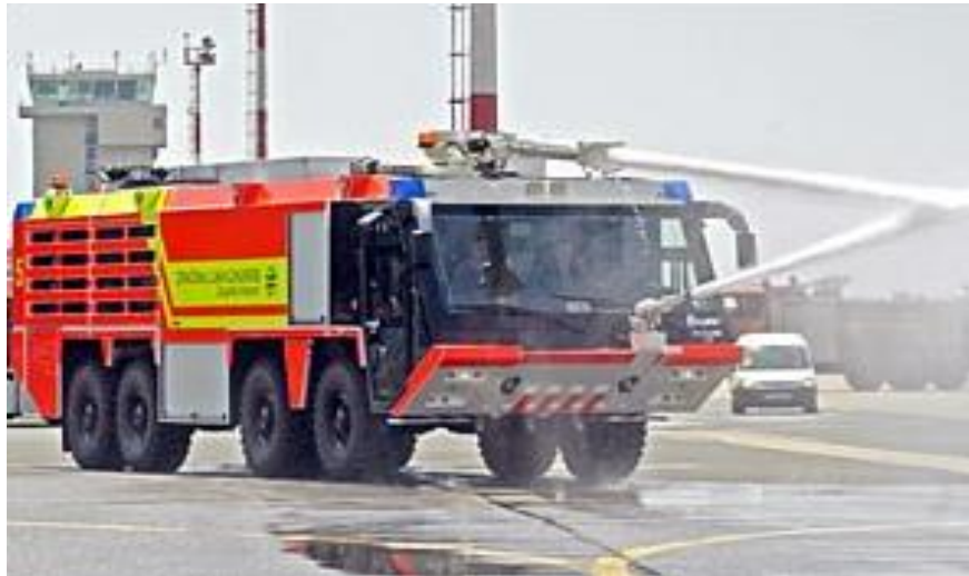
Slika 1. Aerodromsko vatrogasno vozilo, [9]

Iz tablice 3 vidljivo je na primjeru visokotlačne cijevi da je ona u obaveznoj upotrebi i za vozila kapaciteta do 4500 l i za vozila kapaciteta preko 4500 l, dok je za raspršivač ispod vozila preporuka za vozilo kapaciteta do 4500 l, a obavezna upotreba kod vozila kapaciteta preko 4500 l. Na slici 1 nalazi se primjer aerodromskog vatrogasnog vozila.