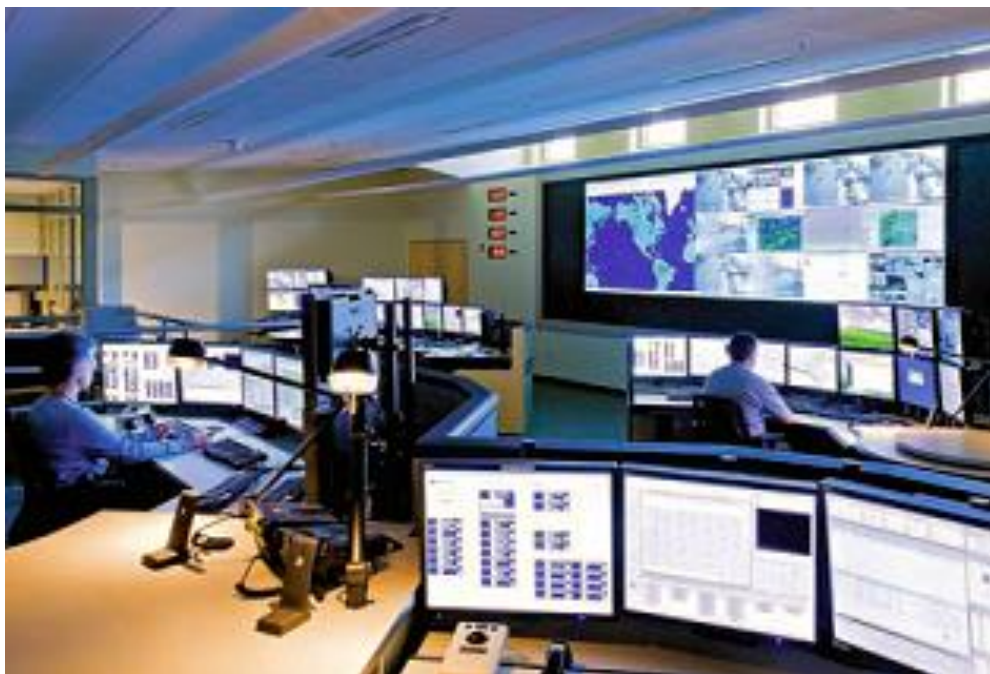
Slika 4. Operativni centar, [14]