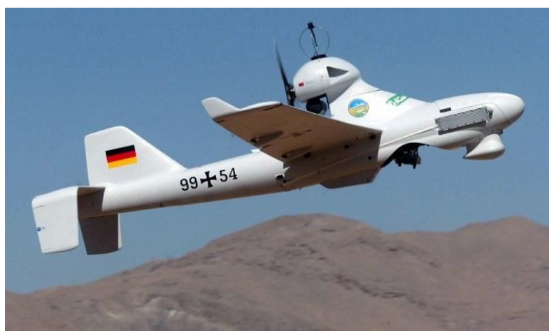
Slika 13. Bespilotna letjelica LUNA