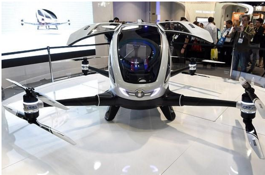
Slika 5. Prikaz taksi-drona, model EHang 184