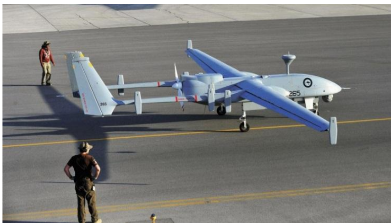
Slika 14. Bepilotna letjelica Heron 1