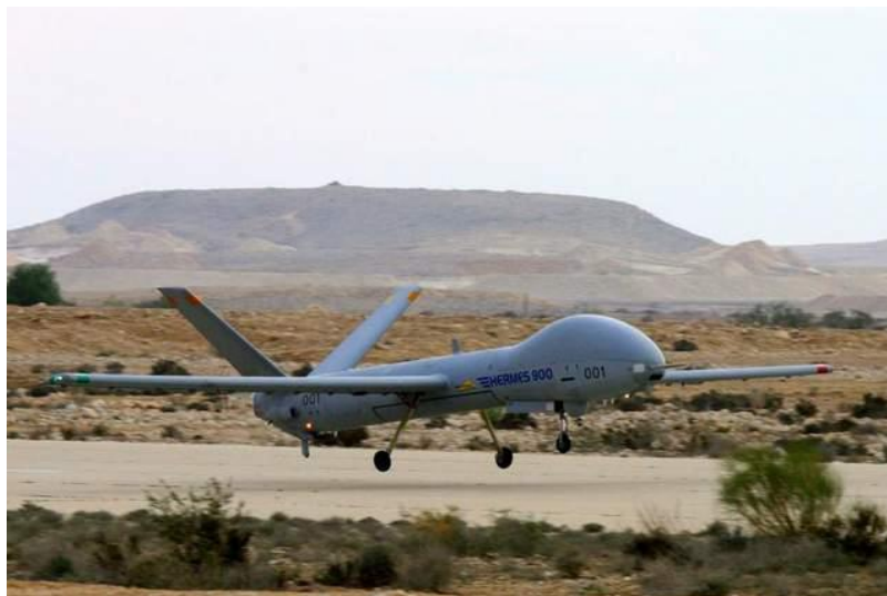
Slika 17. Bepilotna letjelica Hermes 900 HFE