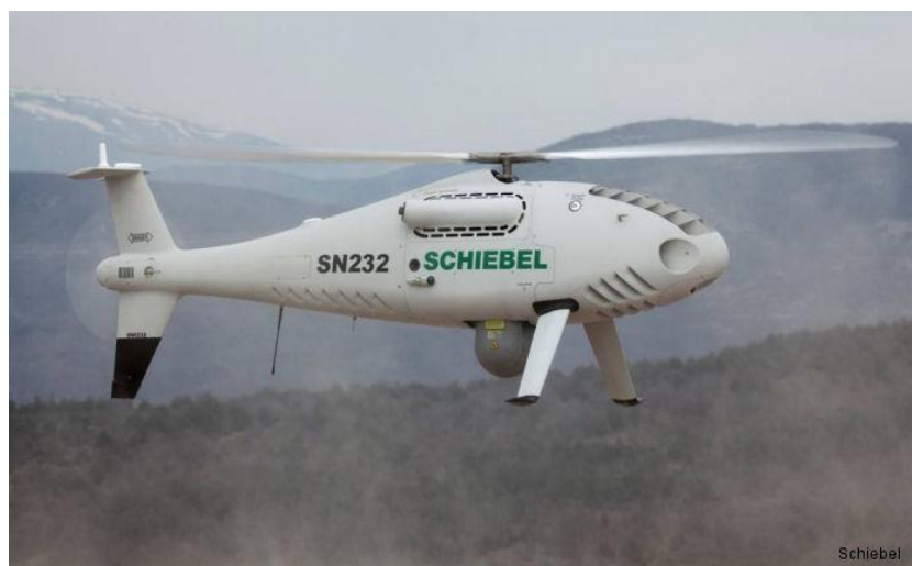
Slika 10. Bepilotna letjelica Camcopter S-100