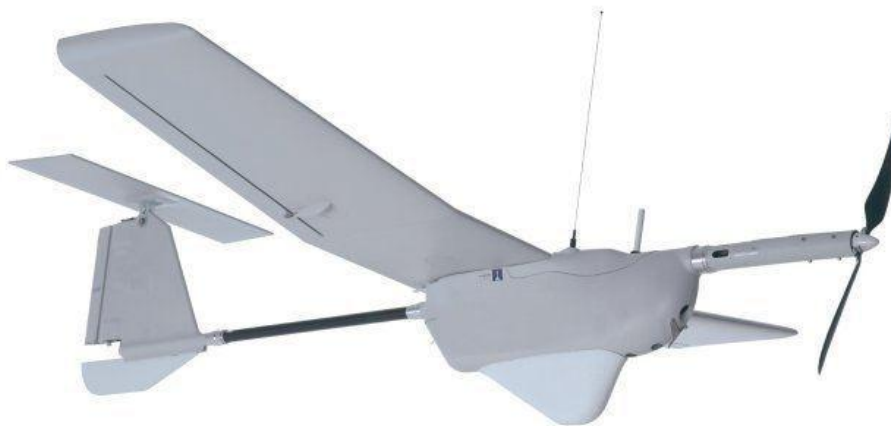
Slika 11. Bespilotna letjelica ALADIN

U 2015. godini, u budžet je dodano 323 milijuna € s ciljem nabave novih dronova s naoružanjem što je pokrenulo pitanja regulatorne i međunarodne zakonske prirode. 82