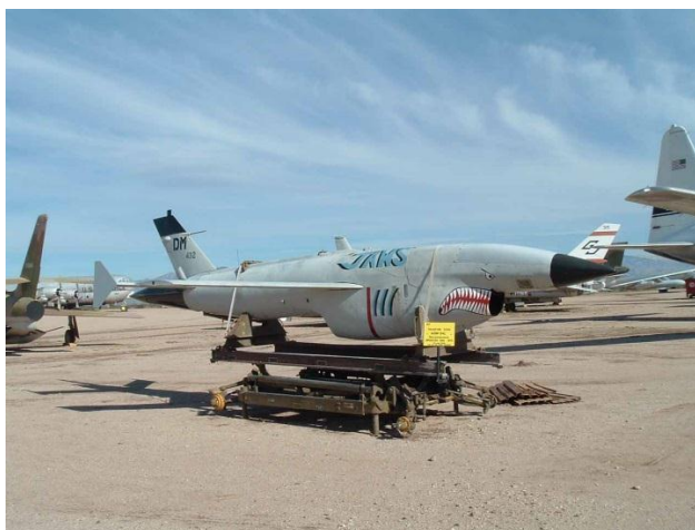
Slika 3. Bepilotna letjelica AQM-34

su dnevno i noćno nadziranje, misije u kojima je ispuštana vojna propaganda i detekciju raketnih radara na površinama Sjevernog Vijetnama i jugoistočne Kine. 5