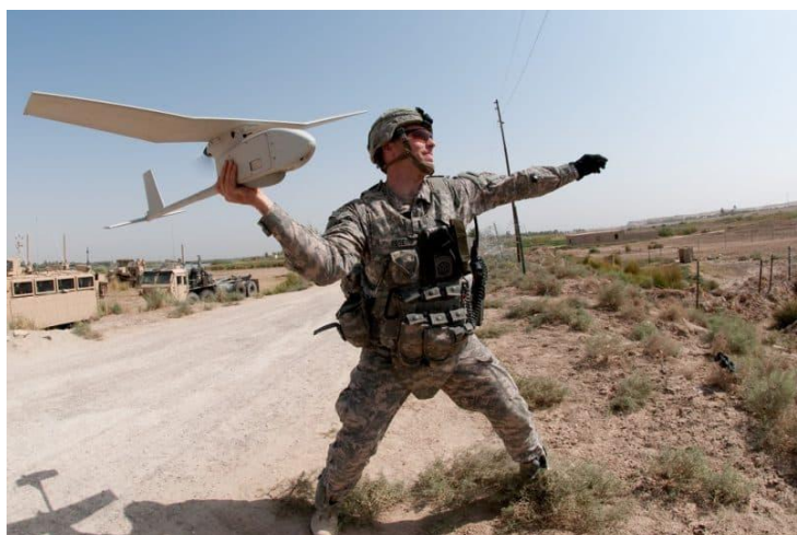
Slika 6. Bepilotna letjelica FULMAR