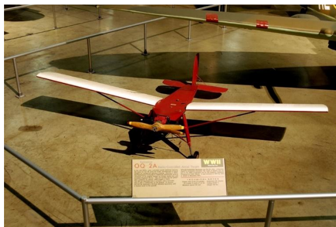
Slika 4. Bepilotna letjelica OQ-2A

Sredinom 30-ih godina prošlog stoljeća, radio-kontrolirani modelni zrakoplovi postali su osnova za razvoj zrakoplovnih snaga vojnog zrakoplovnog korpusa. Od 1935. godine tvrtka Radioplane u Kaliforniji razvila je nekoliko varijacija izvornog dizajna bivše filmske zvijezde i modelara Reginalda Dennyja. Bepilotna letjelica OQ-2A (Slika 4.) je bila lansirana putem katapulte i spuštana na zemlju pomoću padobrana promjera 7,32 m (24 ft). Konvencionalno podvozje bepilotne letjelice je služilo za ublažavanje učinka slijetanja. Nakon lansiranja letjelica je upravljana od strane pilota sa zemlje korištenjem tzv. "beep" 6 kutije. 7