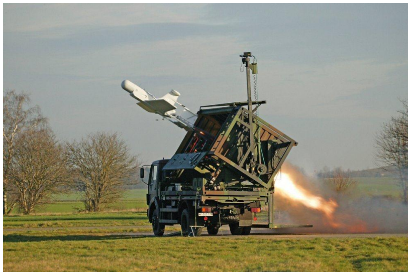
Slika 12. Bespilotna letjelica KZO s lansirnom rampom