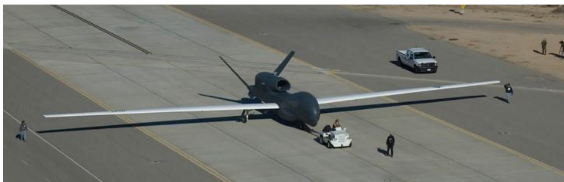
Slika 9. Bespilotna letjelica Global Hawk