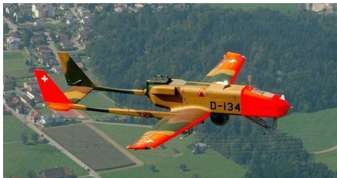
Slika 15. Bepilotna letjelica ADS 95 Ranger

Ltd. izraelskog podrijetla. Naime, iako je Elbit privatno poduzeće, nastalo je pitanje da li investicija u izraelsku vojnu industriju kontrira ili interferira s unutarnjim političkim poslovima, odnosno da li narušava švicarsku politiku aktivne političke neutralnosti. 99