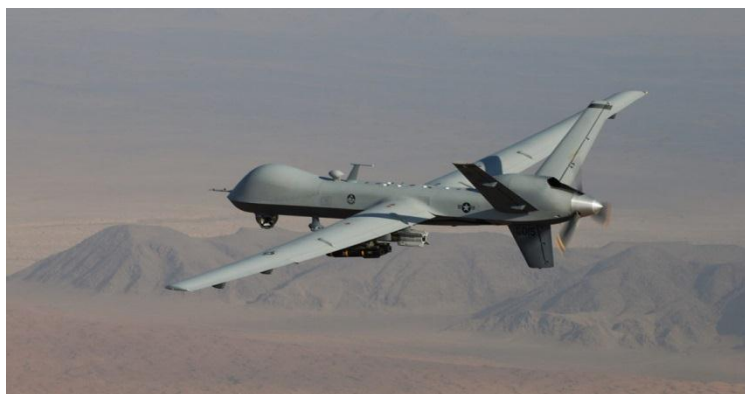
Slika 8. Bespilotna letjelica Reaper