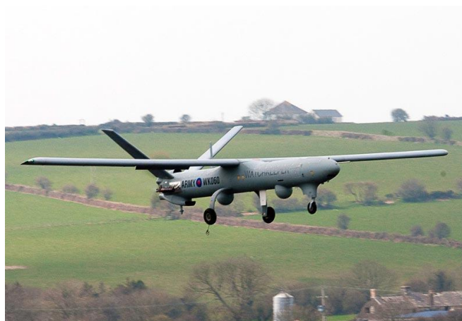
Slika 7. Bepilotna letjelica Watchkeeper WK450