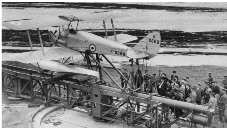
Slika 2. Bespilotna letjelica DH82B Queen Bee na lansirnoj rampi

Veliki napredak bespilotnih letjelica je postignut tijekom Prvog svjetskog rata. Raniji modeli lansirani su pomoću katapultu ili su letjeli pomoću radio kontrole. U siječnju 1918. godine američka vojska započela je proizvodnju zračnih torpeda. Model koji je razvijen, "Kettering Bug", uspješno je letio u nekim testovima, ali rat je završio prije nego što se model uspio dalje razviti. Tijekom međuratnog razdoblja nastavljen je razvoj i ispitivanje bespilotnih letjelica. Godine 1935. Britanci su proizveli niz radio-kontroliranih zrakoplova koji su se koristili u svrhu obuke. Pretpostavlja se da se pojam drona počeo upotrebljavati u tom trenutku, inspiriran imenom jednog od tih modela, DH82B Queen Bee (Slika 2.). Radio-kontrolirani dronovi također su proizvedeni u Sjedinjenim Američkim Državama i koristili su se za vježbe gađanja i obuku. 2