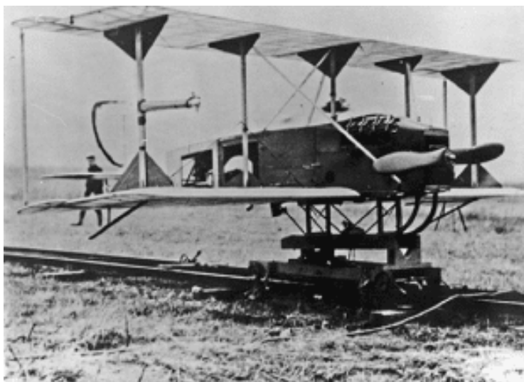
Slika 1. Bespilotna letjelica Voisin BN3

Ideja o bespilotnom letu rođena je tijekom Prvog svjetskog rata kada su SAD i Francuska radile na razvoju automatskog aviona. Na kraju, Francuska je bila ona koja je zapravo uspjela sastaviti takav uređaj. Uređaj se zvao Voisin BN3 (Slika 1.), bio je dvokrilac i mogao je letjeti oko 100 km. 1