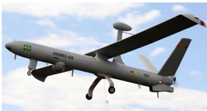
Slika 18. Bespilotna letjelica Hermes 450

Važnost bespilotnih letjelica u vojnim aktivnostima povećava se iz razloga što se povećava njihova mogućnost uporabe bez ugrožavanja osoblja. RAF 109 je, od svibnja 2015. godine, počeo u svoje misije uključivati dron tipa Reaper u Afganistanu. Isti taj tip bespilotne letjelice je korišten i u Iraku. Ministar obrane je objavio da će te iste bespilotne letjelice biti korištene i u Siriji. Kao i naoružani, tako i nadzorni dronovi obavljaju veliki broj misija, a kao istaknuti primjer može se navesti dron tipa Watchkeeper. Ostale bespilotne letjelice koje koristi RAF su Desert Hawk, Hermes 450 (Slika 18.), Black Hornet i T-Hawk.