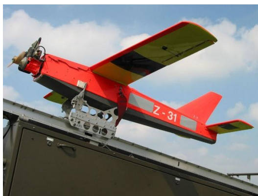
Slika 16. Bepilotna letjelica KZD 85