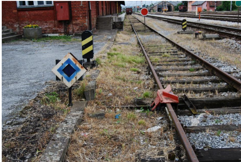
Slika 5. Iskliznica u kolodvoru Karlovac.

U kolodvoru Karlovac svim iskliznicama rukuje se centralno s kolodvorske postavnice. One se koriste kako se pri slučajnom pomicanju vagona ili kretanja lokomotive ne bi ugrozili putovi vožnje. Kolodvor Karlovac ima 7 iskliznica.