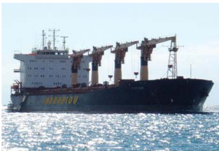
Slika 7. Brod za rasuti teret M.B. Trogir brodara Jadroplov

Jadroplov d.d. osnovan je 1947. godine sa sjedištem u Rijeci, koje se nakon 1956. godine prenosi u Split. Bavi se međunarodnim pomorskim prijevozom robe, a upravlja s osam brodova za rasute terete, ukupne tonaže 217 468 00 GT i 378 101 00 DWT.