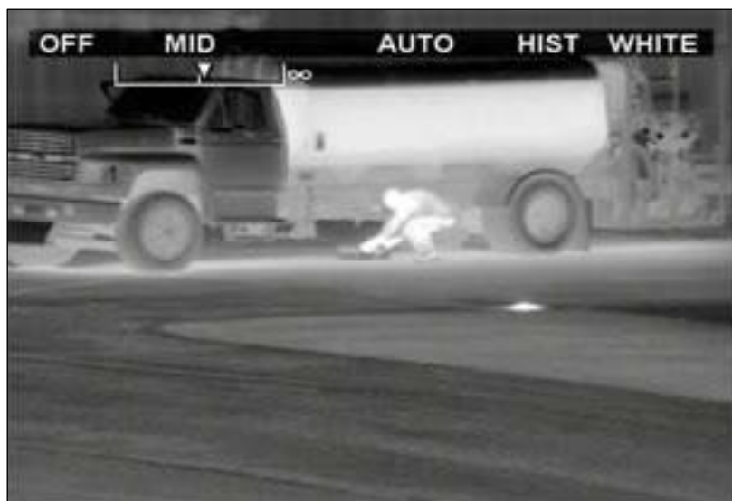
Slika 3: Prikaz slike snimljene termalnom kamerom (URL 3)

Video nadzor, primjerena i prikladna rasvjeta uvelike upotpunjuju funkciju ograde. Video nadzor se prati konstantno 24 sata. Kako bi funkcionirao u svim uvjetima, razvili su se brojni sustavi video nadzora. Tako danas imamo veoma sofisticirane video sustave koji funkcioniraju u potpunom mraku pomoću termalnih kamera kao i sustave koji reagiraju na pokret. Nadzorni sustav CCTV ( eng. Closed- circuit television ) ima visoku razlučivost te brojne mogućnosti ( zumiranje objekta, 3D pomicanje same kamere ). Sve to zajedno čini zadovoljavajući nadzorni sustav.