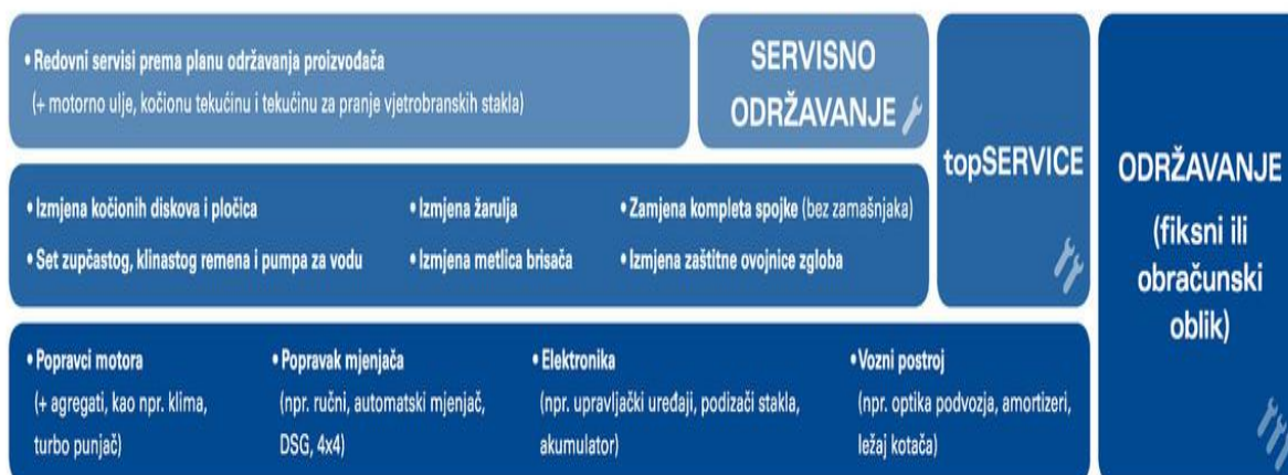
Slika 3. Usluge održavanja vozila tvrtke Porsche Leasing d.o.o., [9]

Servisno održavanje uključuje redovne servise koje propisuje proizvođač vozila, dakle to su izmjena motornog ulja, kočionih tekućina i tekućina za pranje vjetrobranskih stakla, dok top service održavanje, uz usluge servisnog održavanja, uključuje i rezervne dijelove poput žarulja, kočionih diskova i pločica, metlica brisača, spojke, seta zupčastog i klinastog remena te pumpe za vodu i ostalo, koji se troše tijekom eksploatacije vozila.