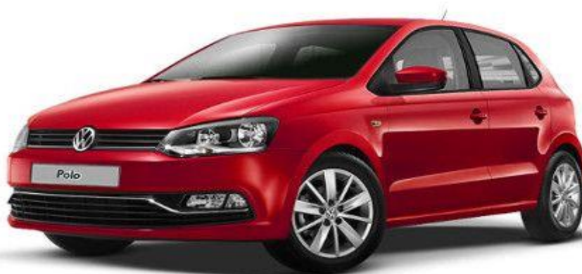
Slika 6. Volkswagen Polo, [15]

Volkswagen Polo je manji gradski auto koji se proizvodi od 1975.-e godine. Od tada je proizveden velik broj Polo vozila te je ovo peti redizajn toga automobila i u rujnu 2017.-e godine očekuje se predstavljanje šestog modela tog automobila. Na Slici 6. može se vidjeti izgled osobnog automobila Polo.