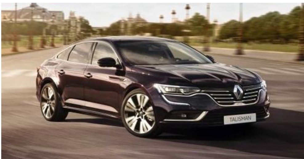
Slika 9. Renault Talisman, [25]

Automobil Renault Talisman u klasi je vozila u kojoj se nalazi i Volkswagen Passat. Na Slici 9. prikazan je izgled modela Talisman.