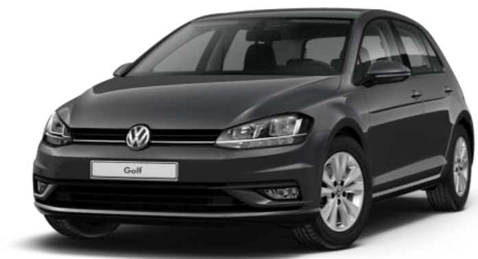
Slika 7. Volkswagen Golf 7, [20]

Volkswagen Golf u proizvodnji je od 1974. godine te je prodan u velikom broju primjeraka. Od početka proizvodnje pa sve do sada proizvedeno je sedam modela Volkswagen Golfa te su u ovom radu izračunati troškovi održavanja najnovijeg modela Golf 7. Na Slici 7. prikazan je izgled osobnog automobila Golf 7, marke Volkswagen.