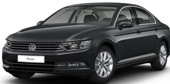
Slika 8. Volkswagen Passat, [20]

Volkswagen Passat proizvodi se od 1973. godine i do danas je proizvedeno sedam modela tog automobila. U ovom radu analiziran je Passat sedme generacije, što je vidljivo na Slici 8.