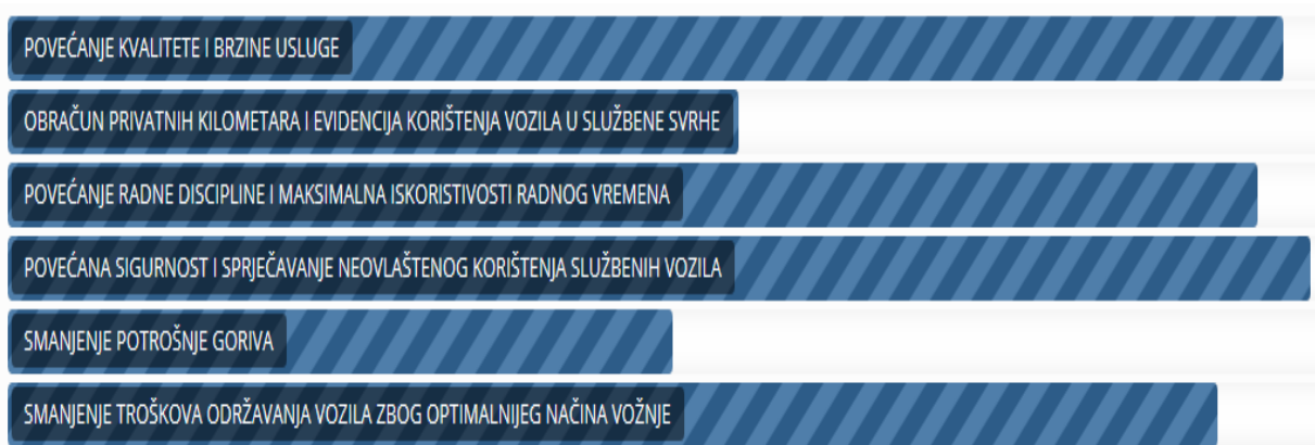
Slika 11. Prednosti Smartivo sustava, [29]

Na slici 11. predočene su prednosti Smartivo sustava te njegova učinkovitost pri upravljanju voznim parkom. Može se uočiti kako se pomoću sustava najbolje vodi obračun privatnih kilometara i evidencija korištenja vozila u službene svrhe, a također se vidi razina povećanja kvalitete i brzine usluge, povećanje radne discipline i maksimalna iskoristivost radnog vremena pomoću praćenja brzine i ostalih parametara, povećanje sigurnosti i sprječavanje neovlaštenog korištenja vozila, ali i znatna ušteda kod potrošnje goriva i održavanja vozila zbog optimalne vožnje, [29].