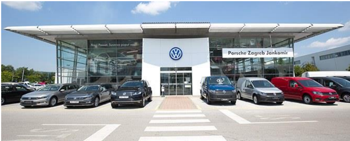
Slika 4. Poslovnica za Volkswagen vozila, [12]

Tvrtka Porsche Zagreb Jankomir osim pružanja usluga leasinga vozila, bavi se i prodajom novih i rabljenih vozila marke Volkswagen, Porsche, Seat, Audi i Škoda, servisom navedenih marki vozila te prodajom rezervnih dijelova. Na Slici 4. prikazana je poslovnica za Volkswagen vozila. U sklopu poslovnice nalaze se servis, lakirnica, limarija, auto praona, uredi, čekaonica, itd.