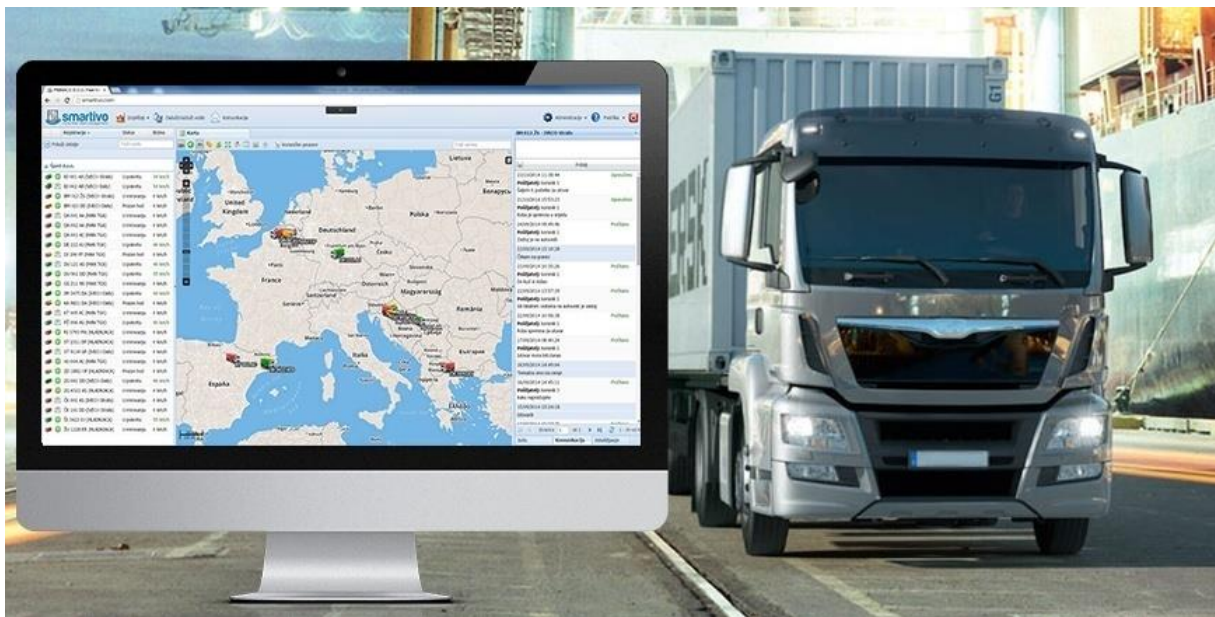
Slika 10. Prikaz Smartivo sustava na računalu, [27]

Na Slici 10. može se vidjeti prikaz Smartivo sustava na zaslonu monitora.