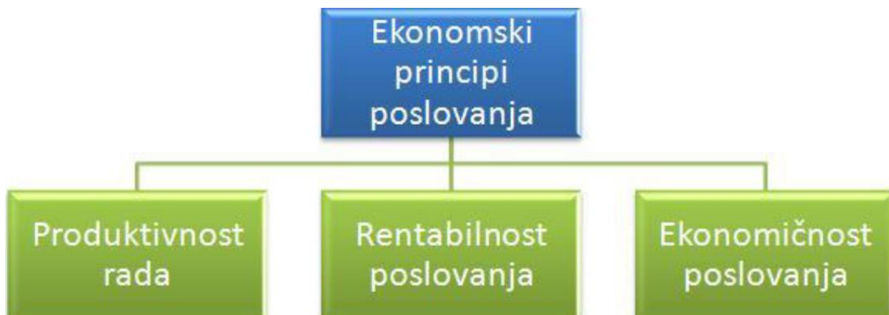
Slika 1. Ekonomski principi poslovanja