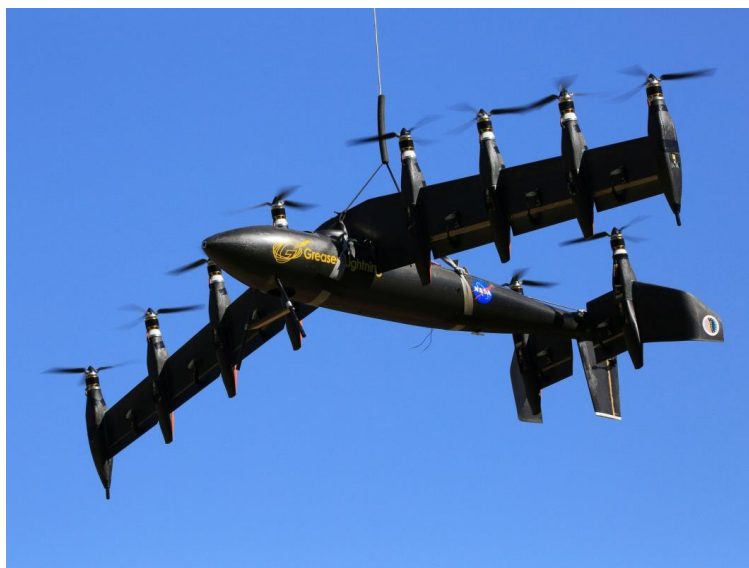
Slika 3. GL-10 Greased Lighting

GL-10 Greased Lightning (slika 3) je prototip VTOL bespilotne letjelice. Pogoni ga 10 električnih motora od koji se osam motora nalaze na krilima i dva se nalaze na horizontalnom stabliatoru.