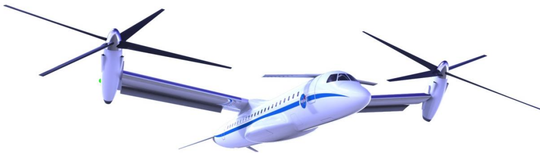
Slika 9. Letjelica s VLT mogućnostima