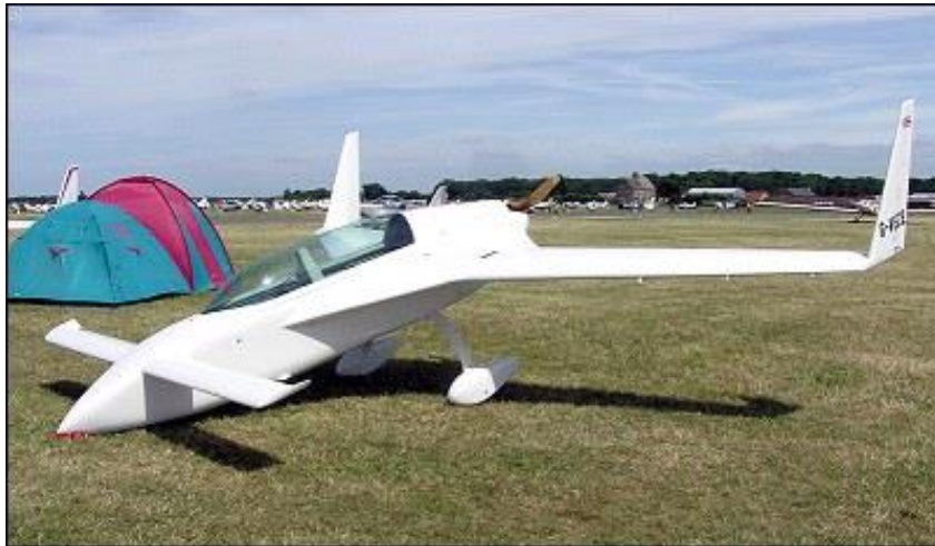
Slika 2. Letjelica kućne izrade Rutan VariEze

Danas postoji veliki broj zaljubljenika u zrakoplovstvo koji sami izrađuju letjelice u svojim kućama. Letjelice kućne izrade se izrađuju pojedinačno i u Sjedinjenim Američkim Državama. Kalifornijski inovator Burt Rutan je proizveo neobičnu laku letjelicu od fibreglassa (Slika 2.) koju kupac (u većini slučaja amater) sam sastavlja kod svoje kuće. Takve letjelice su certificirane od federalne agencije za zrakoplovnu administraciju (Federal Aviation Administration - FAA) kao amaterska eksperimentalna letjelica 7 .