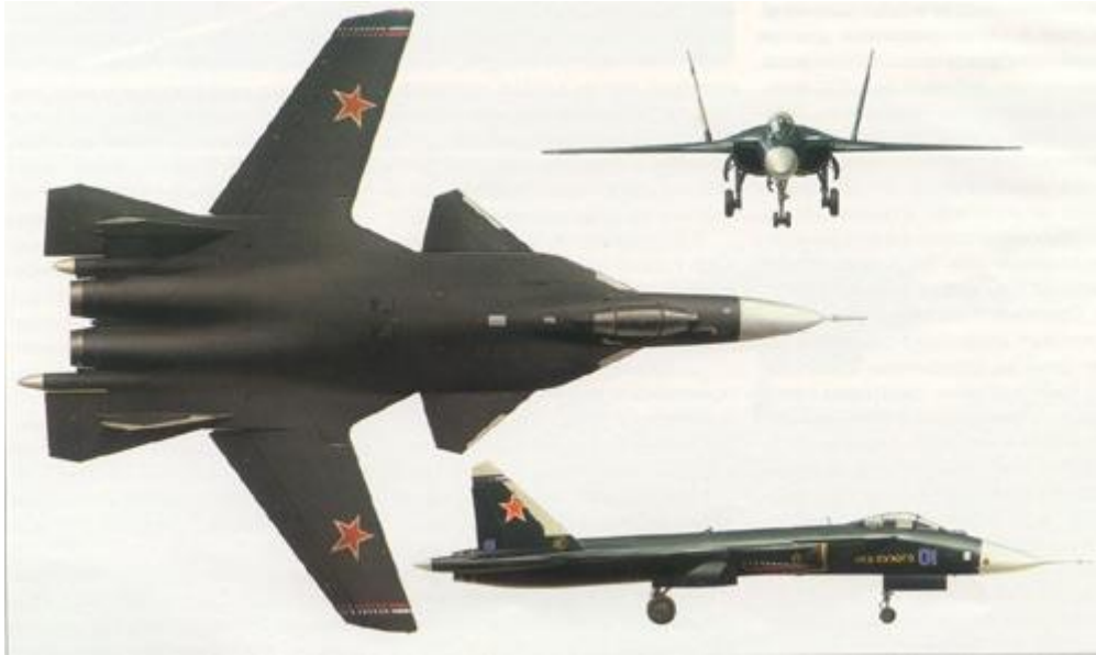
Slika 15. Suhojev Su-47 Berkut