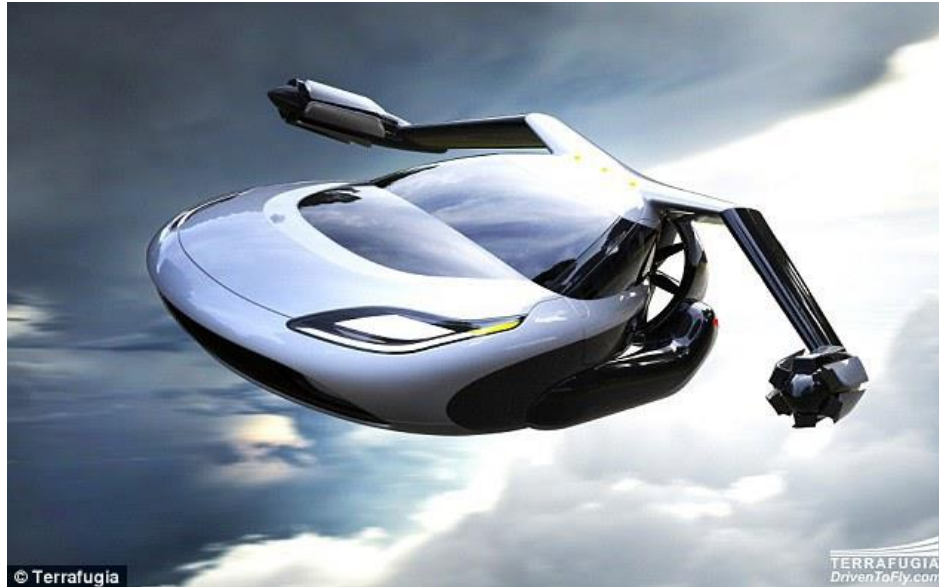
Slika 17. Terrafugia TF-X

TF-X nije potrebna pista, već može vertikalno poletjeti s parkirališnog mjesta. Maksimalna brzina leta je 322 km/h, dok je doseg oko 800 kilometara. Vozilo prima četiri putnika, a sam let bi obavljao autopilot 46 .