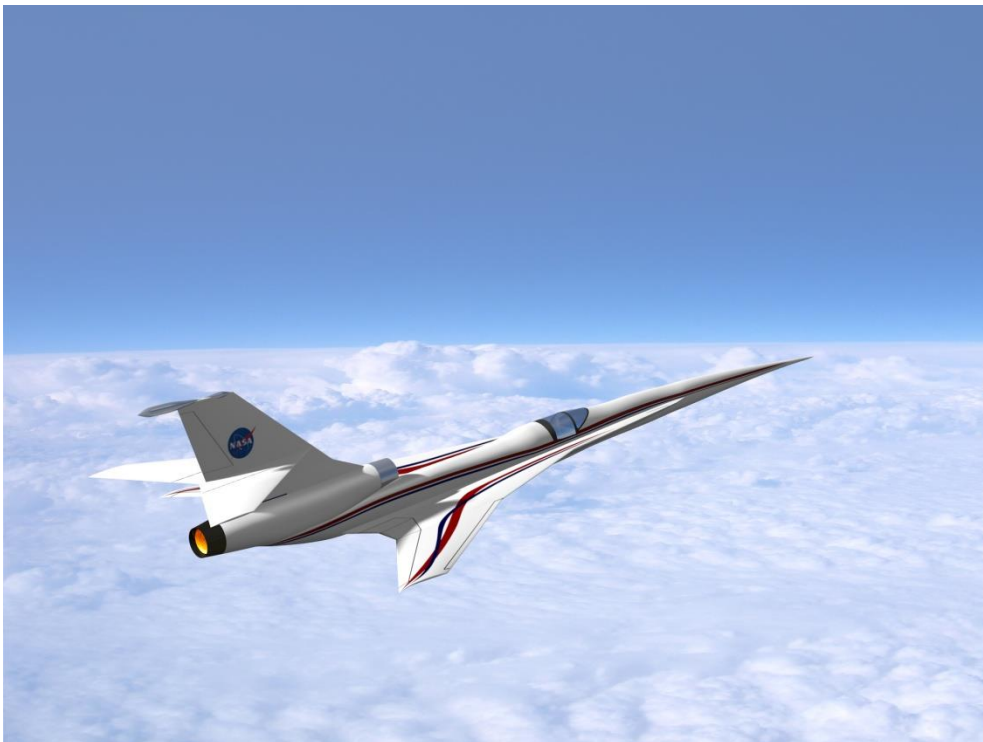
Slika 10. Eksperimentalni zrakoplov s scramjet motorom

CST projekt fokusira se na redukcijske metode vezane uz zvučni udar. Cilj projekta uključuje alate za izradu letjelica niskog zvučnog udara (slika 10.) te utvrđivanje tehnika za objektivno pristupanje nivoima prihvatljivosti zvučnog udara za zajednice koje žive u blizini budućih komercijalnih nadzvučnih letova. Znanje i podaci iz ovog projekta nose sa sobom nastojanja nacionalnih i međunarodnih regulatornih organizacija u svrhu standardizacije dizajna budućih nadzvučnih komercijalnih zrakoplova 29 .