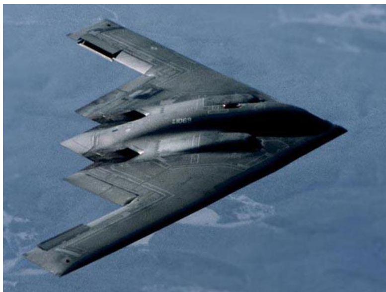
Slika 7. B-2 Spirit