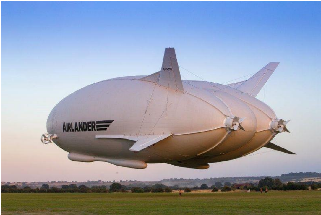
Slika 12. Airlander 10