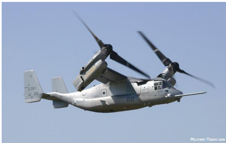
Slika 5. Bell-Boeing V-22 Osprey