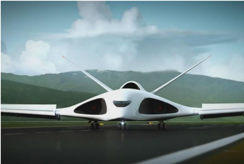
Slika 14. Ruski supersonični transportni zrakoplov PAK TA

Rusija se priprema proizvesti novi supersonični transportni zrakoplov PAK TA (slika 14), pomoću kojeg bi se u najkraćem roku mogli na bilo koju točku na planeti prevesti vojnici i ratna tehnika, uključujući i tenkove s pratećom municijom.