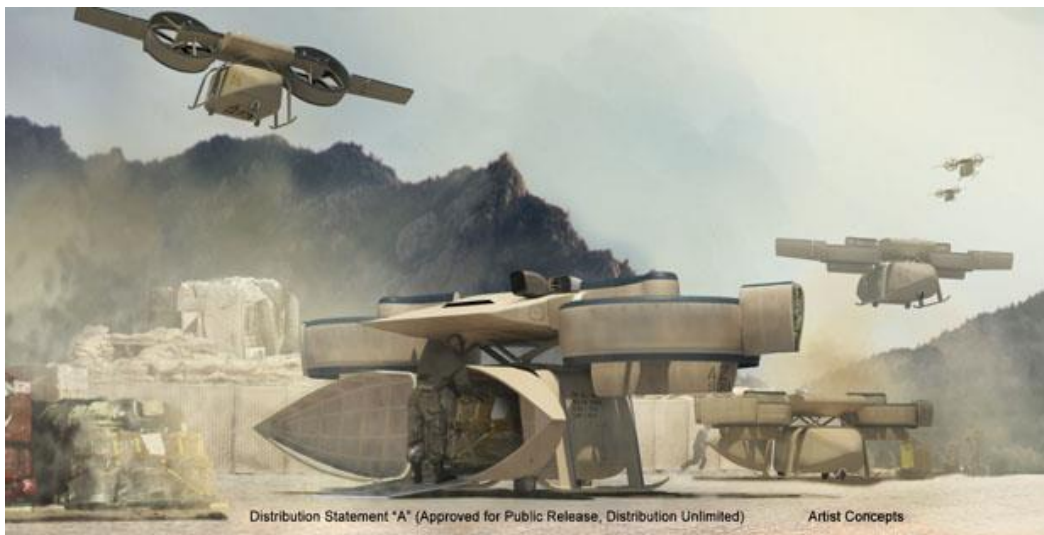
Slika 13. Aerial Reconfigurable Embedded System (ARES)

ARES (slika 13) je koncept u kojem bespilotna letjelica pruža fleksibilan prijevoz tereta. Njezina prednost je što su operativni troškovi manji i vjerojatnost izvršavanja misije je veća. Dva propelera koja imaju mogućnost promjene nagiba omogućuju lebdjenje i slijetanje na nepristupačan teren i brzinu poput aviona. Letjelica bi imala koristan prostor iznad 3.000 lb ( \approx 1.360 kg) što je za 40 % veće od bruto težine aviona 37 .