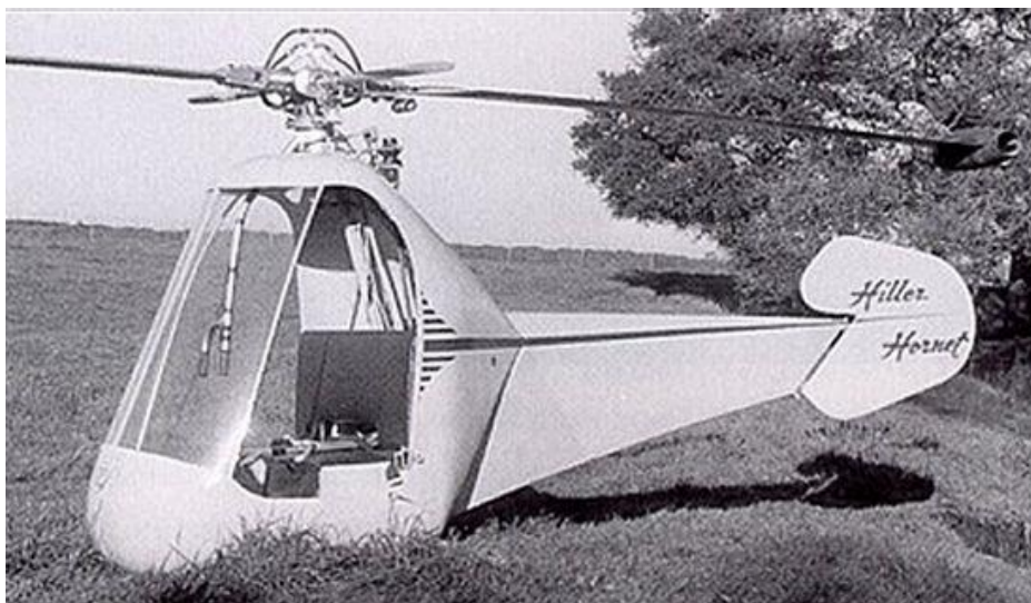
Slika 6. Hiller HJ-1 Hornet tip-jet helikopter.

Međutim kad se motor umjesto u trup zrakoplova postavi na rotor, više ne postoji mehanička interakcija između rotora i trupa, tako da nema više utjecaja okretnog momenta. Jedan od najranijih primjera ovog dizajna je Hiller HJ-1 Hornet (slika 7). Na vrhu rotora se nalazi mlazni motor koji stvara mehaničku energiju gibanja koja vrti rotor. Ovaj dizajn se često naziva „tip-jet“.