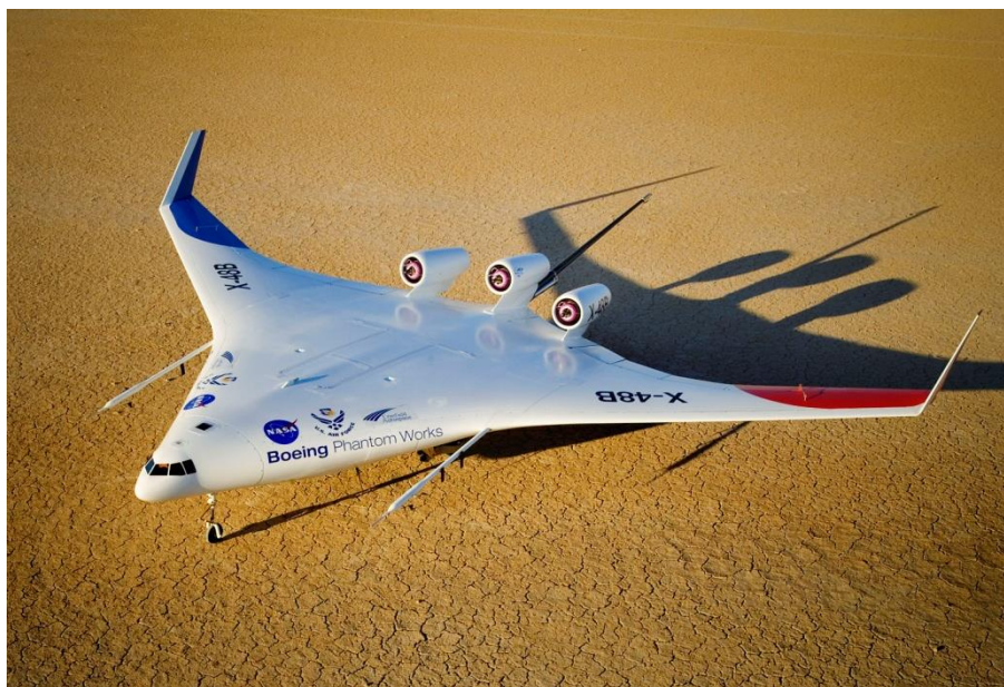
Slika 8. Boeing X-48

Boeing je dizajnirao X-48 (slika 8) bespilotnu eksperimentalnu letjelicu za istraživanje karakteristika BWB letjelica. Cilj programa je naučiti više o upravljanju teretnim BWB zrakoplovom pri malim brzinama leta.