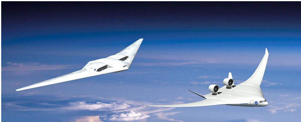
Slika 11. Koncepti transportnih zrakoplova

Sveobuhvatni cilj AATT projekta je istraživanje i razvoj tehnologija i ideja za poboljšanu energetska učinkovitost te okolišnu kompatibilnost sa podzvučnim transportom zrakoplovima s fiksnim krilom (slika 11). Znanje dobiveno iz AATT istraživanja, u obliku eksperimenata, podataka, sustavnih studija i analiza, kritično je za u naumu i izradi čisteg, tišeg i efektivnijeg zrakoplovstva. AATT studije fokusirane su na budućnost s pogledom na letjelice koje su tri generacije ispred današnjih letjelica, a koje zahtijevaju zrela tehnološka rješenja u vremenskom rasponu od 2035. do 2045. godine 30 .