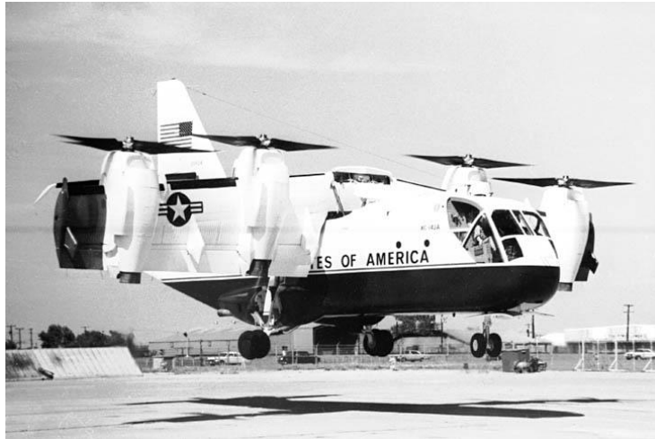
Slika 4. XC-142A

XC-142A (slika 4) prototip letjelice koji je prvi korišten za potrebe izučavanja vertikalnog polijetanja i slijetanja upotrebom krila koja mijenjaju nagib (engl. tilt-wing) iz vertikalnog u horizontalni položaj i obratno.