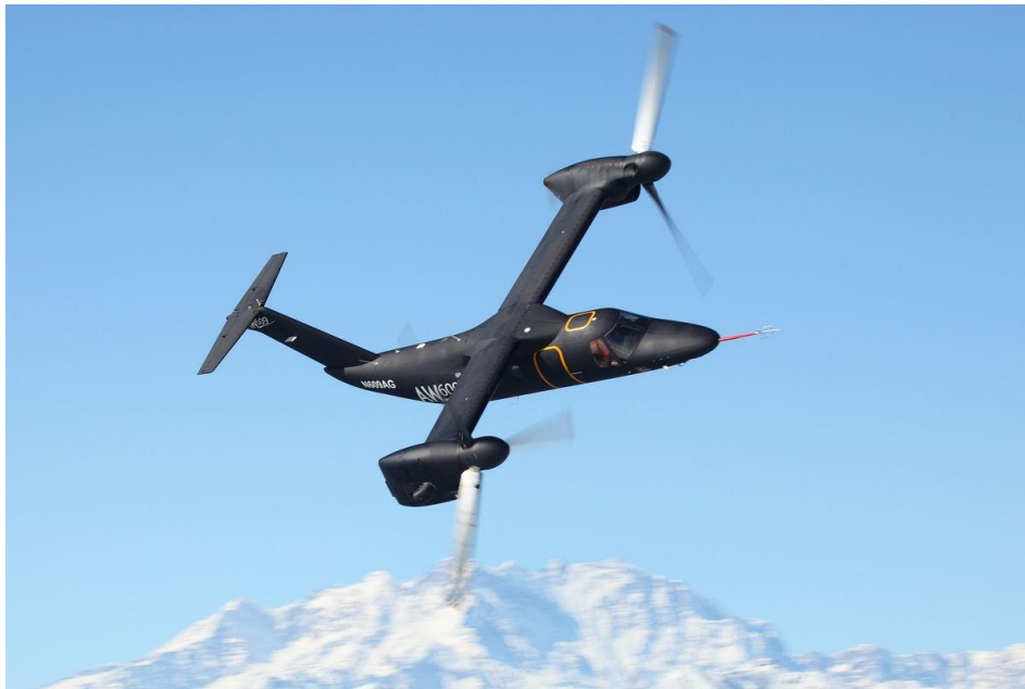
Slika 16. AW 609.

AW 609 (slika 16) je prvi civilni tiltrotor, kapaciteta šest do devet putničkih sjedala koji kombinira komfor turboprop aviona sa mogućnostima vertikalnog polijetanja i slijetanja helikoptera. Dvostruko većom brzinom od helikoptera usporednog kapaciteta i mogućnošću letenja u ekstremnim klimama, od Artika do pustinje. AW 609 je dizajniran da bude najbolji multi-funkcionalni zrakoplov.