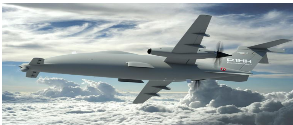
Slika 1. Bespilotna letjelica

Bespilotna letjelica (UAV-Unmanned Aerial Vehicle) je letjelica ili zrakoplov bez posade, koja se može nadzirati na daljinu ili letjeti samostalno uporabom unaprijed programiranog plana leta ili pomoću složenih autonomnih dinamičkih sustava.