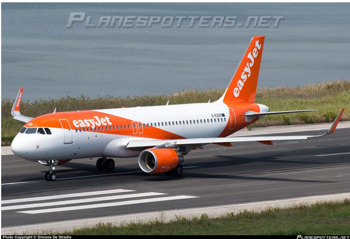
Slika 4. Airbus A320-200

Na slici 4 je prikazan Airbus A320-200 kojeg koristi easyJet.