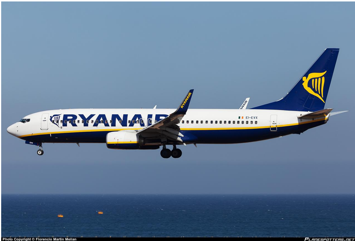
Slika 3. Boeing 737-800

Na slici 3 prikazan je jedini zrakoplov u floti Ryanair-a, Boeing 737-800.