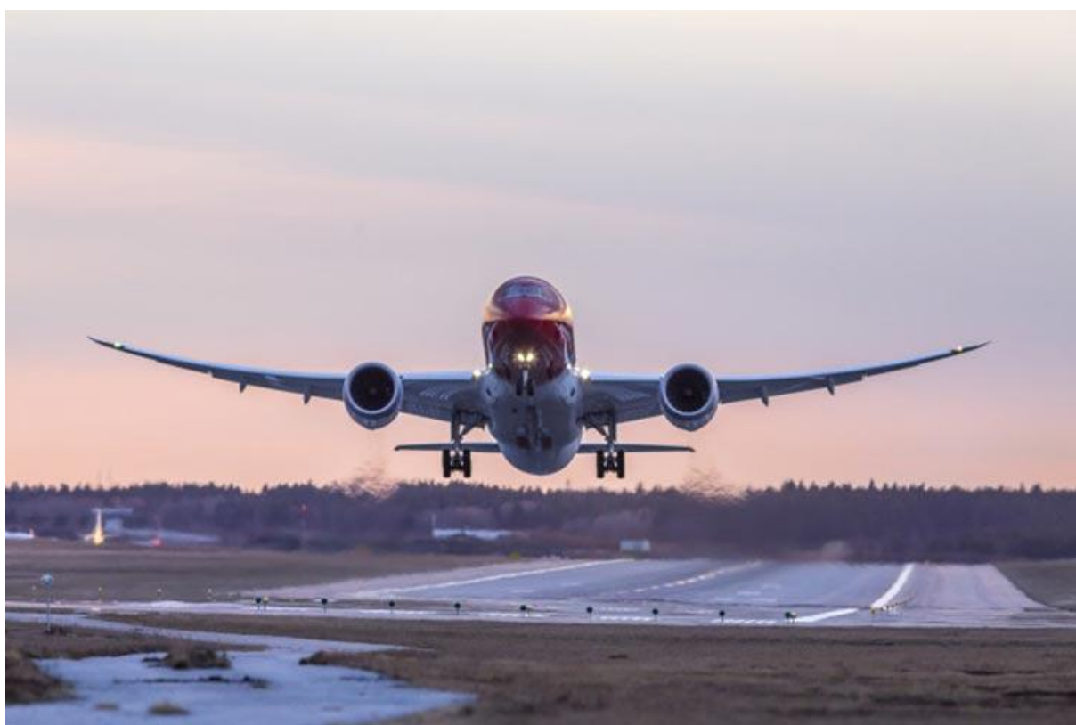
Slika 2. Boeing 787 Dreamliner

Flota Norwegian-a se sastoji od preko 100 zrakoplova, među kojima su Boeing 737-800 za kratke rute te Boeing 787 Dreamliner (prikazan na slici 2) za duge rute, prosječne starosti 3,6 godina. Norwegian kontinuirano uvodi nove zrakoplove u svoju flotu, te su tako uz već postojeću narudžbu 42 Boeinga 737-800 u siječnju 2012. godine naručili 222 nova zrakoplova uključujući 100 Boeinga 737 MAX8, 22 Boeinga 737-800 i 100 Airbusa A320neo. 10