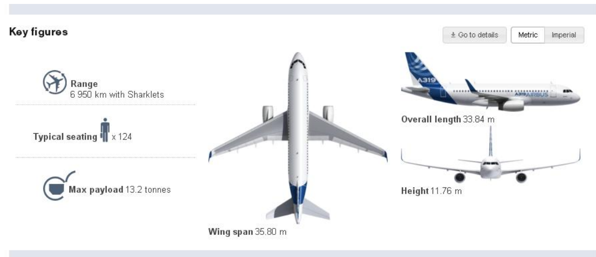
Slika 6. Airbus A319-100

Još jedan zrakoplov iz porodice A320, kategoriziran kao kratkolinijski uskotrupni zrakoplov, ustvari je smanjena verzija prethodno opisanog Airbusa A320-200.