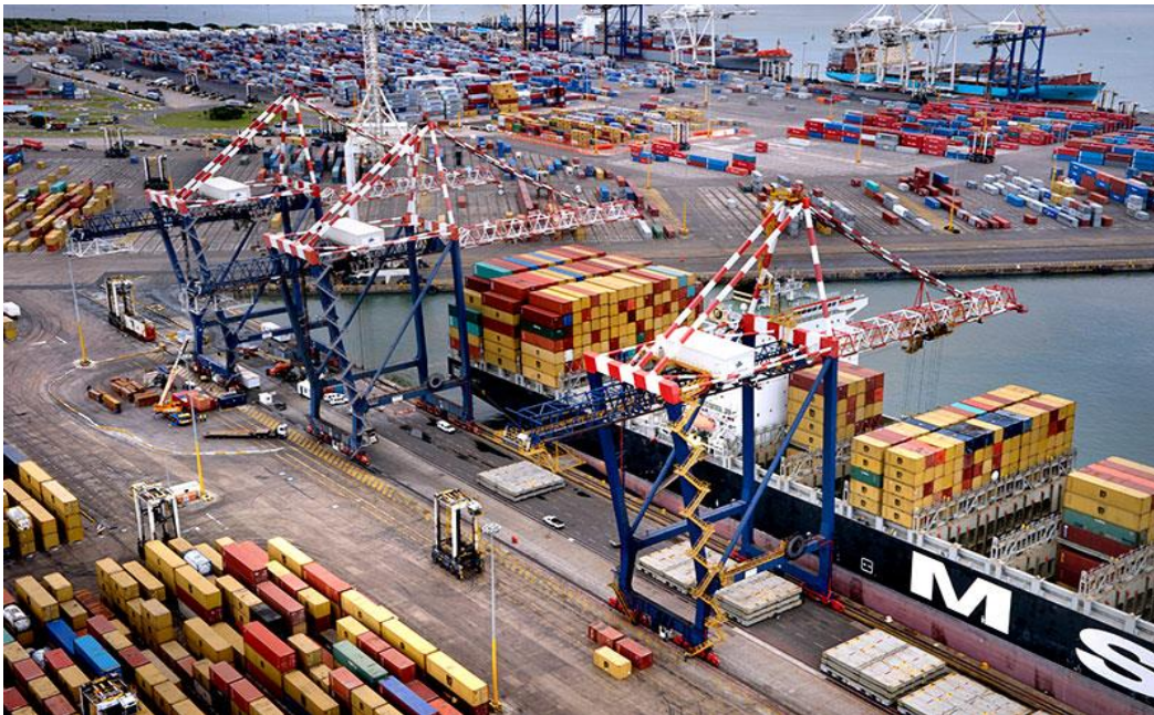
Slika 7. Lučki terminal

Lučki terminali najčešće se smještaju u odvojene lučke bazene (zbog potrebe većih kopnenih površina, a često i zbog potrebe sigurnosti) te se ukupni lučki promet alokira i usmjerava na privatne i prekrajne kapacitete pojedinih terminala.