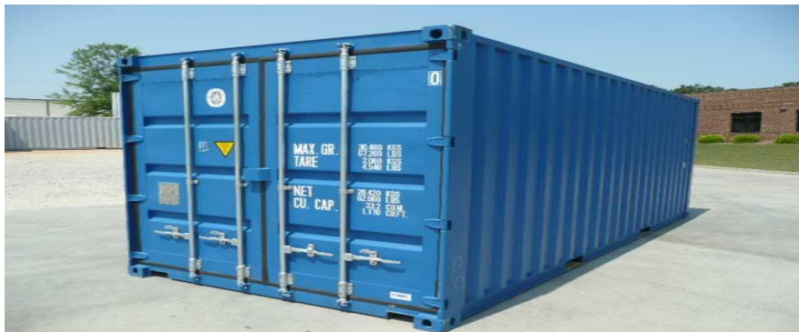
Slika 4. Kontejner