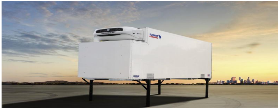
Slika 3. Izmjenjivi transportni sanduk

Prema listi termina koje su formirale Europska unija, Europska konferencija ministara transporta (ECMT) i Ekonomska komisija za Europu pri Ujedinjenim Narodima (UN/ECE) osnovne intermodalne transportne jedinice (ITU) su: kontejneri, izmjenjivi transportni sanduci i poluprikolice, koje su slikovito prikazane u nastavku.