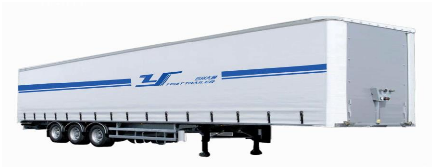
Slika 5. Poluprikolica