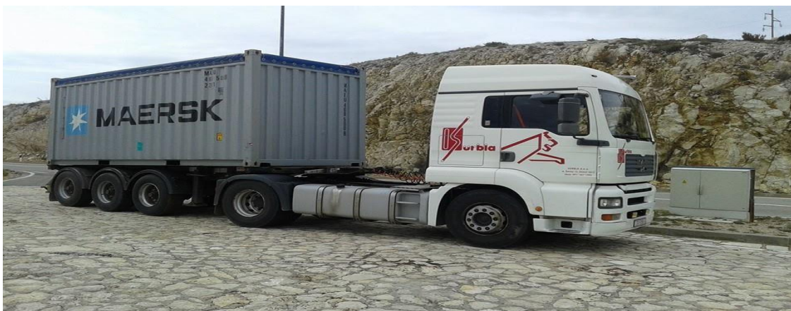
Slika 6. Prijevoz kontejnera kamionskom poluprikolicom

Prijevoznik svake grane prijevoza, odnosno prometa (transporta, prijenosa) ima svoje brojne specifične karakteristike koje treba imati na umu pri izučavanju i eksploataciji prometnih resursa (...). Prijevoznik obavlja svoje temeljne funkcije ne samo u konvencionalnom nego jednako tako i u kombiniranom multimodalnom transportu i prometu