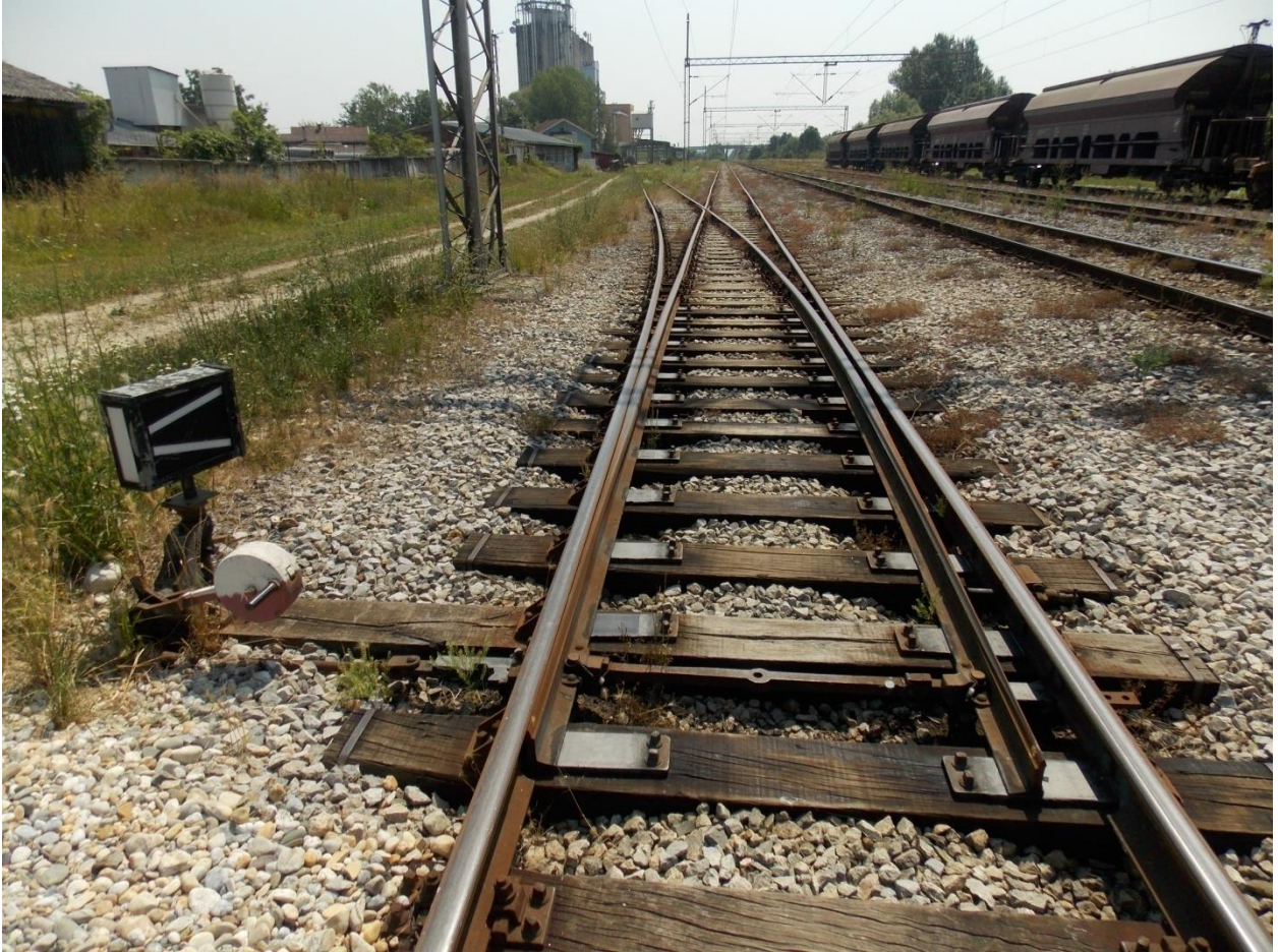
Slika 4. Skretnica pod rednim brojem 1S osigurana skretničkom bravom

Skretnica pod brojem 1S osigurana je skretničkom bravom u položaj u pravac i u ovisnosti je sa iskliznicom I1 na industrijskom kolosijeku „Agroprerada“. Ključ iskliznice I1 čuva prometnik vlakova.