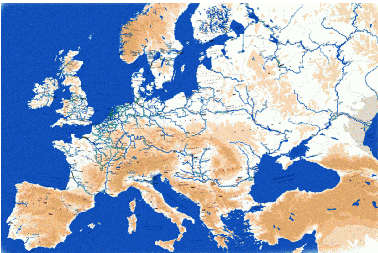
Slika 1. Prikaz mreže unutarnjih plovnih putova Europe, [17]