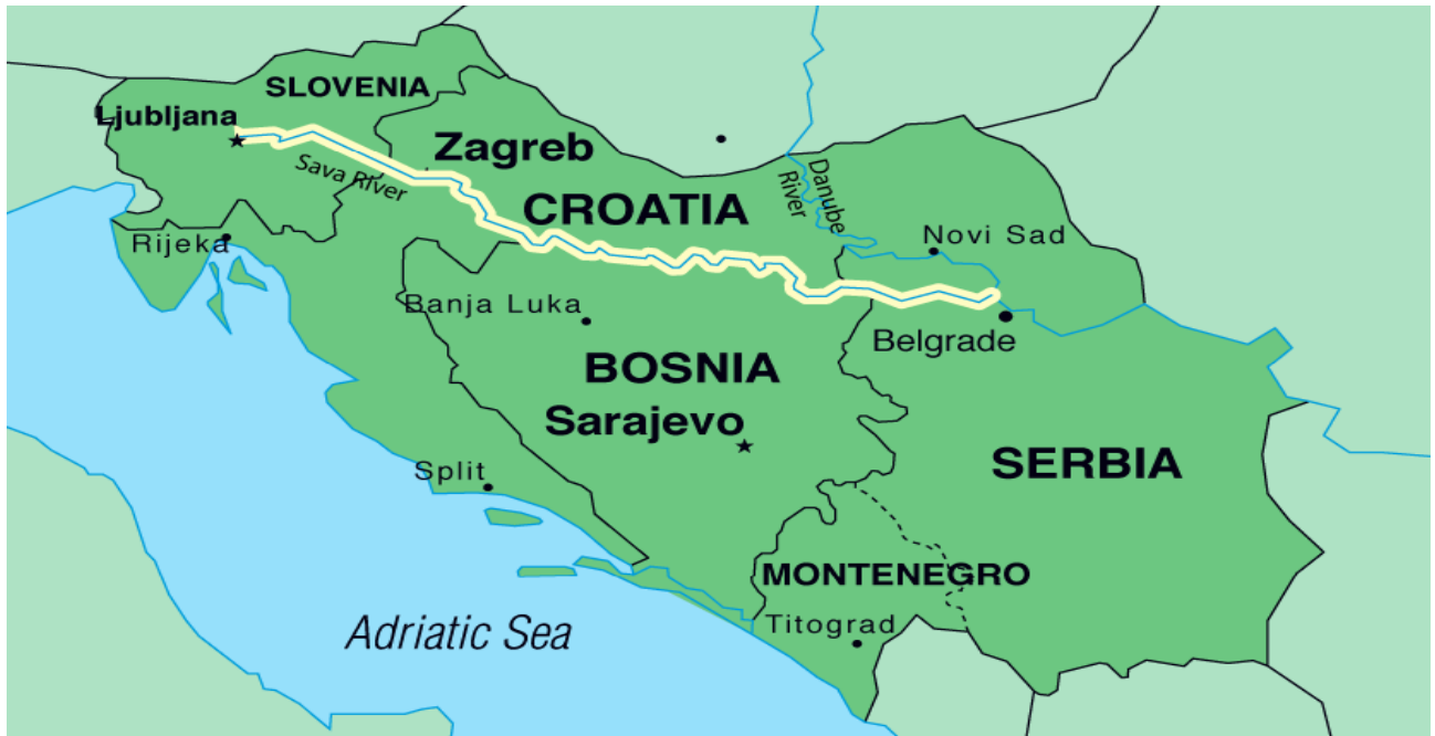
Slika 3. Prikaz sliva rijeke Save, [8]

Sava je desna pritoka Dunavu u Beogradu. Duga je 945 km i pokriva 95,719 km 2 površine, vidi sliku 3. Protječe kroz četiri države: Sloveniju, Hrvatsku, Bosnu i Hercegovinu (predstavlja sjevernu granicu) i Srbiju. Visina njenog izvora je 1,222 m i ima prosječno istjecanje od 1,722 m 3 /s 23 .