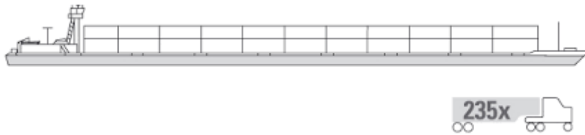
Slika 2. Prikaz kontejnerskog broda na unutarnjoj plovidbi, [10]

Uz plovila za suhi teret i kontejnerskih brodova na unutarnjim plovnim putovima koriste se još i RO-RO plovila. Na RO-RO brodove se utovar i istovar objekata koji se prevoze izvodi putem lučkih rampi ili rampi plovila. Najčešće se RO-RO brodovima prevoze teški tereti, manji prijevozna sredstva, teretne prikolice itd.