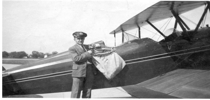
Slika 1. Ukrcaj pošte u zrakoplov