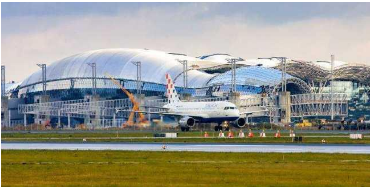
Slika4. Novi terminal MZZ

Izvor: http://www.croatiaweek.com/wp-content/uploads/2015/12/1-18.jpg , 21.siječnja 2016