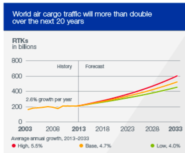
Slika2. Prikaz zračnog kargo prometa

Zračni kargo promet kako u Svijetu tako i u Europi posljednjih je četrdesetak godina snažno rastao. Godine 1993. sve članice EU počele su primjenjivati jedinstvena pravila za licenciranje zračnih prijevoznika. Posjedovanje dozvole znači odobrenje države članice za pružanje usluga prijevoza putnika, tereta i pošte. Liberalizacija tržišta i uspostava prava pružanja usluge prijevoza na području EU nisu prijevoznicima u potpunosti riješili probleme, već su nastali i novi. Liberalizacija je dovela do rasta broja prijevoznika, povećanja zračnog prometa, veće preopterećenosti kao i zagušenosti zračnih luka. Natjecanje za udio na tržištu ujedinilo je europske zračne luke u komercijalno bitne i uspješne globalne saveze. Intermodalnost se javlja kao način podrške daljnjem razvoju svjetskog kargo prometa. U 2009. godini svjetski zračni kargo promet pao je za 11,3%, nakon pada za 1,8% u 2008. i rasta od 3,3% u 2007. godini. U 2008. i 2009. godini prvi se put dogodilo da je zračni kargo promet opadao dvije godine za redom (slika2), uslijed globalne recesije i to u gotovo svim regijama svijeta, pri čemu su tržišta više ovisna o industrijskoj proizvodnji prošla lošije nego ona manje ovisna. Porast cijene goriva uzrokovao je preusmjeravanje tereta sa zračnog na jeftiniji cestovni i pomorski prijevoz već početkom 2005. 9