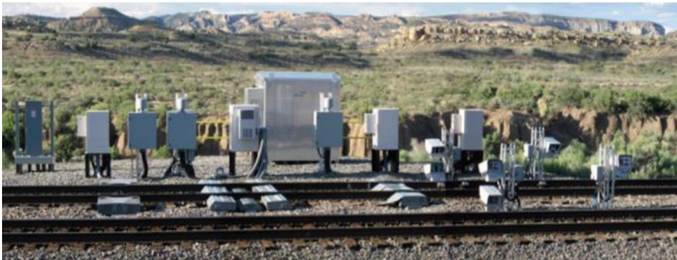
Slika 2: Senzori uz tračnice