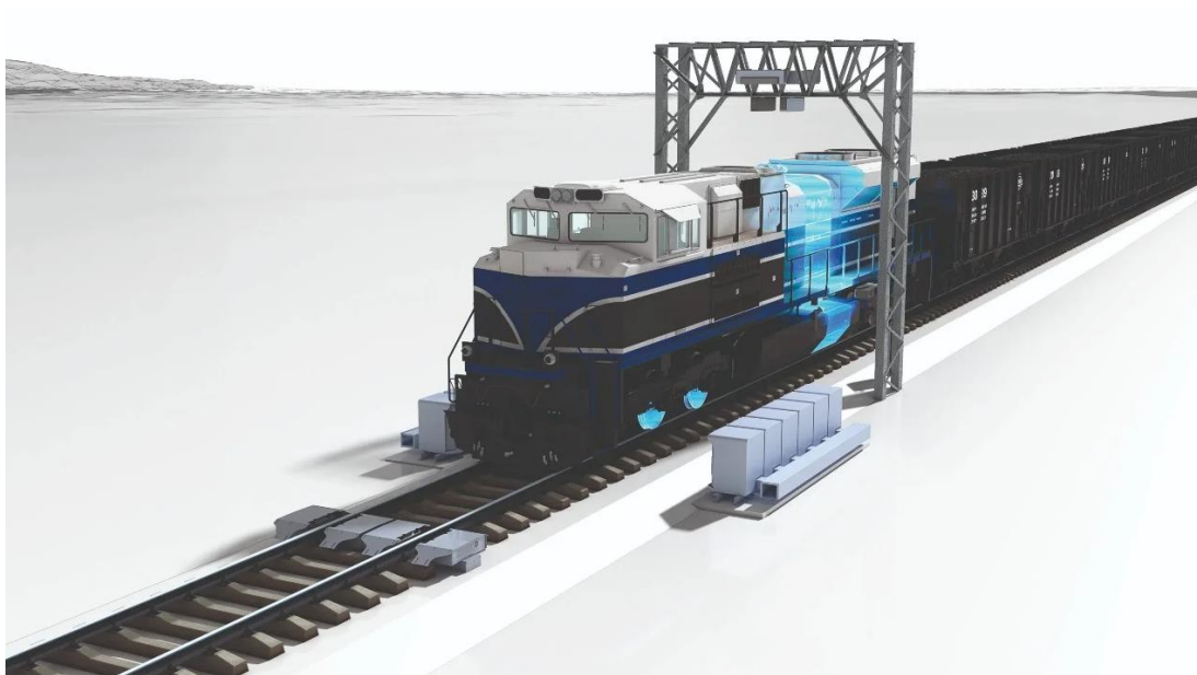
Slika 3: IVG sustav