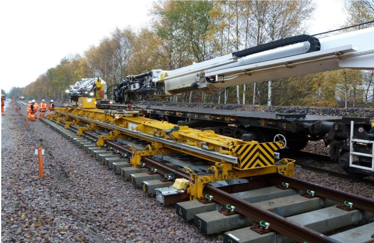
Slika 4: Robotska ruka na mobilnoj platformi