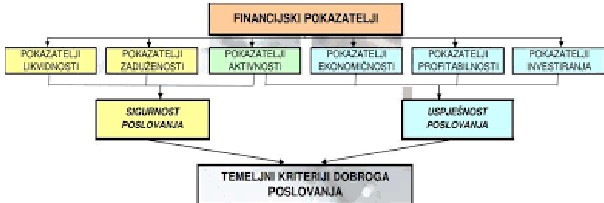
Slika 4 slikovni prikaz financijski pokazatelja

U nastavku će ukratko biti objašnjen svaki od navedenih pokazatelja. Prikazat će se njihove karakteristike, definicije kao i izračuni koji se koriste za dobivanje navedenih pokazatelja.