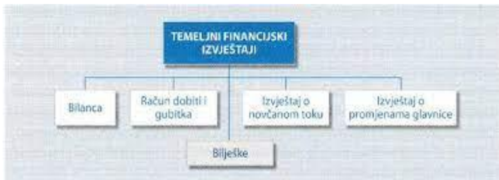
Slika 3 Slikovni prikaz temeljnih financijskih izvještaja

Posljednji temeljni financijski izvještaj su bilješke uz financijske izvještaje koje služe kao dopuna temeljnim financijskim izvještajima, odnosno oni pružaju dodatne informacije i objašnjavaju neke ili sve položaje u bilanci, računu dobiti i gubitka te novčanom tijeku.