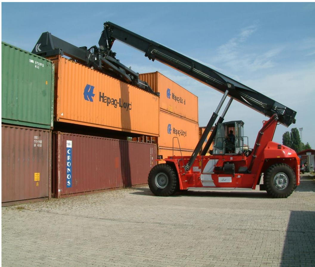
Slika 10. Prijenosni manipulator Kalmar tip Contchamp DRF 400 – C5

40 tona, prijenosnik tip “Beloti B 75” nosivosti također 40 tona i viličar tip “Kalmar DC 13,6” nosivosti 12 tona, viličar Linde nosivosti 8 tona, viličar Linde nosivosti 5 tona te dva viličara Linde nosivosti 3 tone.